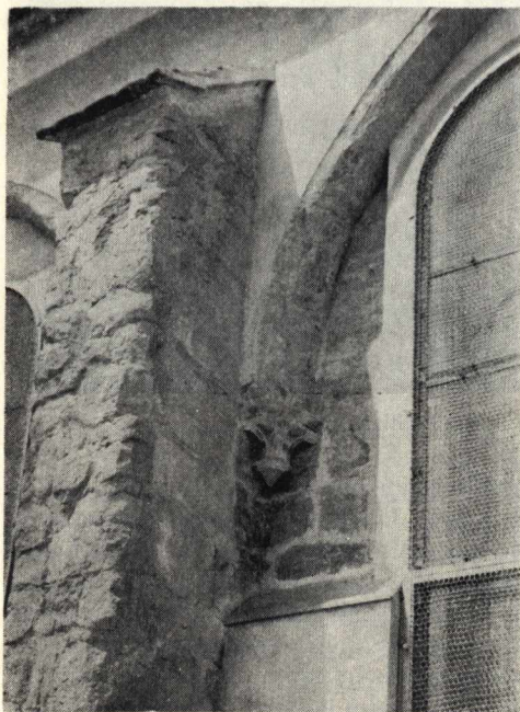
4. A déli főhajófal egyik konzola

egy, a fejezetekhez hasonlóan stilizált növényi díszű konzol helyezkedik el. A küszöb és a timpanon, valamint — a kőtári emlékműanyagból és a Porta Speciosa analógiájából következtetve — a ma már hiányzó oszloptörzsek is vörösmárványból készültek. A kaput 1486-ban falazták be, minthogy a kerengő ekkor készülő boltozatának egyik válla éppen a kapu tengelyébe esett. S végül, ha H. Gyürky Katalin ásatási eredményei alapján azt is figyelembe vesszük, hogy a XIII. századi kerengő udvari falai majdnem ugyanott helyezkedtek el, mint a későgótikus átépítés ma is álló falai, azt is biztosra vehetjük, hogy a későromán kerengőt nem látták el boltozattal, hiszen — az akkor használatos keresztboltozási rendszer mellett — a szóbanforgó kapu elhelyezése nem tette lehetővé ezt. A boltozatlan kerengő tetőszéke hosszabb ideig rossz állapotban lehetett. Ezt látszik tanúsítani Kőfalvi Imre észrevétele, amely szerint a Porta Speciosán régi vízközpödés nyomait találta.