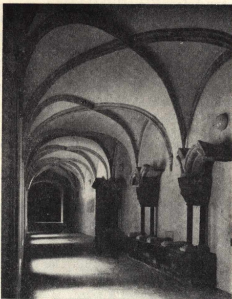
8. Kőtár részlete a román kori kerengőárkákkal