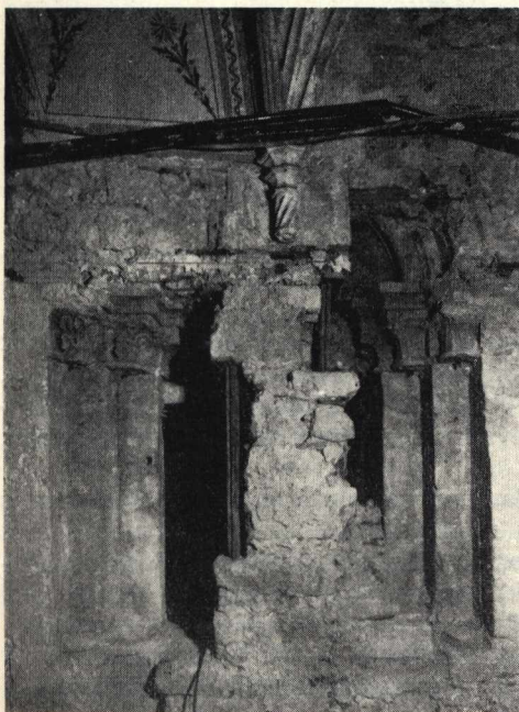
6. A refektórium bejárata feltárás közben