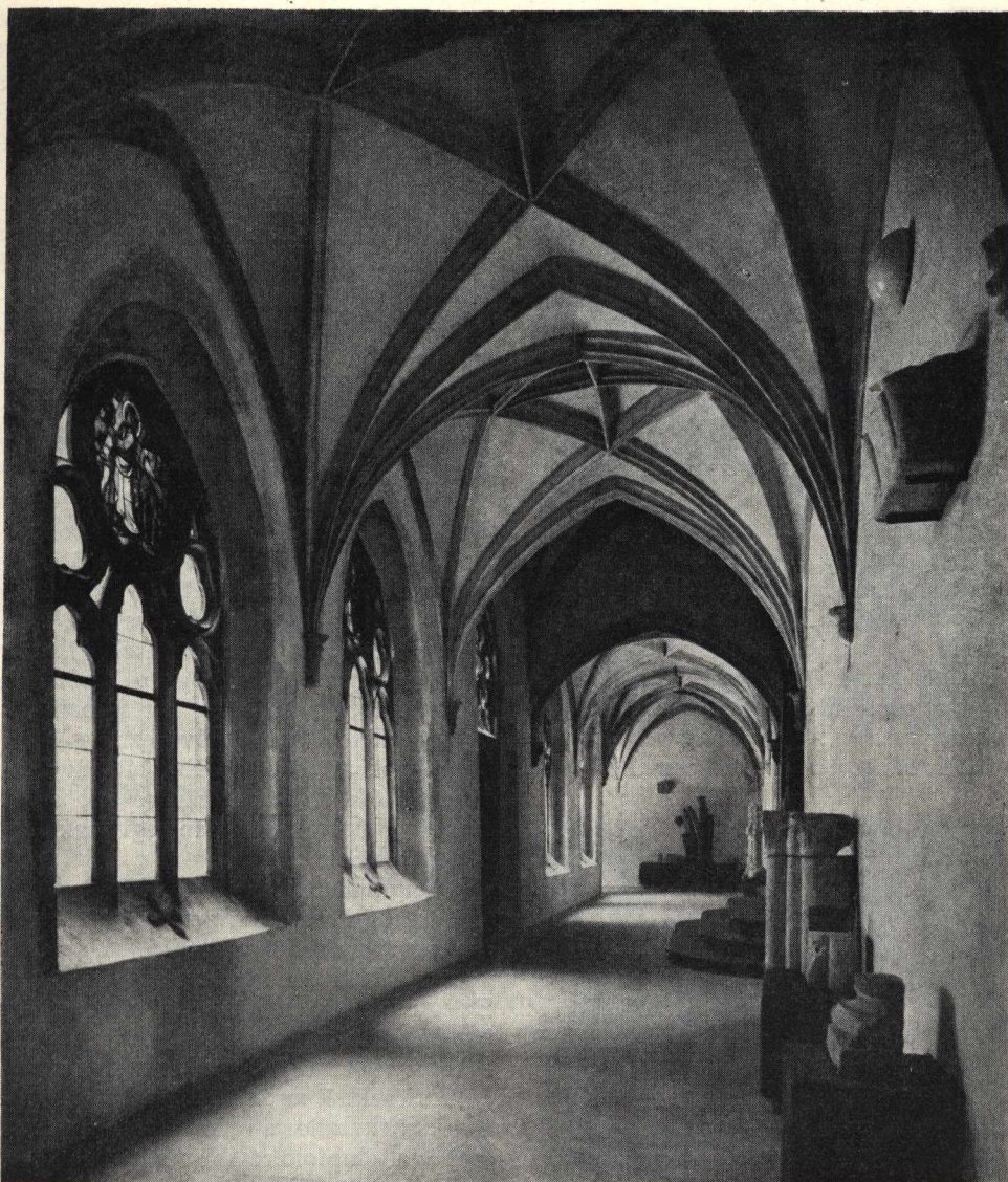
2. Az északi kerengőfolyosó a helyreállítás után

Ezt a támpillért tehát, amely mindhárom szabad oldalán vakolva volt, ugyancsak a XV. századi köpenyezéskor építették be, amikor az új falsíkot a Porta előépítményének — és egyben a szóbanforgó támpillérnek — a külső síkjában alakították ki. E támpillér egyébként külön érdekességgel is szolgál. Alsó szakasza nem építési munka eredménye, hanem egyszerűen az eredeti helyén hagyott talajközetből van kifaragva, bizonyoságául annak, amit H. Gyürky Katalin ásatásai és az in situ-részletek elhelyezkedési viszonyai is megmutatnak, hogy t. i. a kerengő és az udvar járószintje idővel mélyebb szinten alakult ki és a falazás a talajszintből kiálló homokkőszikla előnyének felhasználásával történt. Leszámítandó természetesen a felhasznált talajközet magas-