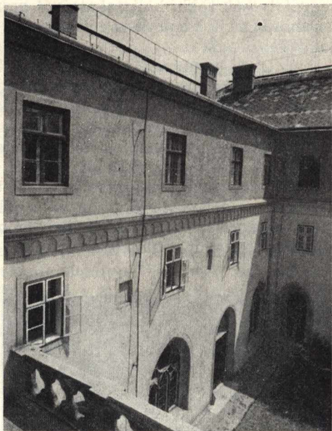
9. Kolostorudvar részlete a keleti kerengőszárny helyreállított homlokzatával

teszi ugyanis, hogy a hamis műemléki szemlélettel készült purista helyreállítások nyomait — az eredeti értékek hatásának érvényesítése érdekében — ahol csak lehet, eltávolítsuk. Ezt tettük Pannonhalmán is. Feltételezzük, hogy a középkori emlékekben gazdagabb középeurópai országoknak kevésbé van erre szükségük, mint nekünk magyaroknak.