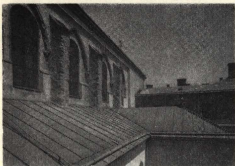
3. A főapátsági templom déli gádorfala helyreállítás után

egy, a fejezetekhez hasonlóan stilizált növényi díszű konzol helyezkedik el. A küszöb és a timpanon, valamint — a kőtári emlékműanyagból és a Porta Speciosa analógiájából következtetve — a ma már hiányzó oszloptörzsek is vörösmárványból készültek. A kaput 1486-ban falazták be, minthogy a kerengő ekkor készülő boltozatának egyik válla éppen a kapu tengelyébe esett. S végül, ha H. Gyürky Katalin ásatási eredményei alapján azt is figyelembe vesszük, hogy a XIII. századi kerengő udvari falai majdnem ugyanott helyezkedtek el, mint a későgótikus átépítés ma is álló falai, azt is biztosra vehetjük, hogy a későromán kerengőt nem látták el boltozattal, hiszen — az akkor használatos keresztboltozási rendszer mellett — a szóbanforgó kapu elhelyezése nem tette lehetővé ezt. A boltozatlan kerengő tetőszéke hosszabb ideig rossz állapotban lehetett. Ezt látszik tanúsítani Kőfalvi Imre észrevétele, amely szerint a Porta Speciosán régi vízközpödés nyomait találta.