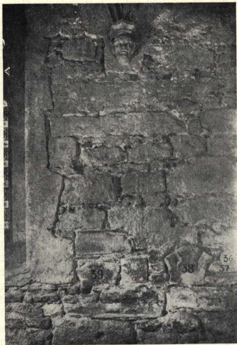
5. Másodlagos románkori tagozatos kövek a későgótikus kerengőfalban

Az 1486-os évszámmal jelezett későgótikus építési periódus nemcsak a padlószintet szállítja le, hanem — az imént tárgyalt XIII. századi részekről eltekintve — a teljes kerengőt átépíti. A keresztfolyosó lényegében ma is XV. századi formáját őrzi: ez a kerengő valamennyi udvari falára, ezenkívül a keleti, nyugati és északi szárny traktusfalára, illetve annak köpenyezésére és teljes boltozatára egyaránt vonatkozik. Ekkor készültek a boltvállak emberfejes és növényi díszű konzolai. Előbbiek a bűnöket, utóbbiak az erényeket jelképezik a jó és rossz harcában. Ezért helyezte azokat általában egymással szembe a gótikus mester. A kerengőablakok mai rendszere is ekkor váltja fel a már csak másodlagos tagozott kövekből rekonstruálható ikeroszlopos XIII. századi román nyílásformát, melyet a kerengőben kőtárszerű felállításban rekonstruáltunk. A Porta Speciosa melletti későgótikus falfülkéről már megemlékeztünk. Döntő változást jelent a kolostorudvar megjelenésében, hogy a kerengő-