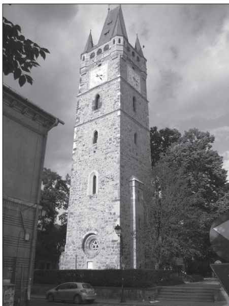
A nagybányai Szent István-torony.

Az elmúlt években Magyarországon kibontakozott hungarikummozgalom és a vele szoros összefüggésben álló értékőrző/értékgyűjtő mozgalom esetében szintén hasonló tapasztalható. Három vonatkozásban mindenképpen: 1. a nemzeti értékek feltárása és értéktárba gyűjtése felső, állami szintről jött kezdeményezés nyomán indult el; 2. az értékfeltáró munka módszerét és lépéseit, az érték felterjesztéséhez használt adatlapot és a szükséges mellékleteket,