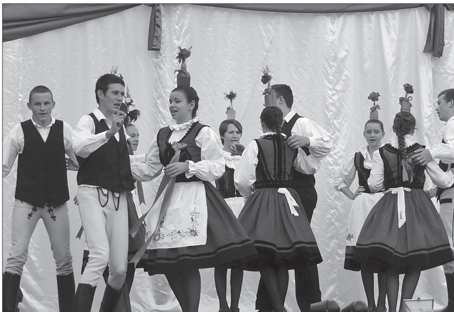
A szentgericei üveges tánc.

Ennek fényében a hungarikumokról szóló törvényt és a magyar értéktáró mozgalmat olyan folyamat részének tekinthetjük, mely a túlszabályozott, számtalan jogi és technikai kifejezést felvonultató nyelvezetet fordítaná át