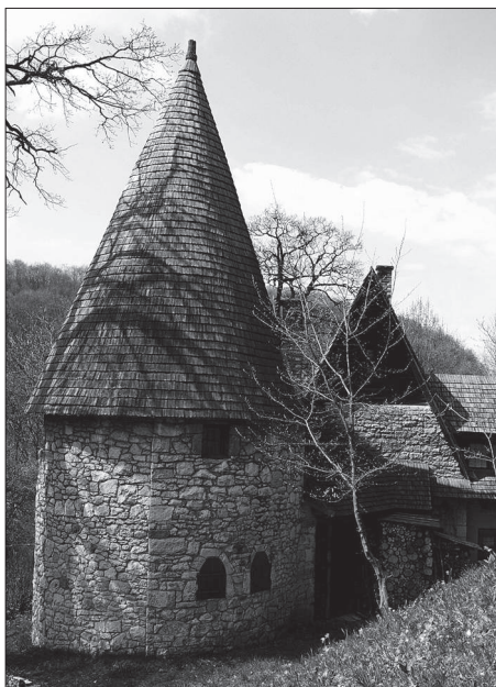
A sztánai Varjúvár.

olyan tulajdonságnak, mely – ahogy az Értelmező szótárban is olvasható – valaminek „a társadalom és az egyén számára való fontosságát fejezi ki” (MÉSZ 1992: 333). A nemzet értékek – és a hungarikumok – tehát azokat a magyarság számára fontos javak összességét jelentik, amelyeket a múltból hagytak ránk, de a jelenben hozott döntéseket és a jövőre vonatkozó elképzeléseket egyaránt meghatározzák.