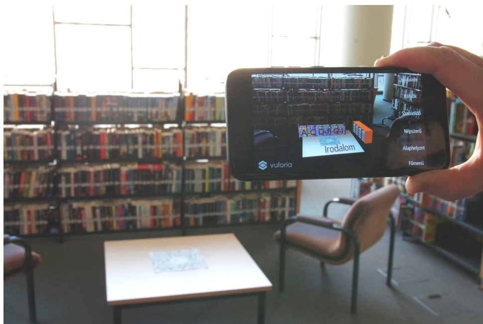
2. ábra Az Irodalom témát kiválasztva megjelenő modell

a tartalmat – jelen esetben a polcot – megjeleníti. (lásd 2. ábra) Ezt követően az alkalmazás gombjaival a modell szabadon változtatható, azzal interakció kezdeményezhető.