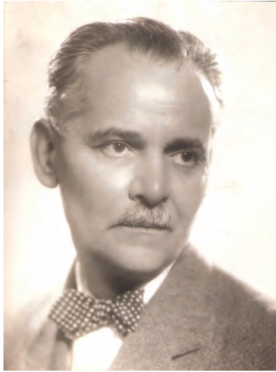
41. kép: Visszavonulva: Fodor Ferenc 1950 körül Withdrawn: Ferenc Fodor c. 1950