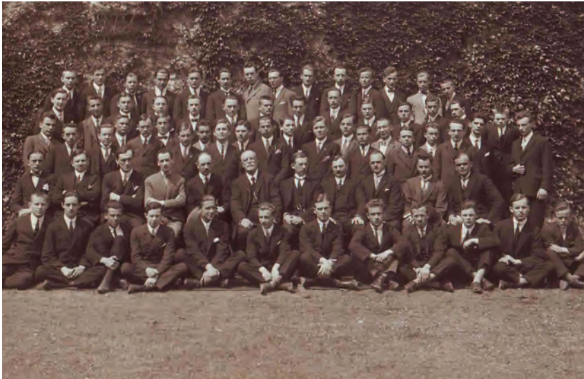
32. kép: Az Eötvös Collegium tanárai és diákjai 1926-ban Lecturers and students of the Eötvös Collegium, 1926