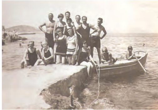
35. kép: Nyaralás Lussinban (ma: Lošinj, Horvátország) 1927-ben Summer vacation in Lussin (today Lošinj, Croatia), 1927