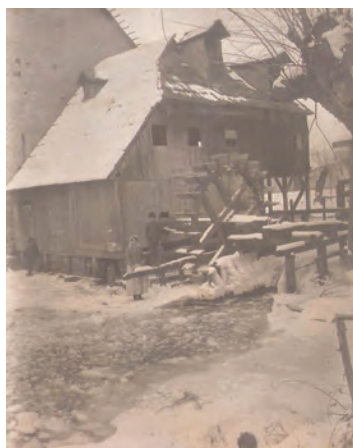
26. kép : A karánsebesi malom, 1918 A Karánsebes mill (today: Caransebeș, Romania), 1918