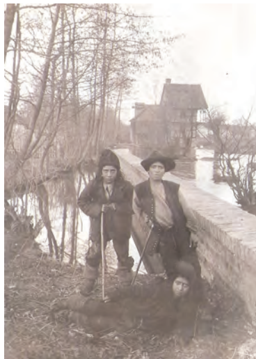
25. kép : Három román fiú a karánsebesi malom előterében 1918-ban Three Romanian boys in front of a Karánsebes mill (today: Caransebeș, Romania), 1918