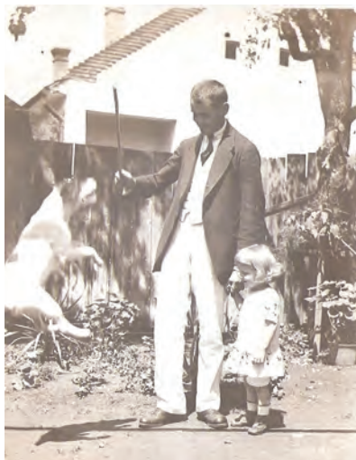
21. kép: Családi idill, 1916 Family idyll, 1916