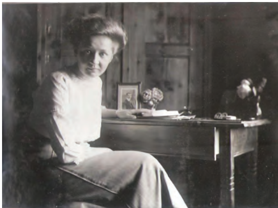
15. kép: Vira Abbáziában 1913-ban I. Vira in Abbazia (today: Opatija, Croatia), 1913 I.