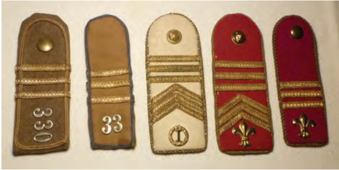
43. kép: Fodor Ferenc cserkész-váll-lapjai Ferenc Fodor's scouting epaulets