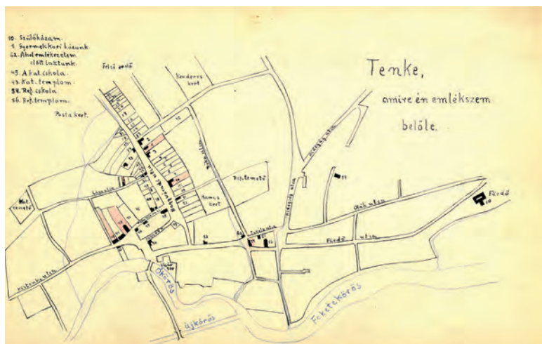
51. kép: Tenke térképe Map of Tenke