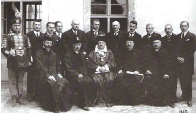
31. kép: A Közgazdaságtudományi Kar professzorai 1925-ben The professors of the Faculty of Economics, 1925