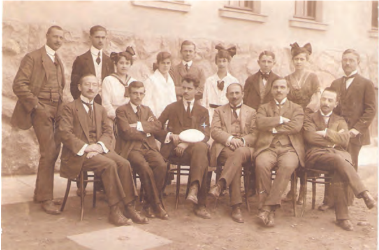
27. kép: A karánsebesi gimnázium VIII. osztálya és tanárai 1918-ban The Karánsebes (today: Caransebeș, Romania) gymnasium VIII. form class and teachers, 1918