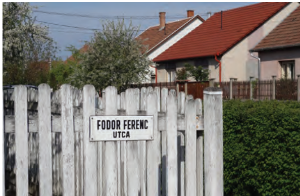
46. kép: A jászberényi Fodor Ferenc utca Ferenc Fodor St. in Jászberény