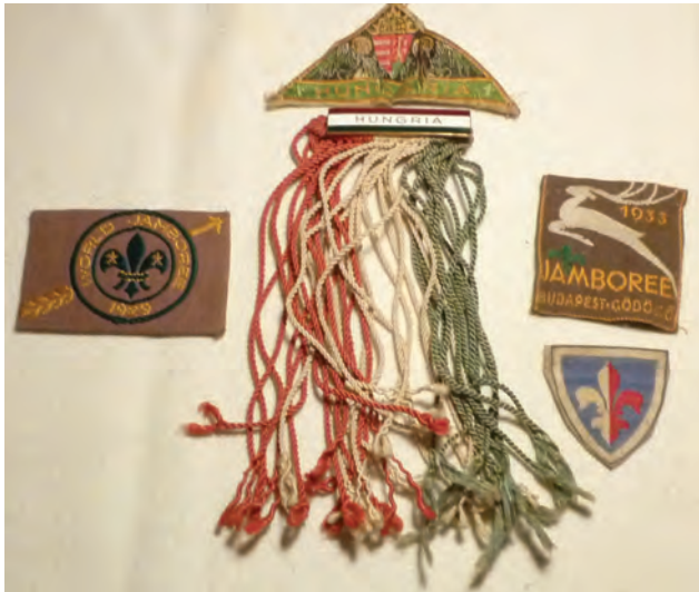
44. kép: Cserkészjamboree-émlékek: Dánia (1924), Anglia (1929), Gödöllő (1933) Memorabilia from scout jamborees: Denmark (1924), England (1929), and Gödöllő (1933)