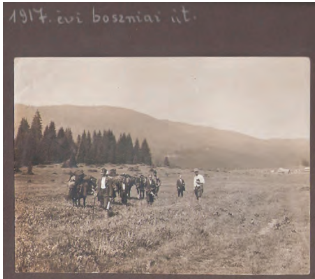
23. kép: A boszniai kutatóút 1917 nyarán Bosnian research expedition, summer 1917