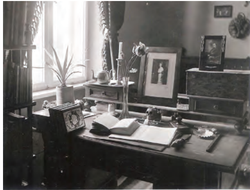
11. kép: A karánsebesi dolgozószoba 1912-ben Karánsebes study (today: Caransebeș, Romania), 1912