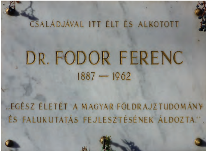
45. kép: Emléktábla az Ábel Jenő utcai ház falán Commemorative plaque on the wall of the Ábel Jenő St. House