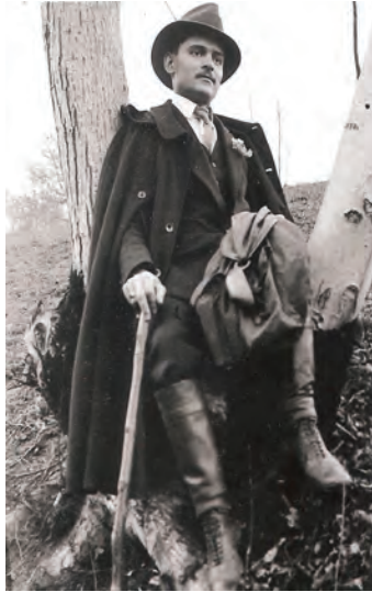
12. kép: Karánsebesi kiránduláson 1912-ben An outing in Karánsebes (today: Caransebeș, Romania) in 1912