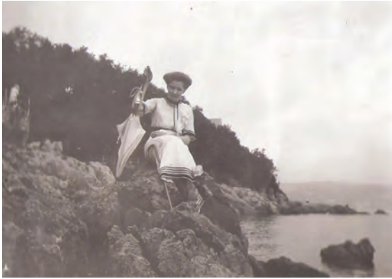
16. kép: Vira Abbáziában 1913-ban II Vira in Abbazia (today: Opatija, Croatia), 1913 II.