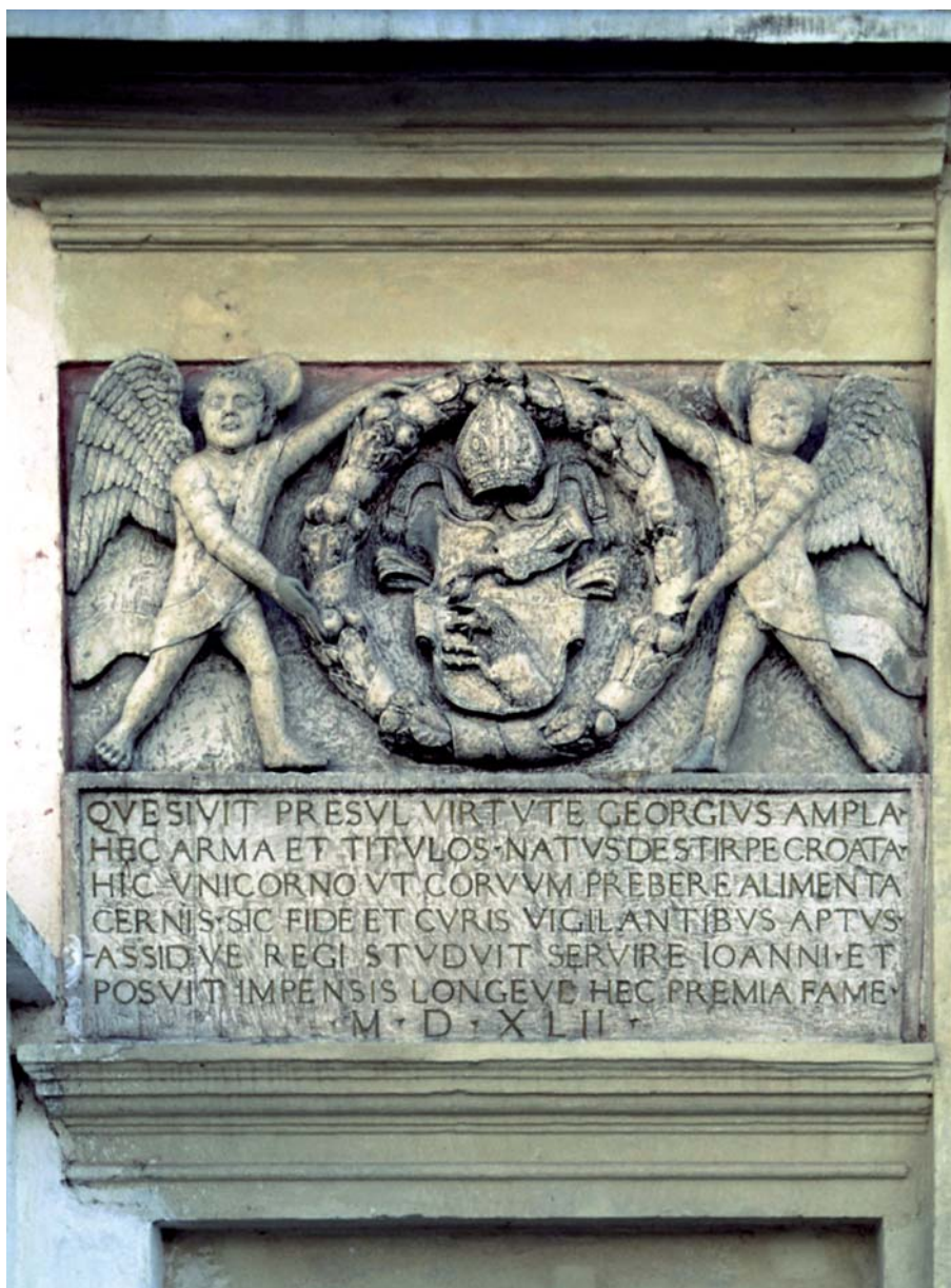
Szamosújvár, Martinuzzi György címere a külső várkapu fölött

Ezek a sorok egy tudományos munkára komolyan készülő egyetemi hallgató intellektuális élményeit és szakmai vallomását közvetítik késői visszaemlékezésben, aki ez első tudományos kutatói élmények