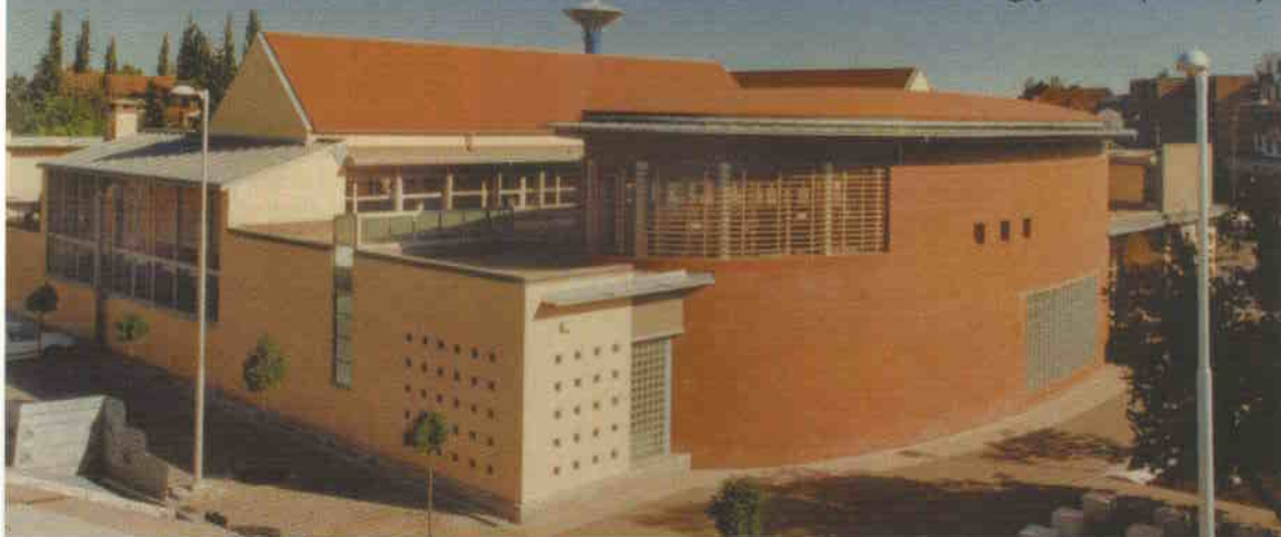
A félnyeregtes épületrész kissé elbizonytalanítja a kiemelkedő tömegek egyensúlyát

A gyulai posta ellipszis alaprajzú épülettömege homlokzati rajzához viszonyítva sokkal titokzatosabb – minden nézőpontból határozottan rövidül, amelytől arányai szépek és jelszerűek.