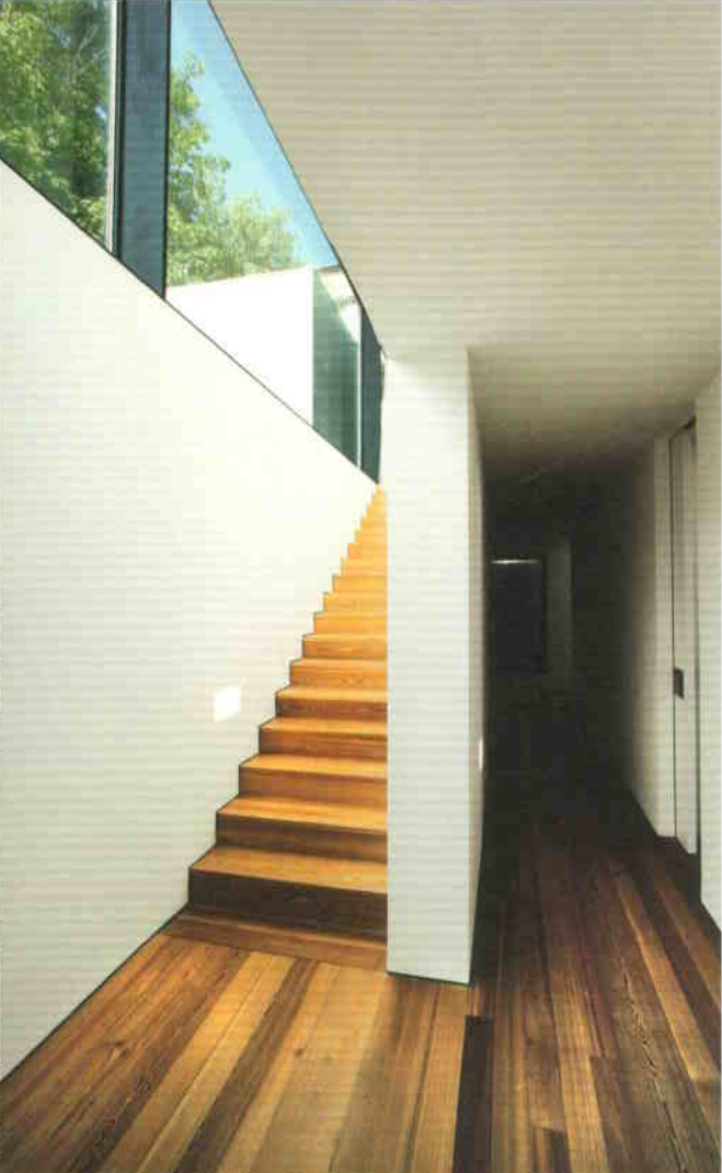
A fény felé vezető lépcső funkcionális folyosóval

jelentős részét elfoglalva szinte lehetetlenné teszik az épület használatát, de különleges vizuális hatásuk egyedi környezetet teremt. A ma bejárható egykori füstkamráról nem is beszélve. A régi épület térhatároló szerkezeteinek egységes kezelésével (grafitszürke öntött padló, feketére festett falak és mennyezet, acél rácsostartó tetőstruktúra porszórt felülettel) az ipari elemek még inkább hangsúlyba kerülnek. A régi épületrészben helyet kapó kávézó elegáns funkcióbővítése e térnek, csak egy pult és néhány asztal által.