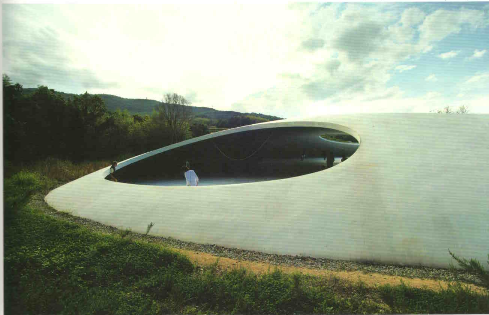
A természet erőit szabadon beengedő felnyitás