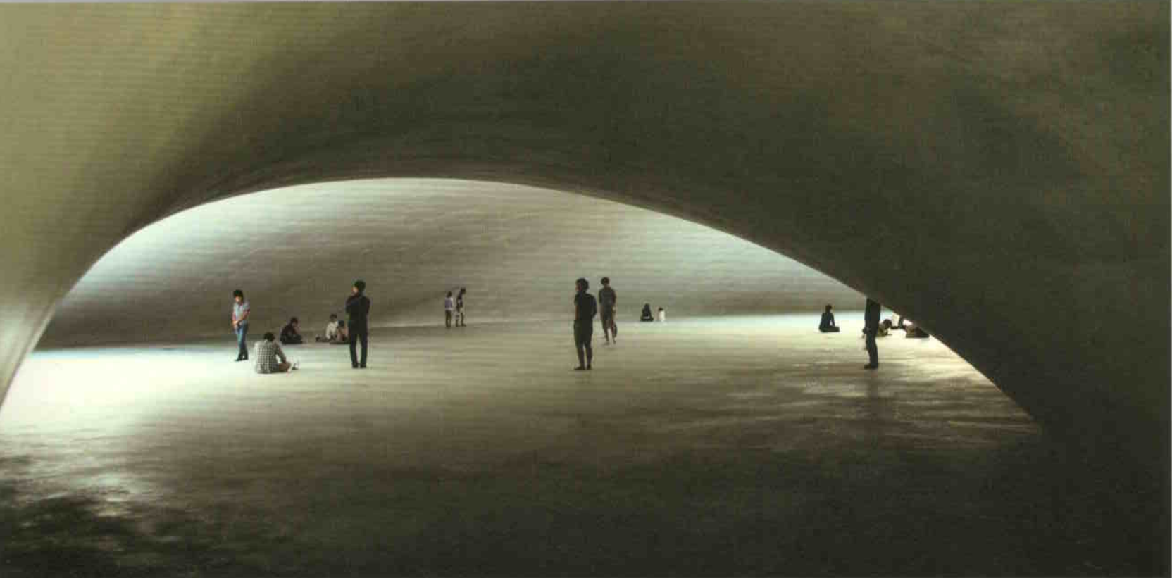
Véges, de befoghatatlan dimenziójú tér

kerülve jutunk majd a kiállítótér bejáratához, de az eléréséhez kötelezően bejárando, rövid út a környező tenger látványával telít meg. A lecsendesítés stratégiája hatásonosan működik, a falombok között felszakadó látványok tengeri mélykékje és a felhők staffázsszerű fehér-szürkéje vizuális tisztulás. Magaspontról ereszkedünk a kiállítótérhez.