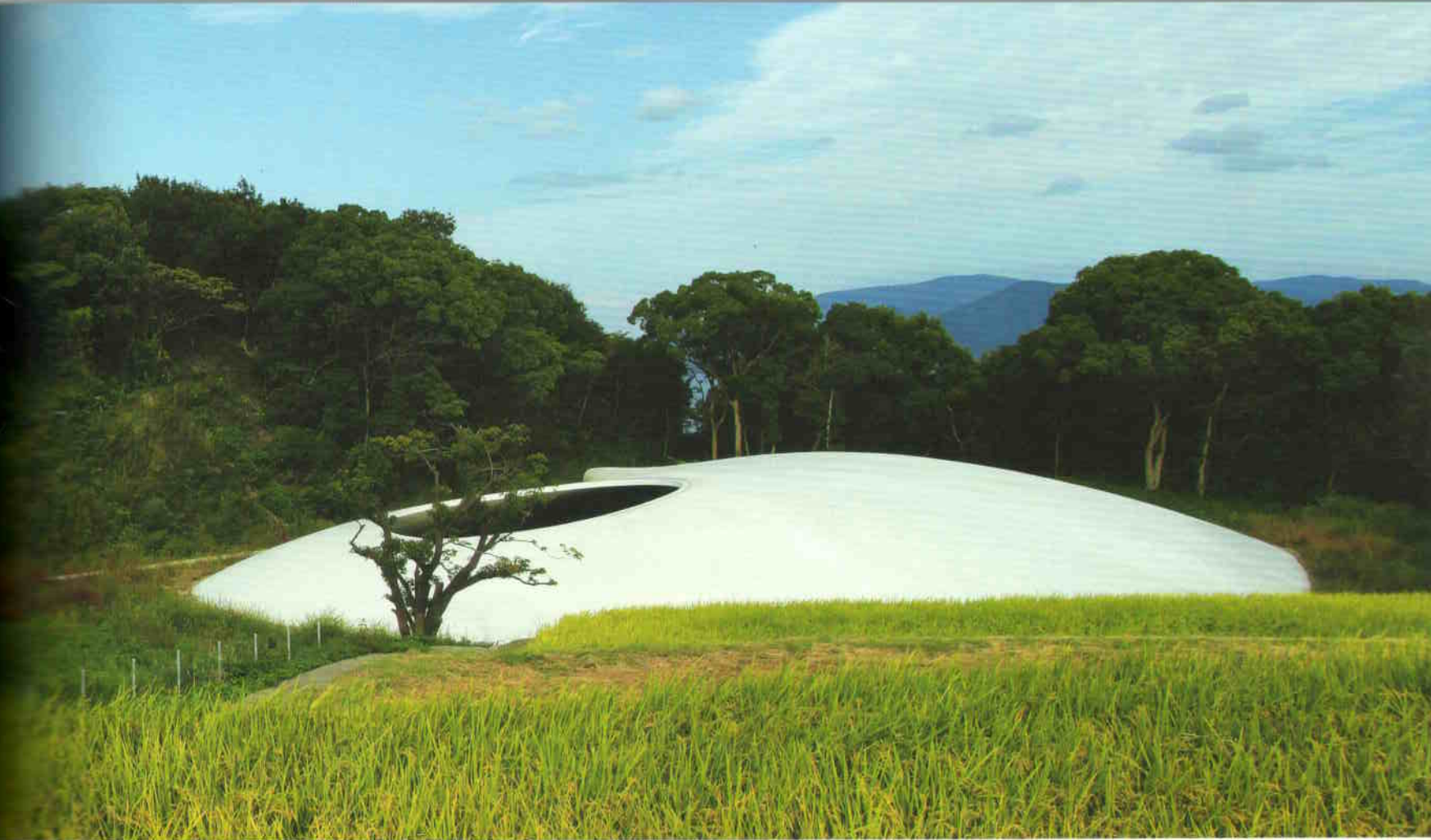
Vakítóan fehér tereptárgyak