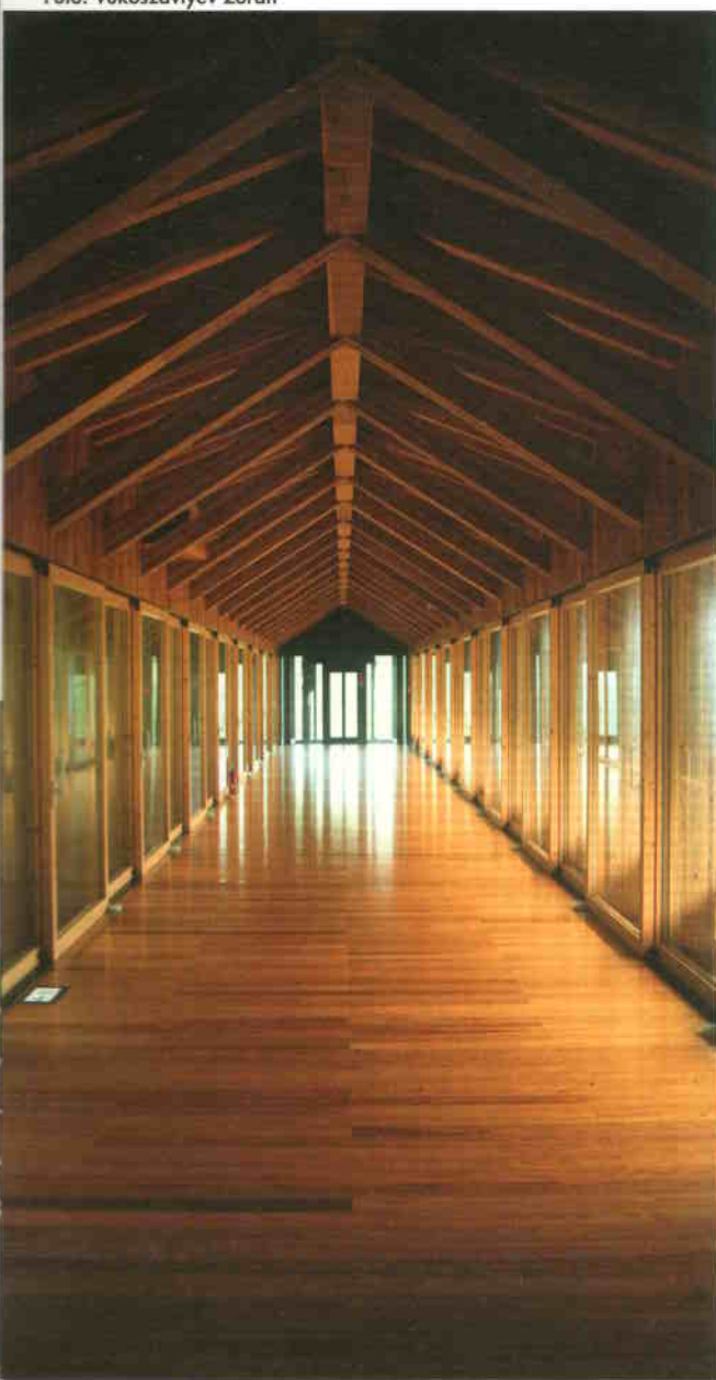
Galéria-híd üvegezett falakkal a fák lombkoronájának szintjén

A Shikoku szigeten található Kochi prefektúra magas hegyláncai közé befürdőző völgyek egyikében húzódik meg Yusuhara kis városa – a település városházát és termelői piacát Kengo Kuma tervezte, miként a kissé távolabb eső, erdőszéli hotelt is. A szálló és a helyszínen található sportközpont, valamint közfürdő zárt összekötését a varázslatos természeti környezetbe olvadó építészeti együttes elemeinek összekapcsolásával, nagy szintkülönbségek markáns felvállalásával oldotta meg. Folyosó helyett magasan vezetett galéria-hídot konstruált, a csatlakozó szárnyaknál közösségi teret formált – a közvetlen funkcionális átkötésnél többet, reprezentatív térsort hozott létre.