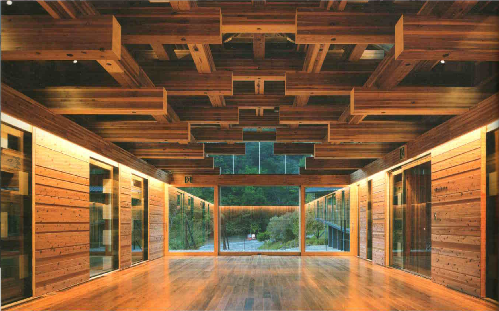
A közösségi terem tərbővítő mennyezeti-tetőszerkezeti struktúrája