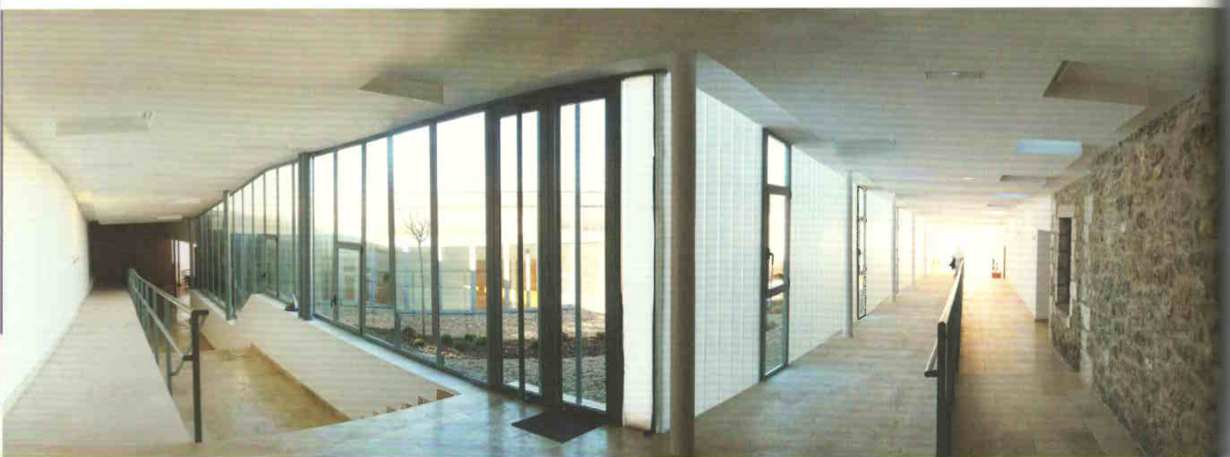
Átlátások: közlekedőből átriumon át

MINT AZ ÚJ ÉLET LEHETŐSÉGÉT HOZÓ, A SZÁRAZ TALAJT FRISS ÉRINTÉSÉVEL MEGTERMÉKENYÍTŐ NYÁRI ZÁPOR, ÚGY HELYEZKEDNEK EL AZ ELTÉRŐ MÉRETŰ ÉS MAGASSÁGŰ ÉPÜLETELEMEK A TÖRTÉNETI ÉPÜLETEGYÜTTES KÖRÜL.