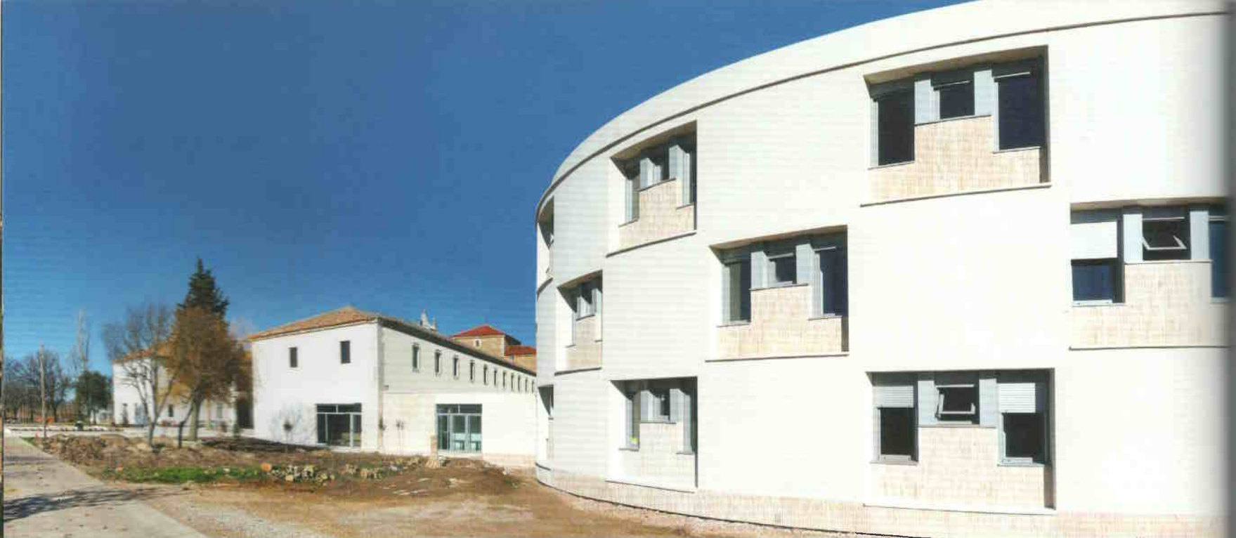
Új és régi – a szerzetesnővérek új szállóépülete az egykori dormitórium mellett

a száraz talajt friss érintésével megtermékenyítő nyári zápor, úgy helyezkednek el az eltérő méretű és magasságú épületelemek a történeti épületegyüttes körül. Így megmarad a kolostorudvar köré elhelyezett épületek kompakt zártsága, melyet az új épületek szabad téri kompozíciója a zárandokok érkezése felőli oldalon érzékenyen továbbszó. Az enyhe lejtésű domboldalból adódóan így a templom kimagasodik, és az alatta elterülő érkezési felület a zárandokok fogadására alkalmas köztérburkolattal vezet tovább az új épülettömegek adta kompozíciót. Az íves vonalvezetésű támfalak lépcsők által tagolt több térszínre tagolják az érkezést, újabb és újabb feltárlását adva az épületegyüttesnek. A monostorkerület bejárat kapujánál a kerítésfalba rejtetten található a mosdók, és közvetlenül a bejáratnál a hosszabb lelkigyakorlatra érkezők szállásépülete.