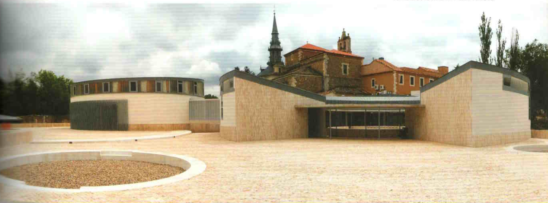
A zarándokok érkezése felőli feltárulás

A Reset Arquitectura építészei szoros együttműködésben a Land Lab tájtervezőivel a környezet nagy távlatában fogalmazták meg elképzelésük kompozíciós alapvetését. A meglévő monostor kiegészítésében az új épületek különböző méretű kör alaprajzú épületobjektumokként kerültek a tájképi környezetbe. Mint az új élet lehetőségét hozó,