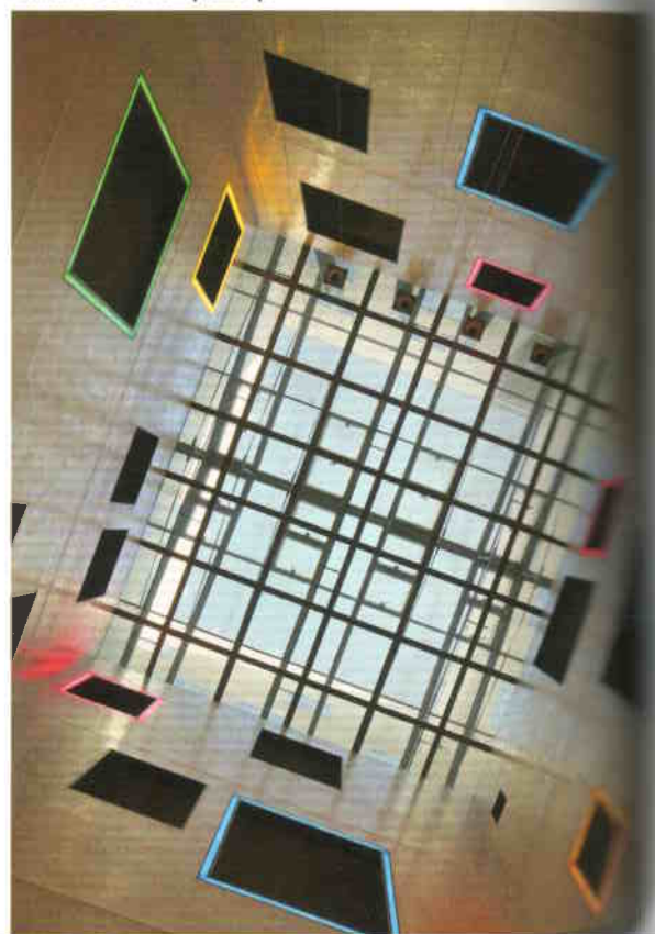
Design szemlélettel komponált nyílások, LED-fényekkel kiemelt keretek kompozíciója