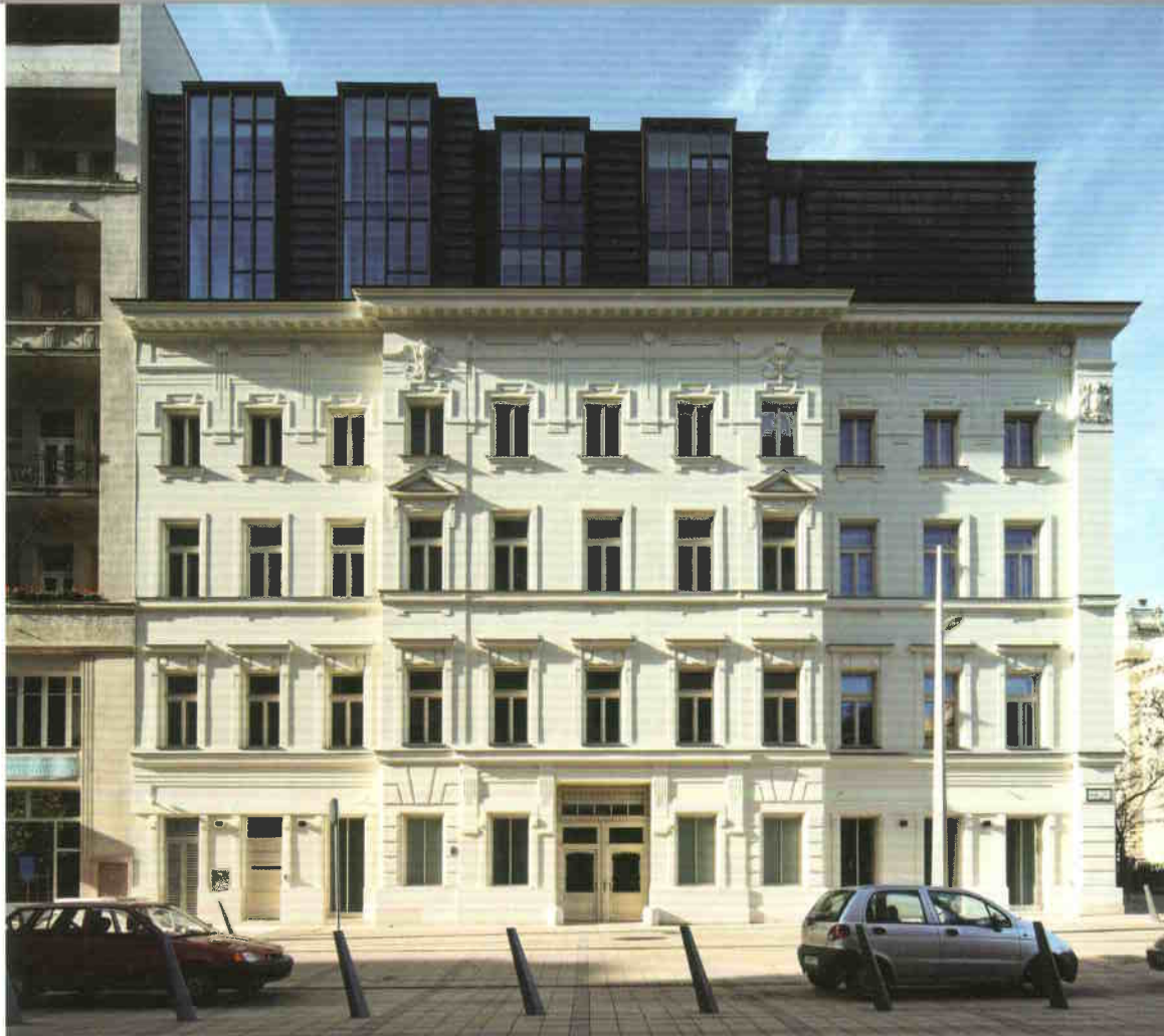
Korrekt arányok bővítésben, nemes egyszerűség az anyagválasztásban

Éppen ezért nagy öröm, amikor ennek a karakternek megértésével és ezt elfogadó továbbgondolásával találkozhatunk. Az egykori városfalakkal övezett Pest-Belváros kiterjesztéseként tekinthető Lipótváros szívében található Szabadság tér egyik déli sarkán, az Október 6. utca csatlakozásánál eddig is sok minden történt, de most valami a helyére került. A „Downtown” északi irányban történő kiterjesztése a „logikus” sétálóutca arculattal megteremtette ezen terület fejlődését is: egykoron bérháznak épült házak válnak igényes középületekké.