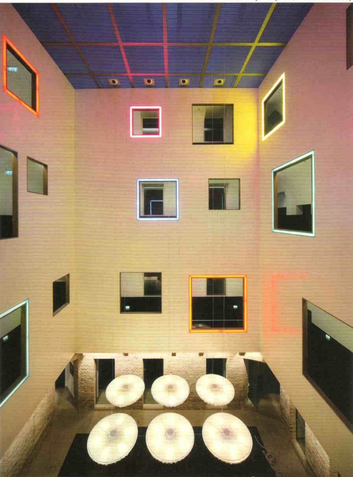
Az emeleti körfolyosók új, rátett, homlokzati struktúrája