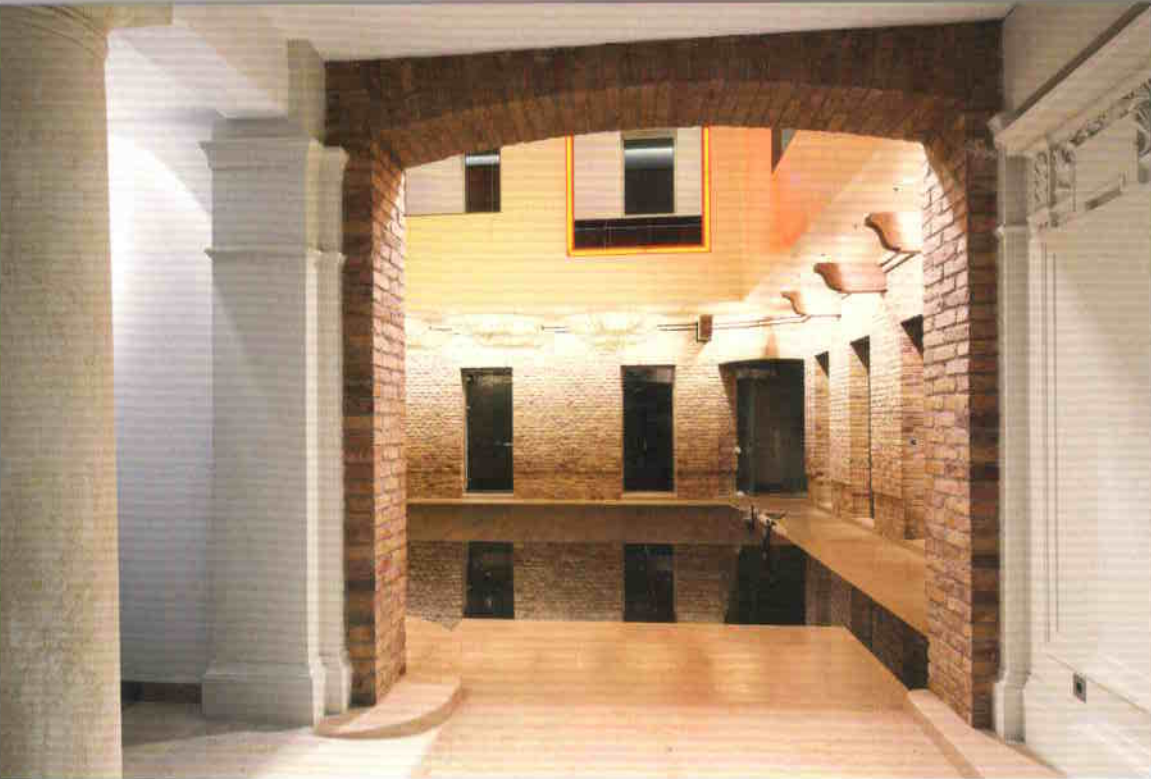
A központi tér feltarulása a bejáratról