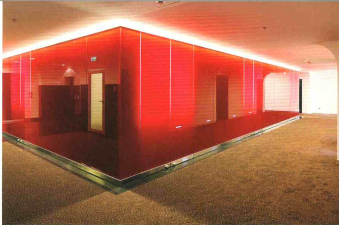
Folyosó a felső szinten

közösségi terekben a fehér fal és (mesterséges, valamint természetes) fény kettőségére vált. Dinamikus színek koncentrált helyeken, fekete-szürke alaptónus a hidegburkolatoknál, szoborszerű fehér keramiák a fürdőkben. Ezt a végletes átgondoltságot tovább írja az ívesen meghajtott folyosómennyezet a felső szinteken, s a Reimholz Júlia által tervezett, lírikusan nőies, savmaratolt üveg térelválasztók – és egy kicsit már túlírja az egykori történelmi épületbelsőit visszacsempésző, újraépíteti földszinti nyerstégla fal. A történelmi szintek szabaméretei nagyvonalúak, a profi részletképzésekkel (homlokzati nyílászárók) a helyükön vannak. A megfélemlés logikusan szétválasztott, és a belsón sem keressük és várjuk már a történelmi magyarázkodást. Lehetett volna persze másképpen is, de a ház tudja helyét: az épülettömb léptékét számon tartva a ráépítés lépcsőzötten visszahúzódó és még véletlenül sem vágnak össze függőleges vonalak. Reimholz Péter „utolsó épülete” – köszönhetően fiatal munkatársainak is, Nagy Péternek és Németh Tamásnak – fiatalos lendülettel helytáll. Új és régi (ahogy így hosszú szán nézegetem) jól megvan, mégiscsak.