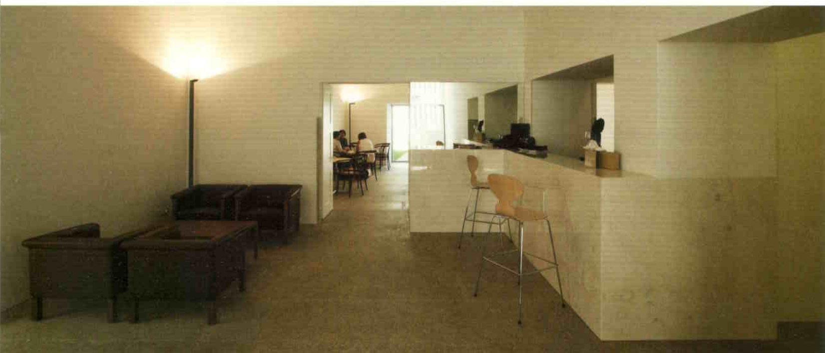
Minimalistán átformált vendégtér a történelmi épület földszintjén