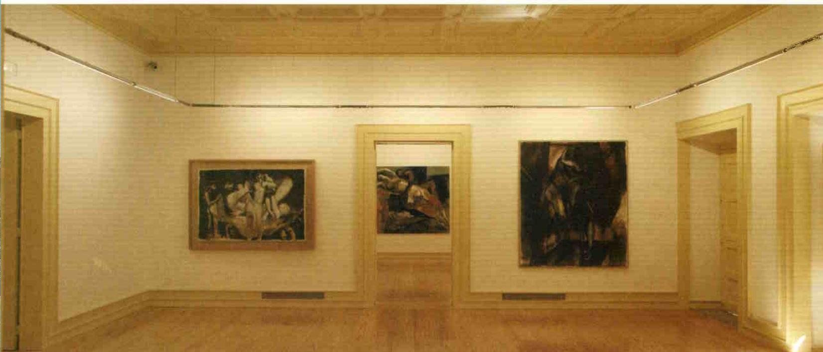
Helyreállított belső terek Graça Morais képeivel