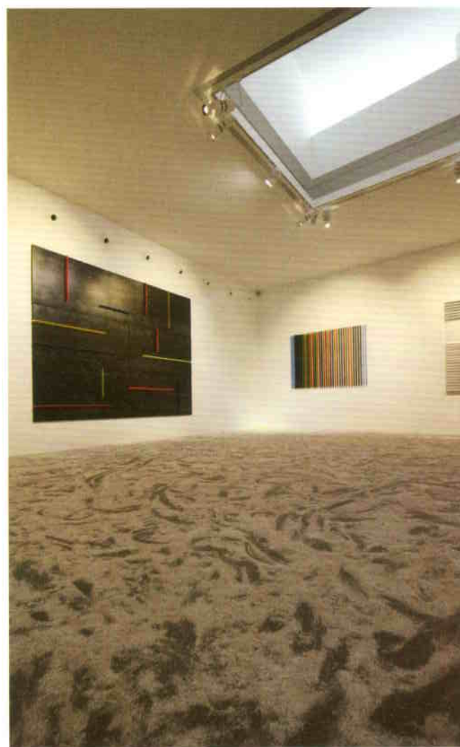
A kortárs galéria belső tere