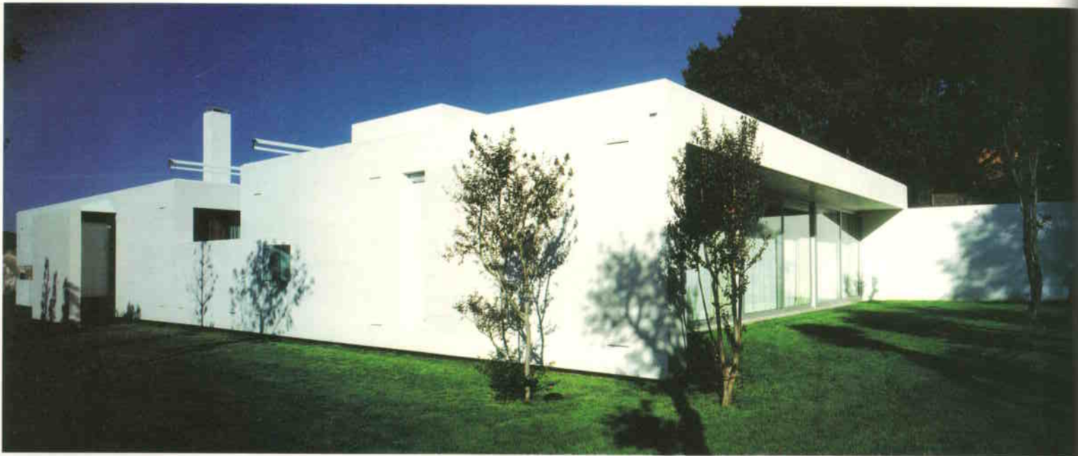
Tiszta tömegek, fehér vakolt felületek, mély árnyékok: a spanyol neomodern