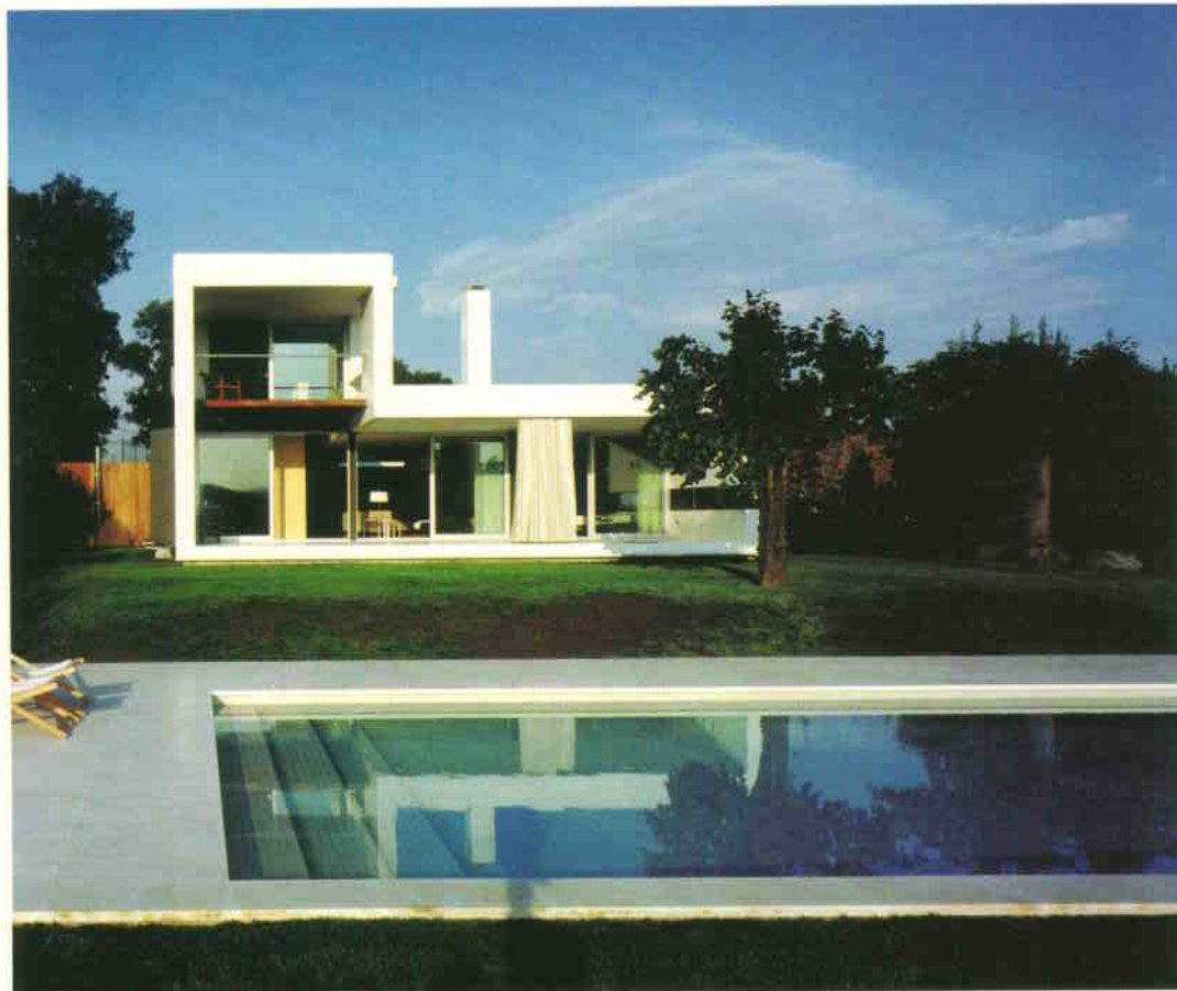
A medence kékje, a kert zöldje és a ház fehérje a mediterrán ég alatt

dulnak. Csakhogy a modernizmus szűkszavú, reduktív (félre)értelmezése miatt az '50-70-es években a „város” eltávolodott a hagyományos „rurális” kapcsolódási pontoktól, az ipusztériális fejlődés elszakította az embereket a kézműves tradícióktól. Az eltávolodást észlelő, s az eilene tudatos harcot vivő folyamat a '80-as évek derekán indult el, amikor a regionalizmus szellemében megépültek a helyi értékek visszaemelését szorgalmazó építészek alkotásai Spanyolországban. Ez az egész Európára jellemző folyamat túllépett a szűk kereteken, s mára egy erős, helyi hagyományból táplálkozó, sajátos építészeti kör alakult ki.