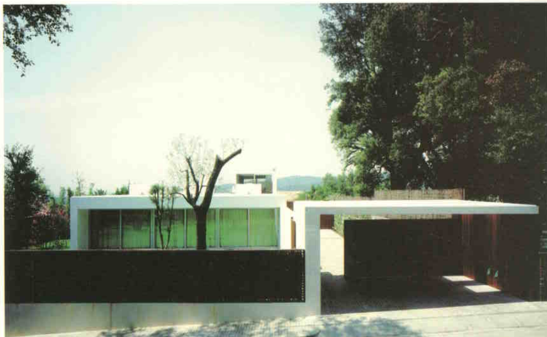
Csupán a megfelelő éghajlat miatt lehetséges lapostetős megoldás: a csapadékszegény, spanyol klímán szegély nélkül alkalmazható ez a szerkezeti elem

A XX. század elején a modernitás jelentős fordulatot hozott a spanyol építészetben is. Mies van der Rohe barcelonai kiállítási pavilonja jelzi azt az alappontot, ahonnan a kortárs építészetet meghatározó szándékok in-