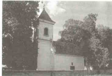
3. kép: Illocska, Szent Paraskeva-templom

Természetes, hogy a szerb egyházközösségeknek nem voltak saját építőcsoportjaik. Valószínűleg olyan mesterembereket bíztak meg, akik már jártasak voltak a templomépítésben, még ha nem is láttak szerbiai templomokat. Majs példája jól mutatja e ötvöződést. Az 1780 körül épült templomhajóhoz később épült a barokk torony – az övpárkányok nem is találkoznak. Valószínűleg katolikus műveltségű mesteremberek építhették, mert az előképeiknek megfelelően szoborfülkéket helyeztek el az alsó szinten. Mivel a bizánci rítusú templomokban nem szabad szobrot állítani, használati e tényt úgy hidalták át, hogy a templom védőszentjének képét festették bele.