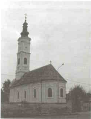
4. kép: Mohács, Pünkösöd ünnepének szentelt templom

Szép példája a nemzetek-nemzetiségek egymás mellett élésének Siklós temploma (6. kép). Az 1806-ban épült templom belső berendezését a 19. század közepén készítették neoklasszicista stílusban. A templomban szöszék található. A bizánci templomokban nem, a szerbek által építettekben pedig még annyira sem szokás szöszéket állítani – a prédikáláshoz és igehirdetéshez egy kisebb emelvény szolgál a templomtérben. Itt valószínűleg a nagyszámú, a városban már régebb óta élő görög kereskedőcsaládok igényének megjelenítéséről van szó.