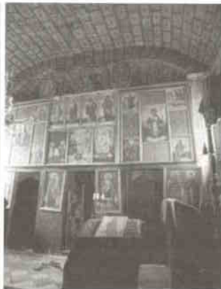
5. kép: Illocska, belső