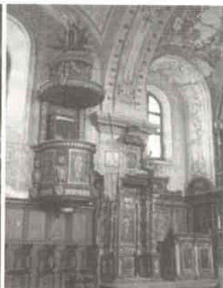
6. kép: Siklós, belső

A keleti ember számára a templom nemcsak a szakrális teret jelenti, hanem benne jelentkezik egész élete is. A bizánci liturgia és a nemzeti hagyományvilág az évszázadok folyamán elválaszthatatlan egységgé alakult. A templomter tanító ikonjai, a gyertyafény, a hosszan elnyújtott liturgikus cselekmények mind a magánáhitatot szolgálják, amelyből a hívő az érzelmi megtisztuláson túl identitástudatának értelmét is meríti.