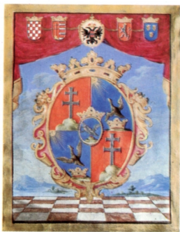
8. Az 1697-es grófi címer az eredeti oklevélen