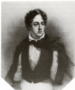
15. Az eszménykép: Byron