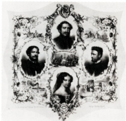
24. A Széchenyi család egy 1863-as litográfián Kat. 68. sz.

egyik célja a magyarok őshazájának felkutatása volt. E nagy, hároméves útjára 1877. december 4-én indult el Lóczy Lajos geológus, Bálint Gábor nyelvész és Kreitner Gusztáv főhadnagy, topográfus társaságában. Útjuk során nagy mennyiségű megfigyelést tettek, s annak feldolgozásába később még vagy 20 hazai és külföldi tudós kapcsolódott be. Annak főbb eredményeit 1890 és 97 között a Lóczyval együtt megírt háromkötetes monográfiájában foglalta össze.