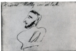
19. Széchenyi karikatúra. Sajat kezű rajza felesége számára. Felirata: „Kedves Mutty imádlak!”. L. Rózsa kat. 19. sz.