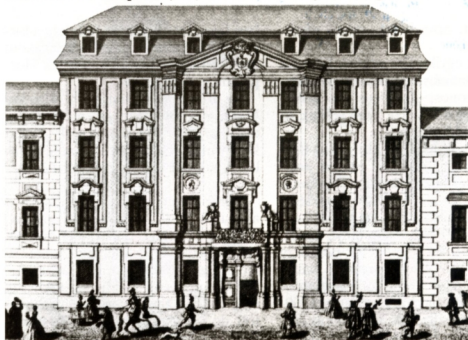
5. A bécsi Wilczek palota; itt született Széchenyi István gróf