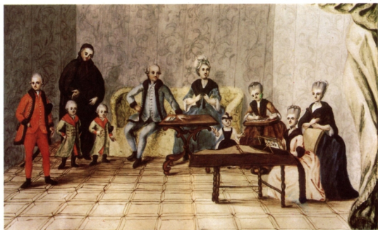
4. Széchenyi Ferenc gróf családja körében (1795). Balján: Festetich Julianna; jobbján fiúgyermekei: István, Pál és Lajos, felesége balján a lányok: Zsófia és Franciska; a háttérben a káplán és a nevelőnő