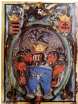
7. Az 1629-es nemesi címer