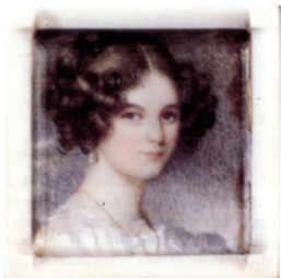
17. Széchenyi István 1836-ban vette el feleségül Seilern Crescentia grófnőt, házasságából három gyermeke született, akik közül a két fiú, Béla és Ödön érte meg a felnőttkort

Széchenyi Istvánnak két fia és egy leánya született, az utóbbi kéthetes korában szívélégtelenségben meghalt. Előfi, Béla 1837-ben született, felsőbb tanulmányait Berlinben és Bonnban