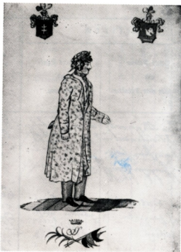
12. Széchenyi István házikábatban egy 1810 körül készült vízfestményen (a rajzon felül a grófi címer részletei) Kat. 4. sz.

1802 márciusában felségfolyamodványban kérte az uralkodót, járuljon hozzá, hogy nagy magángyűjteményét Magyarországának adományozhassa, azt a továbbiakban is gyarapíthassa s arról katalógus-pótköteteket adhasson ki. (Gyűjteménye alapkatalógusai 1799–1800-ban már megjelentek.) Ferenc német-római császár és magyar király