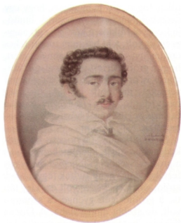
14. Egy Ender-festmény alapján a 19. század második felében készült vízfestmény, amely a 21 éves Széchenyiit ábrázolja Kat. 6/a. sz.