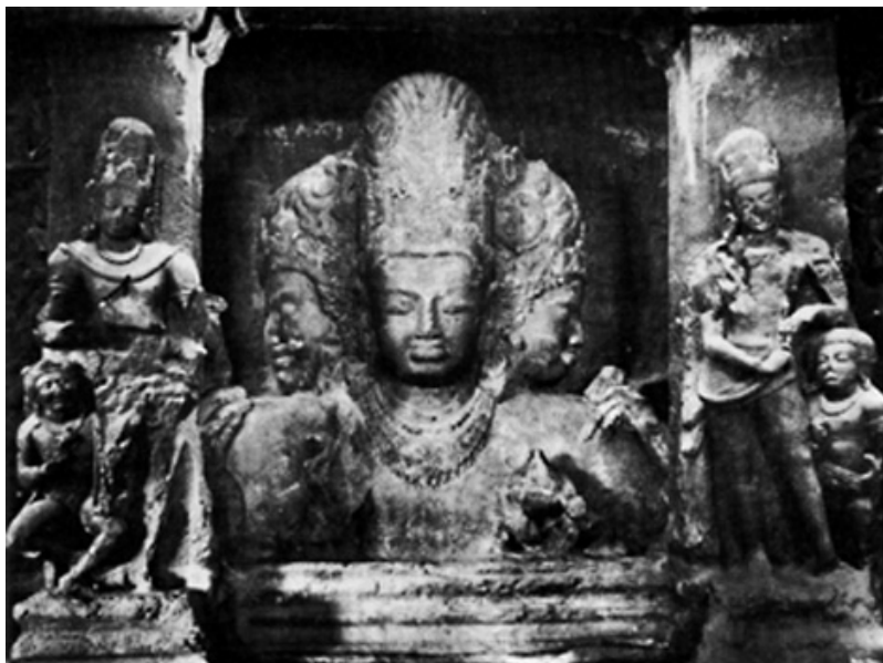
3. kép • Trimurti, Síva