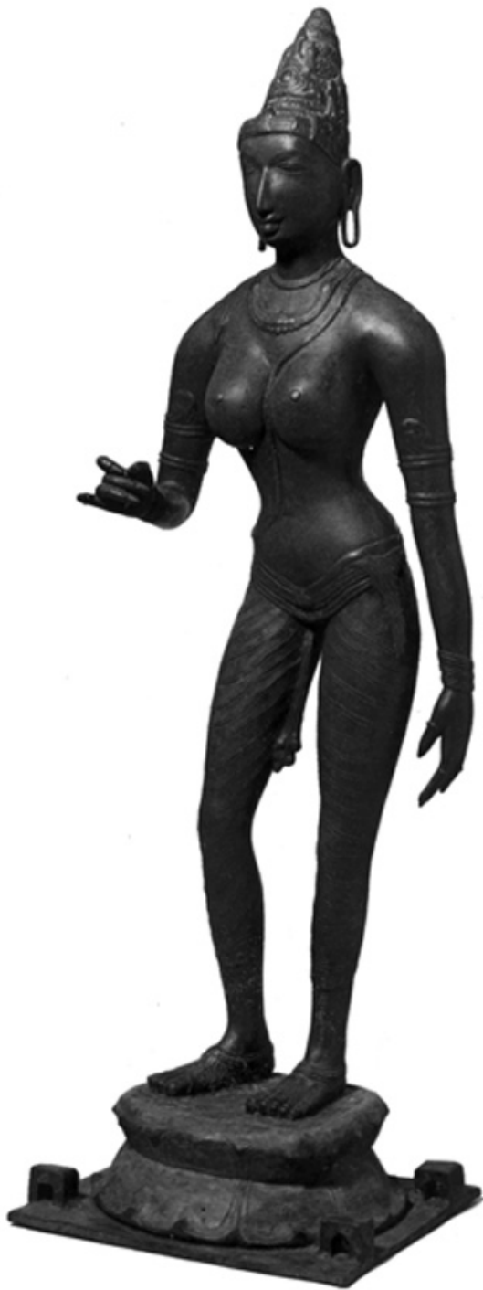
2. kép • Parvati királynő, Síva felesége. A világ egyik legszebb női szobra, Csóla-kori bronz.