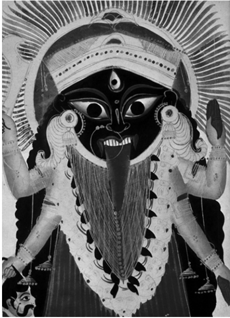
5. kép • Káli, a fekete földanya koponyafüzért visel, jobb kezében egy levágott, vérző fejet tart.

újjászületés ciklusát is jelképezi. Kezében két koponyatetőből készített csörgődob. Bronz, x. sz., Madrasz.