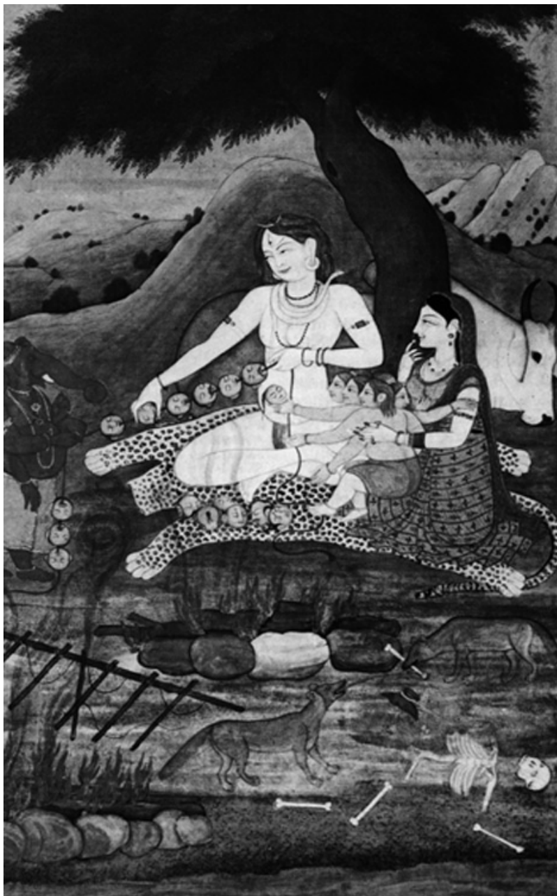
6. kép • Síva és családja. A

képen látható, hogy Síva a szépsége ellenére gonosz, s mint Bhutasvara, a temetők és tetemégetők feldúlója, koponyafüzért készít. Felesége, Párvatí a halotti máglya mellett ül; ölében egyik gyermeke, Karttikéja. Ez a gyermek oly szép volt, hogy hat anya akarta szoptatni, Karttikéja ezért hat fejet növesztett magának. Másik gyermekük az elefántfejű Ganésa. Mindnyájan a koponyák felfűzésében segítenek.