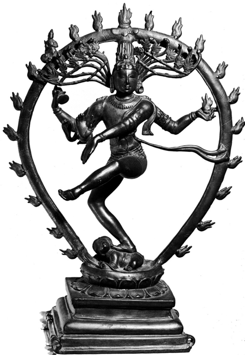
4. kép • Síva egy törpe démon

testén táncol. Az őt övező fénykoszorú a dicsőségét hirdeti, de egyben a pusztítás és