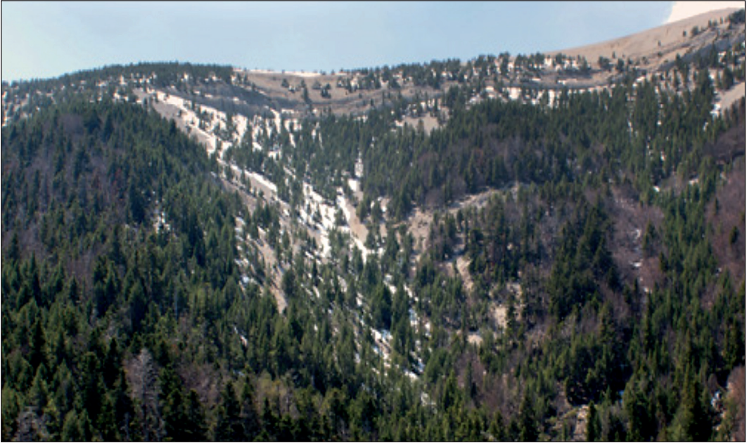
1. ábra: A Francia Alpokban, elterjedési területe déli határán, a jegegyfenyő széles körű pusztulást mutat (elszürkült fák) a 2003. évi szélsőséges aszályok következményeként (fotó: B. Fady, INRA)

Figure 1: In the French Alps, at its southern range limit, European silver fir ( Abies alba L.) shows widespread mortality (grey trees) after the extreme drought of 2003 (photo courtesy B. Fady, INRA)