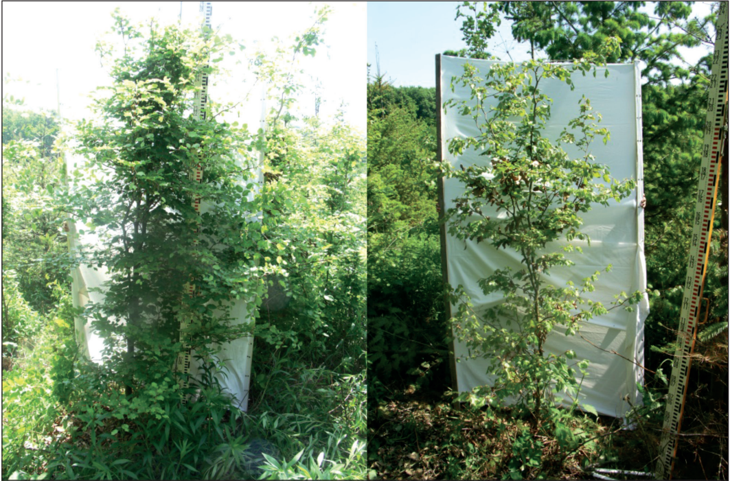
5. ábra: 10 éves bükk származások növekedése és habitusa egy kontinentális helyszínen (Bucsuta, Zala m.). Balról Magyarereggy (Mecsek, \Delta EQ : 2.57), átlagmagassága 3,13 m; jobbról az atlanti Soignes (Belgium \Delta EQ : 7.97), átlagmagassága 2,62 m. A \Delta EQ aszályindex változás a klimatikus stressz mértékét jelzi

Figure 5: Difference in growth and branching of two provenances of 10 year old beeches in a continental environment (test site Bucsuta, Hungary). Left: provenance Magyarereggy (Hungary, \Delta EQ : 2.57), aver. height 3.13 m; right: Atlantic provenance Soignes (Belgium, \Delta EQ : 7.97), aver. height 2.62 m. The change of drought index value ( \Delta EQ ) indicates the intensity of climatic stress