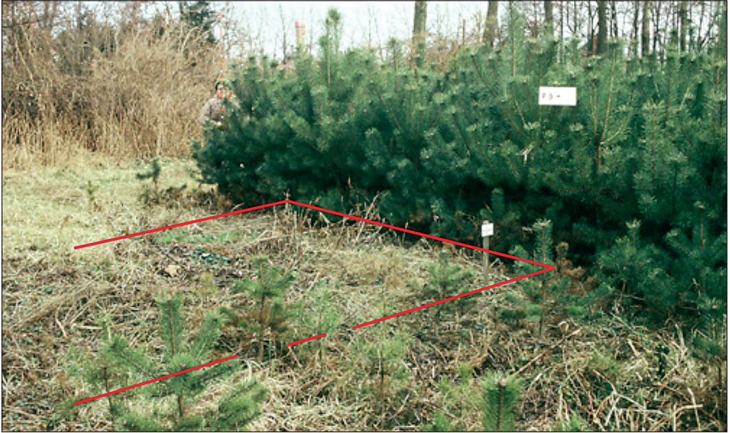
2. ábra: Példa a klimatikus alkalmazkodás által kiváltott növekedési és megmaradási különbségekre egy erdeifenyő kísérletben, a Kámoni Arborétumban. A melegebb klímában a kelet-szibériai (Ajan-i) származás teljes egészében kipusztult (kijelölt parcella); a török hegyvidéki populáció (Catacik, az előtérben) gyenge alkalmazkodottságot, míg a legjobb magyar származás (Pornóapáti, a háttérben) erőteljes növekedést mutat

Figure 2: Growth and survival of trees depends on how their climate adaptation matches actual conditions. At the mild-continental Scots pine test site in Hungary, no trees from East Siberia survived (marked plot), the Turkish trees were maladapted (foreground), whereas the local, Hungarian provenance trees thrived well (back right)