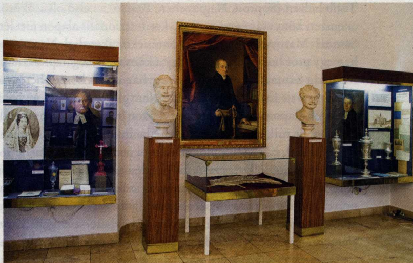
Az Evangélikus Országos Múzeum régi állandó kiállítása.

Fontos tehát, hogy ha alkalom adódik, mint az egyes nagyobb felújítások, akkor ne csak a templomok építésének és a liturgiai igényeket vegye tekintetbe az Egyház mint intézmény, hanem a közgyűjtemények elhelyezésének