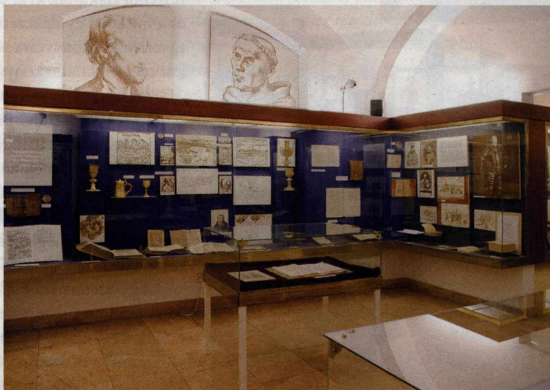
Az Evangélikus Országos Múzeum régi állandó kiállítása.

A Békéscsabai Evangélikus Gimnázium 1865-ben kicsiny, 250 kötetes könyvtárral bírt. Az első nagyobb ado-