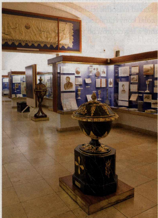
Az Evangélikus Országos Múzeum régi állandó kiállítása.

Külön múzeumi gyűjtemény kialakítását 1972-ben határozta el az evangélikus egyház. Hosszú, szakszerű előkészítő munka után 1979-ben nyitotta meg kapuit (lásd FABINY 1980; 1986). Felújítása és egy új, modern küldetésű kiállítás megrendezése a reformációi emlékévé előestéjére fejeződött be.