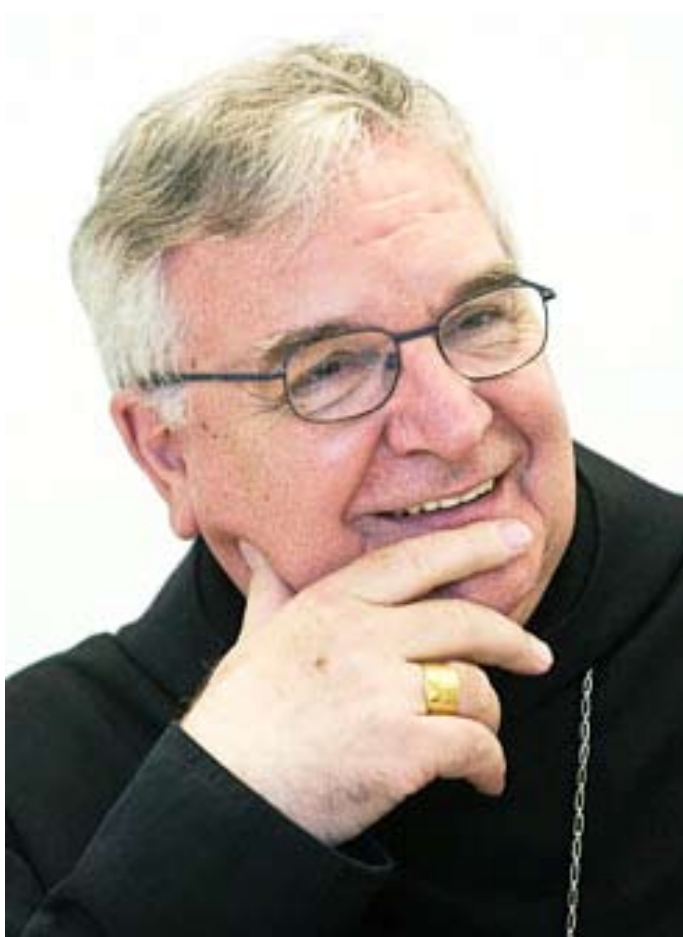
+ Vätskegi Antoi