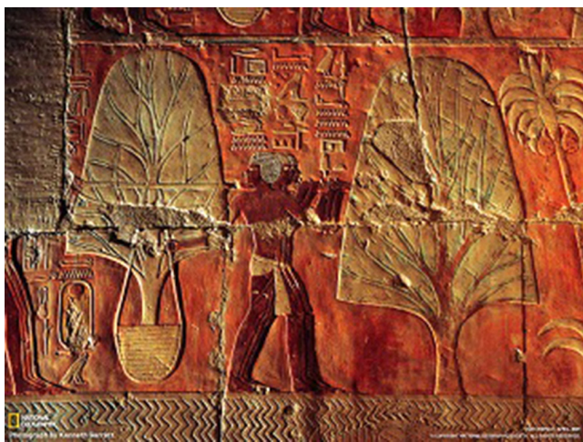
3. ábra | Facsetete-szállítást ábrázoló dombormű Hatsepszut templomának a falán, Deir el-Bahariban

A Ceratonia siliqua L. (Fabaceae), a szentjánoskenyér, csak a fenti (Eb480) májpanaszok kezelésére szánt óegyiptomi orvosi receptben szerepel. In vitro bizonyítékok támasztják alá citosztatikus tulajdonságát. A levelek polifenolokban és flavonoidokban gazdagok, alkoholos kivonatuknak a DPPH- (1,1-difenil-2-pikrilhidrazil-) gyök megkötésének mérésén alapuló antioxidáns-kapacitás vizsgálata arra enged következtetni, hogy jelentős an-