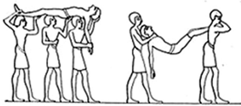
1. ábra | Bortól megrészegült emberek hazaszállítása az ünnepről (Food: Gift of Osiris, Beni Hassan Redrawn from Wilkinson, 1878. Vol.1, Fig. 160)

ket. Egy másik mítoszban a Núbiából hazatérő istennő tiszteletére nagy ünnepeket rendeztek, ahol az öröm, ünneplés részeként sokan lerészegedtek. Az istennőnek számos ünnepe volt, ezek között szerepel a „részegség ünnepe”, amikor ezekről az eseményekről emlékeztek meg. Ilyenkor az ünneplők kellő mennyiségű bor fogyasztásával kívánták az isteni állapotot átélni, így kerülni az istennő közelébe.) Ezért gyakoriak lehettek a májbetegség különböző stádiumai [6].