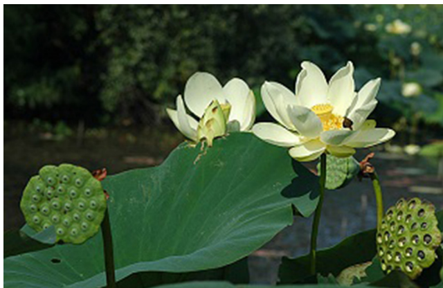
4. ábra | Lótuszvirág képe termésével

jellemző hatások kiváltásáért. Többek között fájdalomcsillapító, euforizáló, emetikus és obstipans hatású. Figyelemre méltó, hogy az ókori egyiptomiak mellett a maja kultúra is felismerte a növényi kivonat hallucinogén és emetikus hatását, amely a gyógyító, illetve „tisztító” rituálék igen fontos részét képezte [46] (4. ábra). Az okker ásványi festékanyagot, főként adsztringens és antiszeptikus tulajdonságai miatt, külsőleg bőrfertőzések kezelésére használták [47]. A receptekben említett tej főleg vivőanyagként szerepelhetett. Azon kívül, hogy fontos tápanyagokat és ásványi anyagokat tartalmaz, immunmoduláns és szabadgyök-fogó hatással is rendelkezik [4].