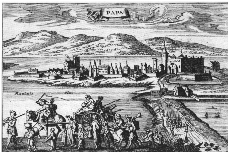
3. kép. Pápa a 17. század végén

régi városképet helyreállítani az újjáépítésnél és miképp lehet a még meglévő épületeket és utcákat felhasználni”. Felmerült a kérdés, hogy „az építési hagyomány szempontjából milyen formában kell a történeti épületeket az útvonalak helyreállításához igazítani”. Eldöntendő feladatnak tartották, hogy melyek legyenek a lakóterületek „fellazításának” határai. A metodika talán legdrámaibb fejezete pedig nem kisebb jelentőségű döntést fontolgatott, mint hogy „a nagymértékben elpusztult városokat ... ugyanazon a helyen kell-e felépíteni?” A korra jellemző módon a tézisek arra is feleletet kívántak keresni, hogy „mi az eszményi megoldás a lakótelepek létesítése terén?” Az épített történeti örökséggel kapcsolatos bizonytalanság tehát már a háború végén érezhető volt.