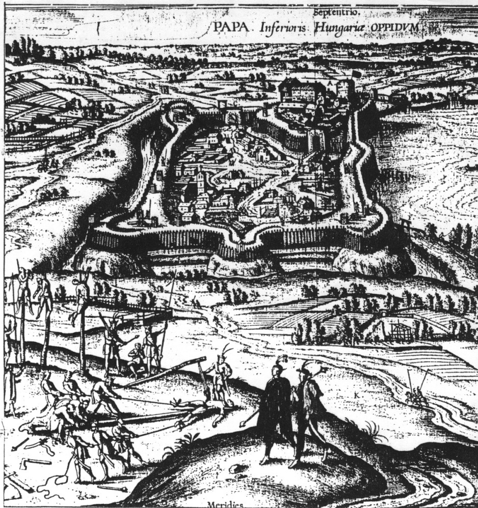
1. kép. Pápa 1600-ban (Hoefnagel György közli 1610-ben)

kezés kötelező.” A részletes rendezési tervben „... a beépített, illetőleg beépítésre kijelölt területekre vonatkozólag meg kell határozni ... az épületek építési vonalát, építési magasságát ... a telkek beépítési módját ... és a városrendezés szempontjából jelentős egyéb lényeges körülményeket.” 6