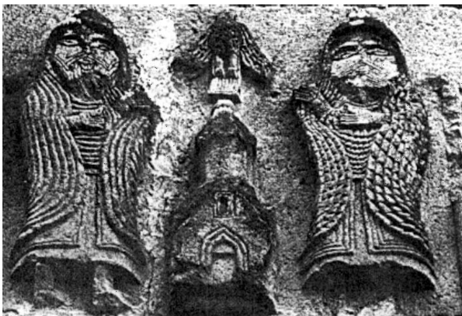
5. ábra. Haghardzin, kolostoregyüttes, templommodell a homlokzaton

– A szakirodalomban az eredetileg a templommodellt tartó alakot Gaghik királlyal azonosítják. Ebben az esetben a dombormű másik (elpusztult) oldalán Krisztusnak kellett állnia. A föltételezett kompozíciót összehasonlítva az aghtamari domborművel több ellentmondás is tapasztalható. Ott a király bal oldalon áll teljes díszruhában. Az itteni kompozícióban a megmaradt alak egyértelműen a jobb oldalon áll, s ruházata alapján semmi nem emlékeztet az uralkodóra. Turbánja, széles gallérja és köpenye inkább egy építési vállalkozóra utal. Analógiaként a haghbati dombormű említhető, ahol jobb oldalon a turbános építőmester, a másik oldalon a donátor főpap áll. Ezt figyelembe véve a Gaghik-templom domborművének elpusztult másik felén állhatott Gaghik király, s ketten (király és építőmester) ajánlották föl a templomot Krisztusnak. Ebben az esetben viszont egy fölbecsülhetetlen értékű leletről beszélhetünk: egy XI. századi építőmester, Trdat mester autportréját láthattuk a dombormű megmaradt (azóta elpusztult) alakjában. Ez a nagyszabású alkotásokat létrehozó mester (Argina, katedrális, Ani, katedrális, Konstantinápoly, Hagia Szophia kupola újjáépítése, Ani, Gaghik-templom) megérdemelné, hogy portréját is ismerjük.