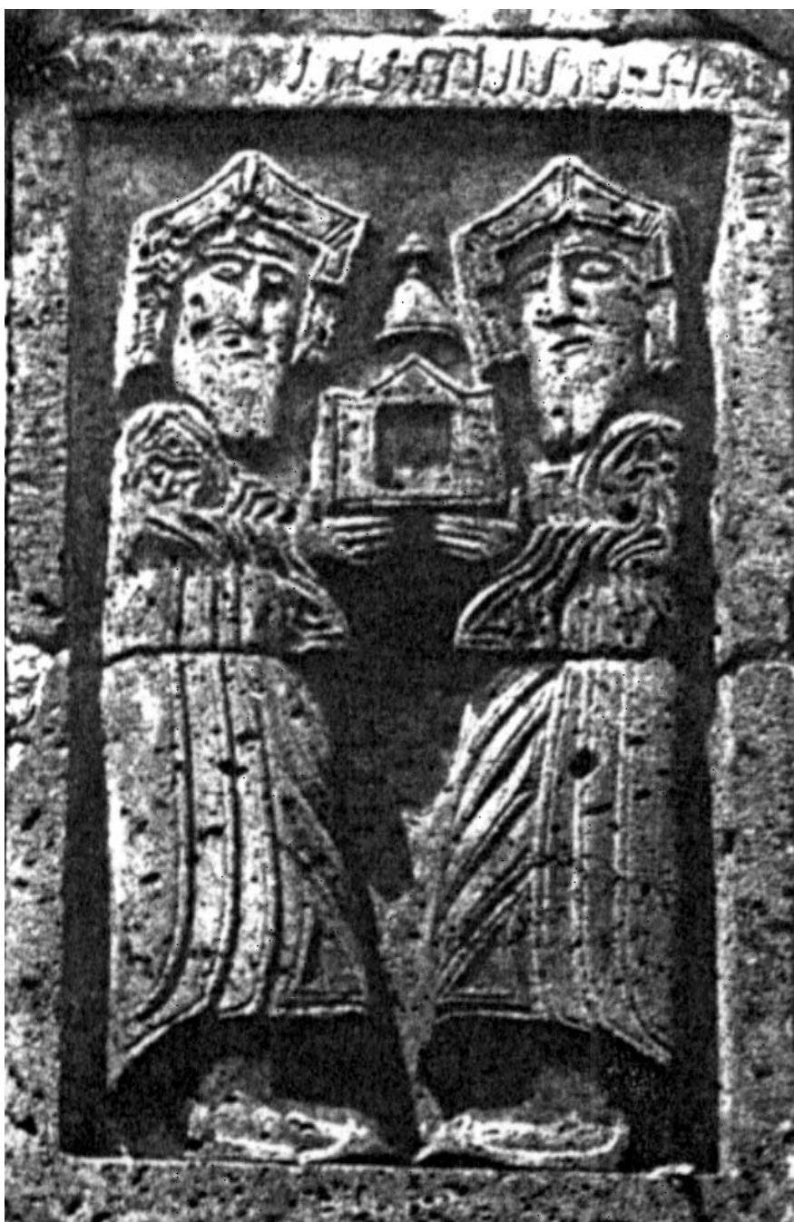
3. ábra. Szanahin, Megváltó-templom, alapítási dombormű