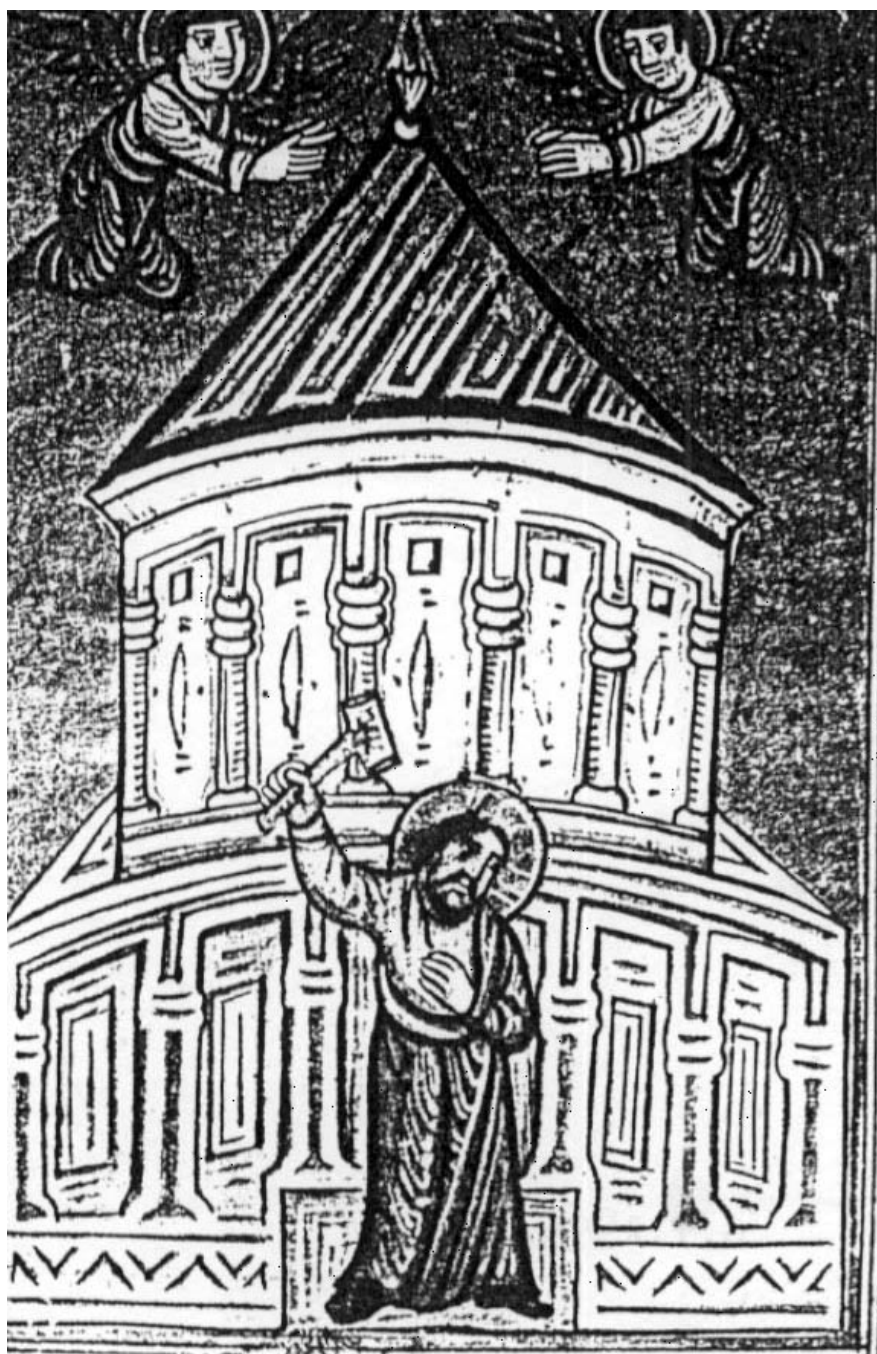
7. ábra. Krisztus, az építő. Örmény miniatúra, XVII. sz.