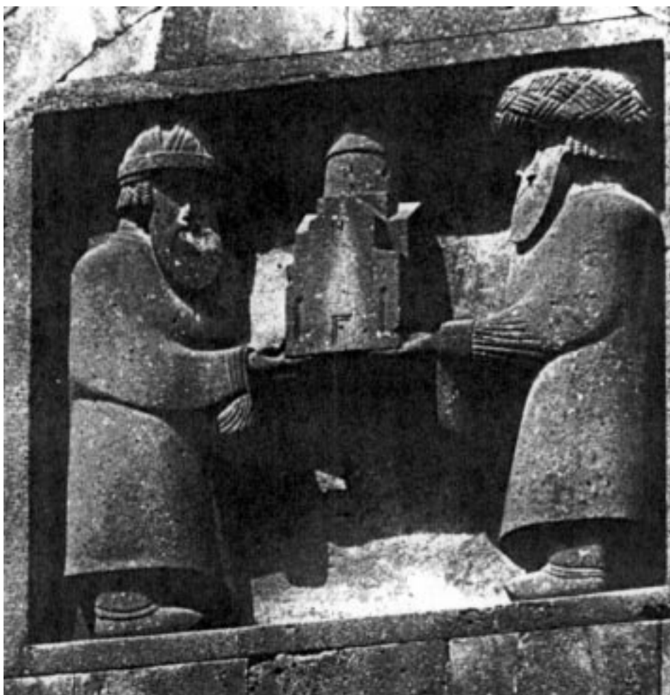
2. ábra. Haghat, kolostori főtemplom, alapítási dombormű

ból. Azt a látszatot kelti, mintha a teljes modellt félig a falba süllyesztették volna. Ez fölveti az örmény középkori tervezésnek egy olyan módszerét, hogy az építőmester ténylegesen elkészítette a templom kicsinyített kőmakettjét, azt fogadtatta el a donátorral, majd idővel ezt a modellt falazták be az épület megfelelő helyére. A problémára egy másik alapítási dombormű kapcsán visszatérünk.