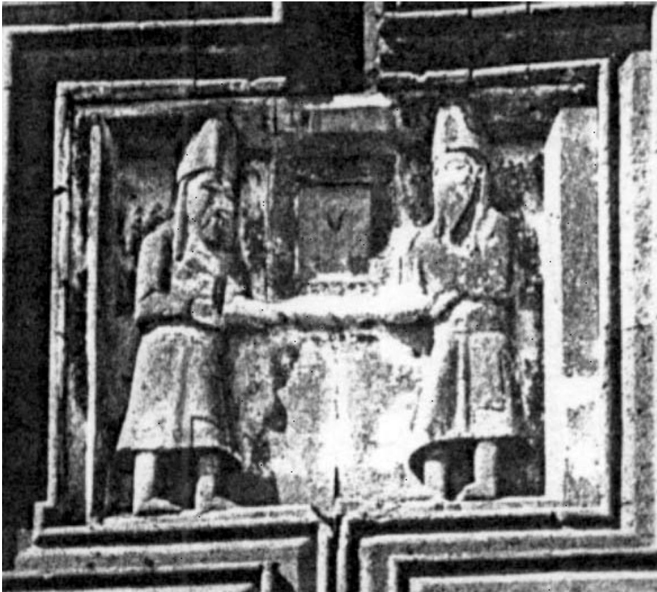
4. ábra. Harics, kolostoregyüttes, alapítási dombormű

Aniban, a Gagrik-templomon (1001–1013) szintén volt egy alapítási szoborcsoport. Gagrik Bagratuni király (989–1020) alapította a családi magánegyházat, s építője Trdat mester volt. A templom 1905-ös kutatásakor Thorosz Thoramanjan találta meg a töredéket: egy turbános álló alak kezében eredetileg templommodellt tartott. 18 A modell teljes körplasztika volt. A leletről szerencsére rajzok és fotók készültek, ugyanis mind a dombormű, mind az időközben elszállított modell az 1915-ös genocidium során megsemmisült (6. ábra). Ez az alapítási dombormű-töredék két szempontból is fontos.