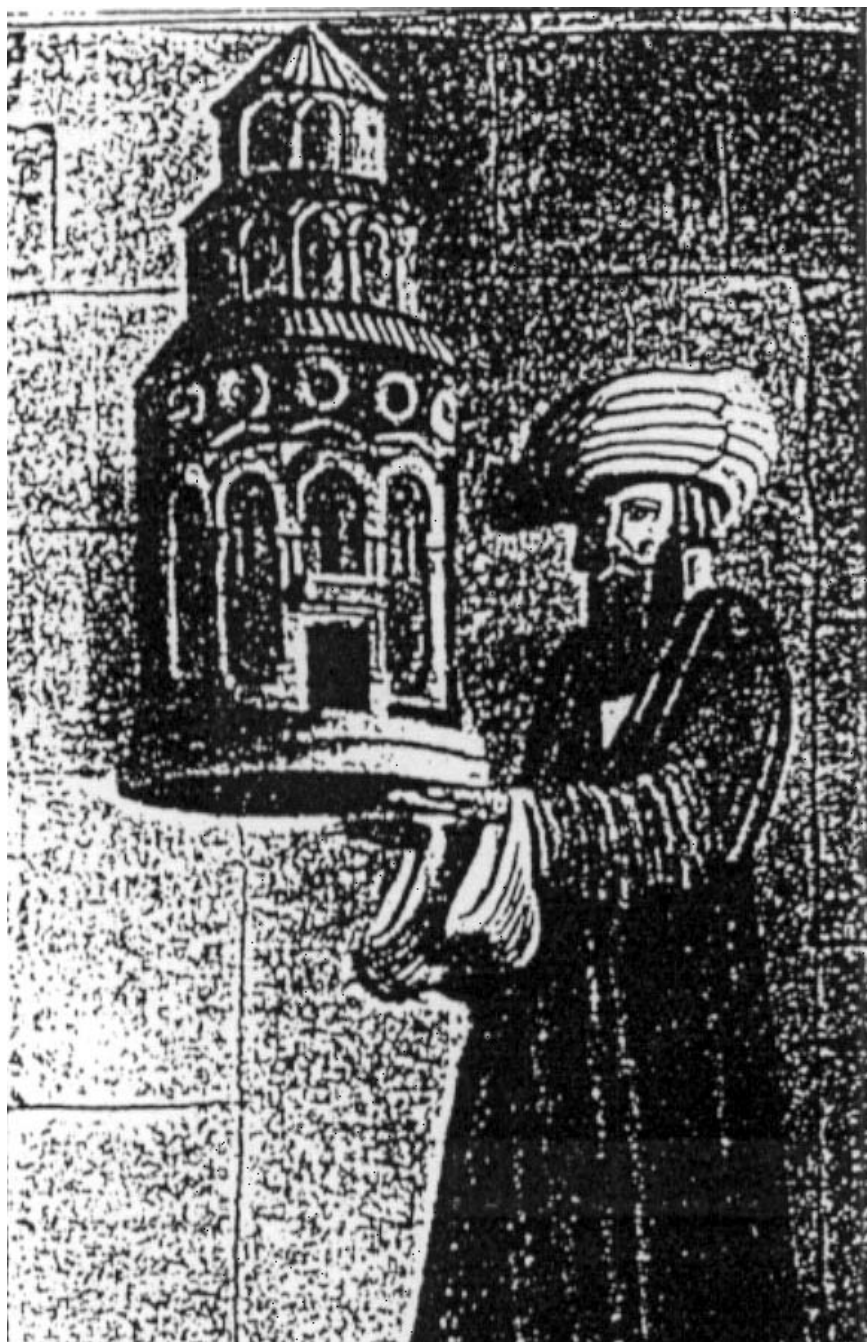
6. ábra. Ani, Gaghik-templom. Gaghik király (vagy Trdat mester) ábrázolása