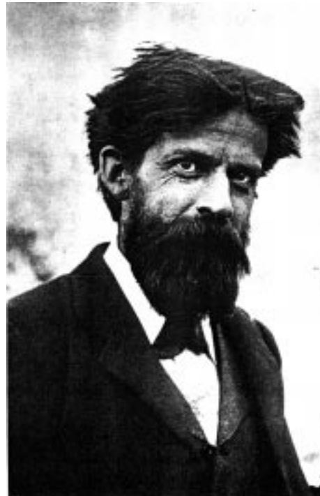
Patrick Geddes 44 éves korában 1898-ban

Ruskin e művészetelméletre építette az organikus társadalom elméletét, az így felfogott alkotó/teljes élet általánossá tételét, ami nála – az ipari társadalom tapasztalatai szerint – a munkára, mégpedig a személyes (kézműves) munkára alapult. (Mintaként a középkort emelte ki, amivel együtt járt a helyi építészeti tradíciók, regionális anyagok felfedezése.) Ezzel ugyan előlegezte a szocialista társadalomelmélet kialakulását, annak ember-felfogását (a munka tette emberré az embert), de az akkor még a biológia tudományának eredményeivel ötvöződött. Ruskin fiatalabb kortársa, William Morris a formatervezést, építészetet is tökéletesen organikus tevékenységként fogta fel, mikor az életmód kifejezésének tartotta a funkció és forma azonosságát. Organikus szemlélet és biológiai filozófia (Darwin, majd T. H. Huxley és Herbert Spencer) együtt inspirálták a 19–20. század fordulójának építészét, ami legkomplexebben a várostervezésben, város-rehabilitációkban bontakozott ki.