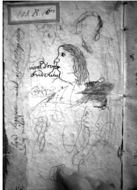
1. kép Diák firka

Mitterpacher: Primae Lineae historiae naturalis, In usum gymnasiorum regni Hungariae, et regnorum eidem adnexorum című könyv előtáblájának tükrén 23