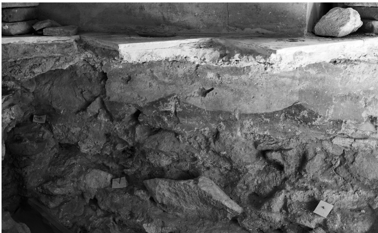
10. Lábazati falfestés részlete az északi toronyban