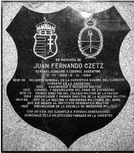
Czetz János emléktáblája a Chacaritai temető (Cementerio de Chacarita) Hősök és Mártírok Falán