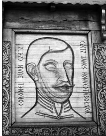
Czetz János dombormű a Plaza Hungrián, Buenos Aires

82 éves korában.” 50 Egész oldalas megemlékezéssel adózott Czetz János tábornoknak a Budapesti Hírlap 1904. október 6-ai száma is. „Az agg katona pihenni tért sok ezer mér-földre attól a helytől, a hol született, a hol apját, anyját örök pihenőre tették.” 51