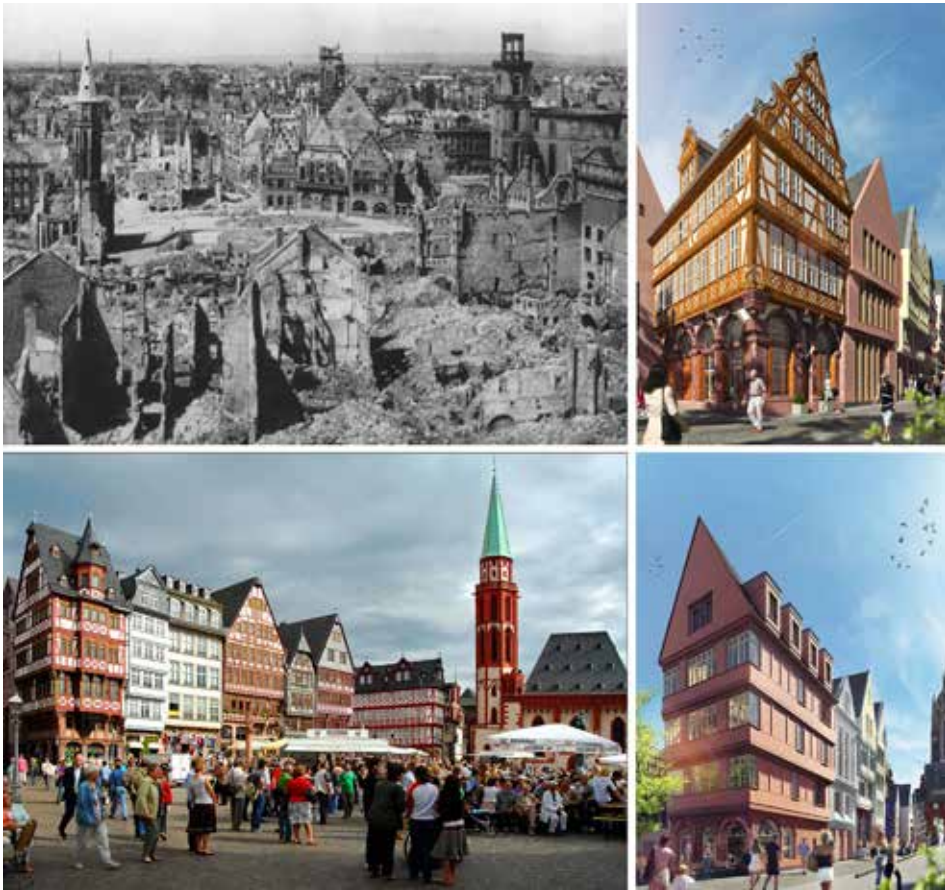
9. ábra. A frankfurti Römerberg rekonstrukciójának korábbi szakaszai és a „Dom Römer projekt” új részei

hetünk. A füzéri vár nem más, mint műemléki környezetbe épített kortárs épület, mely irreverzibilis módon in situ középkori romokra építkezik, megváltoztatva ezzel a hely történeti megjelenését egy sosem volt állapot kedvéért, végleges preconcepciókat beépítve a megismerés folyamatába. Végleges állásfoglalás, funkcionálisan és talán egy ideig gazdaságosan fenntartható megoldás, mely örökre adott tudományos keretek közé zárja a hely szellemét. E kortárs historizáló attrakció építészeti megítélése műemlékvédelmi szempontok alapján már nem lehetséges, ez már kortárs építészelméleti és kritikai feladat. Olyan analogikus építészeti megközelítés jellemzi, ahol az új és még újabb részeket – a nyírbátori példához hasonlóan – eltérő építészeti megoldásokkal különböztették meg egymástól (pl. a gyilokjárók esetében).