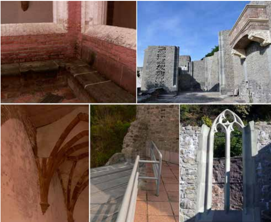
3. ábra. A visegrádi palota – máig folyó – helyreállítása

A visegrádi királyi palota 2000-ben átadott részleges rekonstrukciója arra mutatott rá, hogy egy rom romként való kiegészítése mennyi buktatóval jár. 16 A helyreállítást éppen az az építészeti didaktika jellemzi, melytől a leginkább szeretne volna magát távol tartani (3. ábra). Ilyen mérvű kiegészítés inkább a befejezés irányába tesz már lépéseket, és azóta is kisebb-nagyobb kiegészítésekkel a romterület egyes elemei lassan kiépülnek. A kényszerű töredékesség folyamatos feszültséget jelent az üzemeltető és a hatóságok között. Az egyes épületrészekben a tervezett ideiglenesség látszik, mely a gyors szerkezeti és esztétikai avuláshoz vezet. Figyelemre méltó jelenség továbbá az elődök munkájának mint meglévő periódusnak a tiszteletben tartása és az attól való markáns megkülönböztetés igénye. A részleges építészeti rekonstrukció jól láthatóan itt közelebb áll az építészeti restauráláshoz, új elemei azonban ezen igyekeznek túlmutatni. Érdeemes figyelemmel kísérni a jövőben, hogy a napjainkban születő építészeti rekonstrukciók milyen hatással lesznek az ilyen „félkész” helyreállításokra.