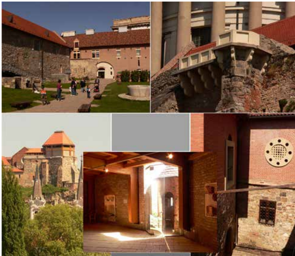
1. ábra. Az esztergomi vár posztmodern építészeti részletei