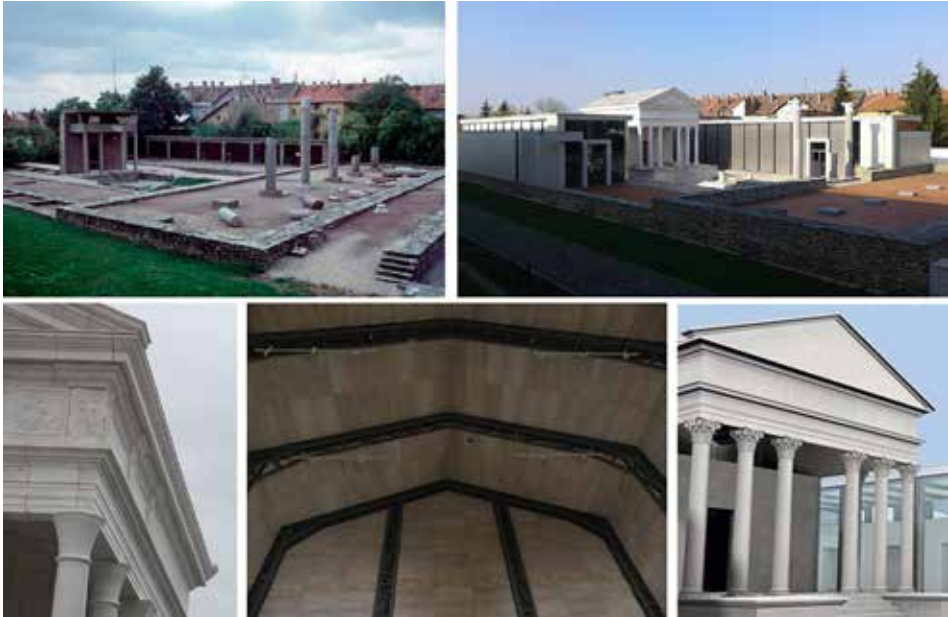
5. ábra. A szombathelyi Iseum egykor és ma (fent), illetve a számítógépes modell és a megépült épület (lent)

A diósgyőri vár jelenleg félkész rekonstrukciója további kérdésekre mutat rá. 19 Ferenczi Károly 1955–1973 közötti modern helyreállításának elemeit itt, a visegrádi beavatkozásoknál látottakkal ellentétben nem mindenhol tartották tiszteltben. A már feljebb említett didaktikai problémákon túl Diósgyőr mindannak mintapéldája, ami a rekonstrukció építészeti problémáit jellemzi egy köztes szakaszban (6. ábra). A vár kiépítése „külső okokból” megállt, de úgy tűnik, a hipotézis nem állt meg, és borítékolható a vár magas tetővel való ellátása, így végső soron a rekonstrukciós munkák befejezése a közeljövőben. A diósgyőri vár esetében tűnik először szembe a régi és új építészeti elemek sajátos dialógusa. A megkülönböztetés „finomsága” a szabványoknak megfelelő használatot szolgáló elemekkel alkotott kontraszt miatt sem érezhető megfelelően. Jelen állapotában jórészt ugyanazokkal a problémákkal küzd, mint a visegrádi királyi palota: az új elemek a töredékesség miatt gyorsan avulnak, az építészeti összefüggések nehezen értelmezhetők.