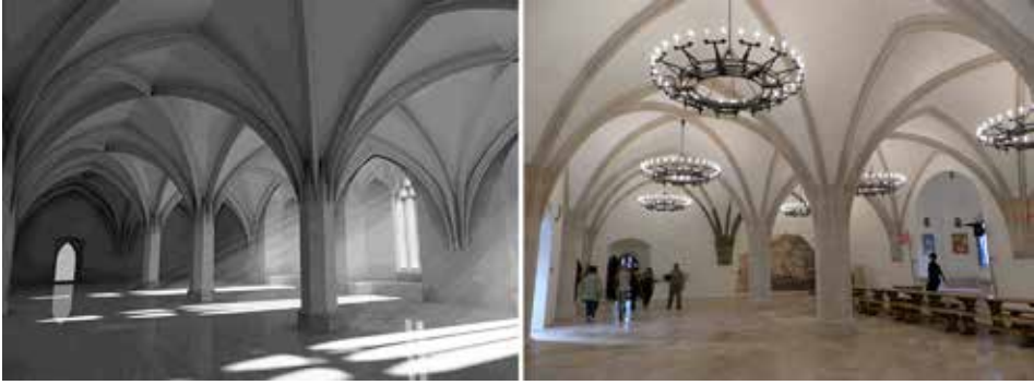
7. ábra. A diósgyőri vár lovagtermének 3D rekonstrukciója (balra, forrás: www.epiteszforum.hu ) és újjáépített állapota (a szerző fotója)

A profetikusnak látszó gondolatokat végeredményben Füzér felsővárának teljes rekonstrukciója igazolta, mely csak a felületes szemlélés útján keverhető össze a nyírbátori kiépítéssel (8. ábra ). Ha a diósgyőri kiépítés a közbenső állapot buktatóit modellezi, a füzéri rekonstrukció már a végső konzekvenciák levonását is lehetővé teszi. Mindehhez fontos adalék egy újabb idézet Buzás Gergelytől: „... a vitáknak ma már nem arról kell szólniuk, hogy egyáltalán szabad-e rekonstruálni vagy sem, hanem arról, hogy hogyan kell rekonstruálni, mert a műemlékvédelem – miként minden, a múlt megismerésével foglalkozó tudomány – egyetlen célja, egyben leghatékonyabb eszköze is maga a rekonstrukció.” 21