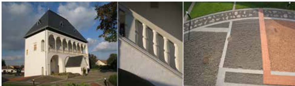
4. ábra. A nyírbátori kastély és részletei (balusztersor félreértelmezése és didaktikai gubancok)

Az igazi meglepetés 2007-ben érte a hazai műemlékvédelmet, mikor is „minden előjel nélkül” szembe találta magát a szakma a nyírbátori Báthory-kastély teljes rekonstrukciójával (4. ábra). 17 Iskolapéldája e helyreállítás a fent idézett, önmagában való didaktizálásnak. A néhány eredeti fragmentum alapján kisserkesztett hipotetikus állapot teljes megépítése felett egy modern vonalvezetésű tető „lebeg”, mely attól az „eredetitől” próbál különbözni, melyet ugyanaz a kéz ugyanabban az időben alkotott. Ez a fent részletezett építészeti skizofrénia nem csupán az alaktani hibák és az érhetetlen didaktika miatt teszi nehezen megfejthetővé mind építészeti, mind tudományosan a nyírbátori kiépítést, hanem a hozzá kapcsolódó muzeológia döbbenetesen alacsony színvonala miatt is. Ennek kérdésére később részletesen kitérek.