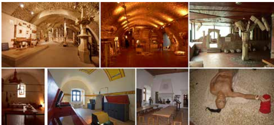
10. ábra. A kőtárak állandósága: Simontornya, Esztergom, Visegrád (fent – a szerző fotói), valamint a muzeológia új „rekonstrukciós” útjai: Visegrád (a szerző fotója), Füzér (forrás: www.epiteszforum.hu; fotó: Zsitva Tibor), Nyírbátor (a szerző fotója)