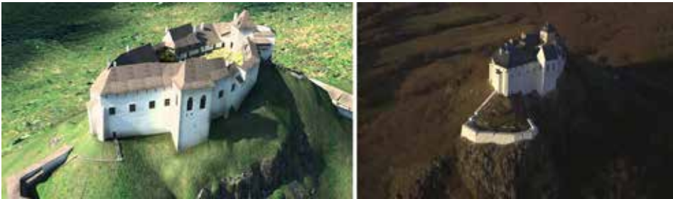
8. ábra. A füzéri vár 3D rekonstrukciója (forrás: Kelemen Bálint, www.varak-hrady.eu ) és újjáépített állapota (forrás: Épül füzér vára videó, https://www.youtube.com/watch?v=ZUP4HEk8eVE )

Füzér vára ezek szerint tehát már egy hatékony eszköz a múlt megismerésére. A minden kétséget kizárónak kikiáltott elvi rekonstrukció szakszerű megépítése, mely már szinte csak analógiákra épül. A kápolna teljesen hipotetikus visszaboltozása és kifestése, a teljesen elpusztult emeleti szint szobái a korhű berendezéssel véleményem szerint már túlmutatnak mindazon, amit műemlék-helyreállításnak nevez-