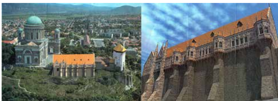
2. ábra. Az esztergomi szavazólap képei