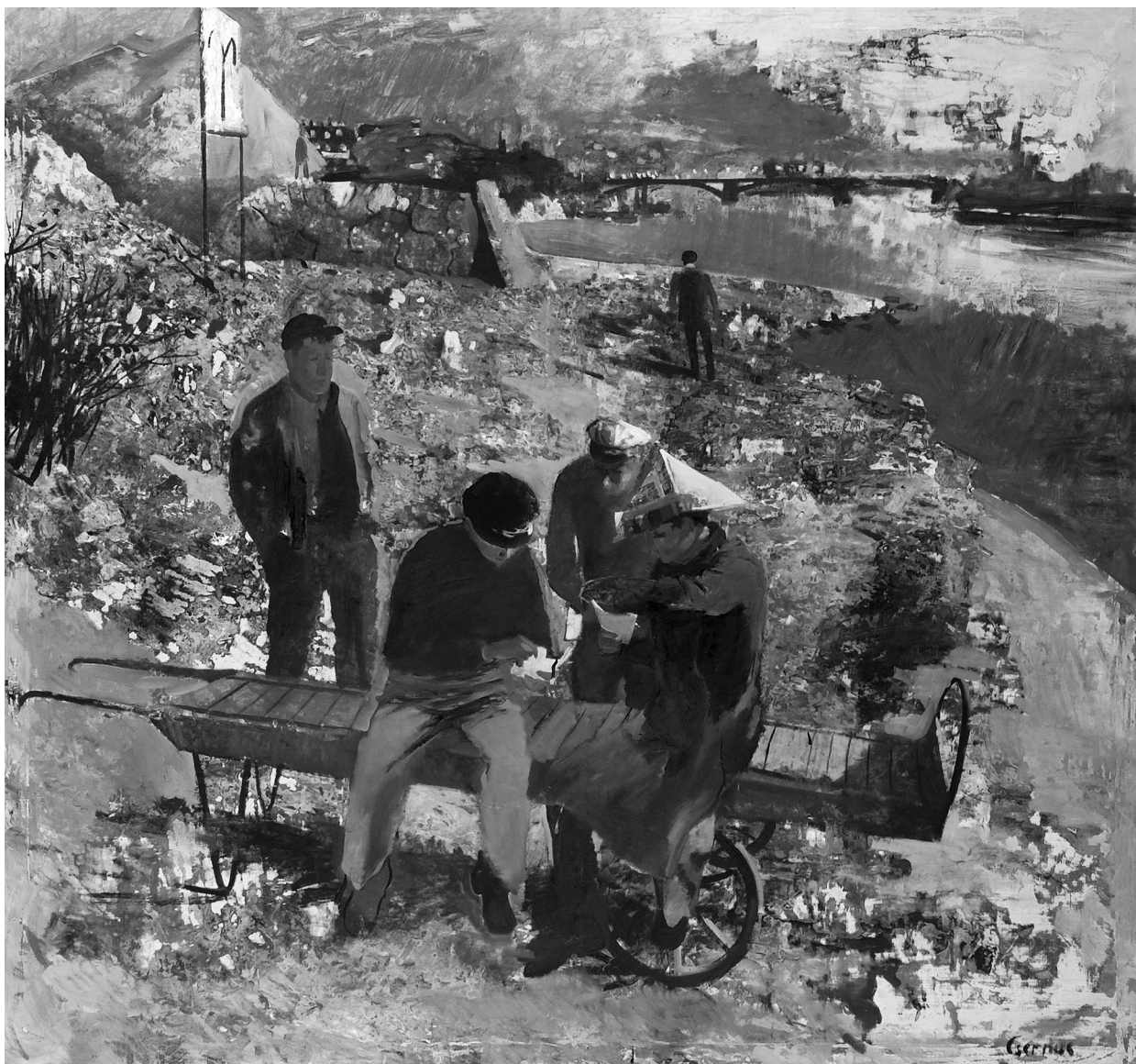
6. Csernus Tibor: Újpesti rakparton, 1956. Olaj, vászon, 140×150 cm. Magyar Nemzeti Galéria, Jelenkori Gyűjtemény, ltsz. 58.31 T

kásos 690 000 forintot, az Állami Vásárló Bizottság, ugyancsak változatlanul 600 000 forinttal gazdálkodhatott, a tárcák közül egyedül a Honvédelmi-nek jutott külön keret, 150 000 forint. Az osztály saját magának 1 760 000 forintot tartott meg; ebből iparművészetre 300 000-et, népművészetre 200 000-et, képzőművészetre 1 260 000 forintot terveztek elkölteni. 68 Ez egyébként még mindig nagy pénz volt, sok mindenre futotta belőle. Az 1957-es évben például még fotográfiákat is vásároltak. 69 Végül decemberben – hogy kései döntés és az évközi spórolás miatt a keretből megmaradt jelentős pénz el ne vesszen – nagy vásárlásokat csaptak.