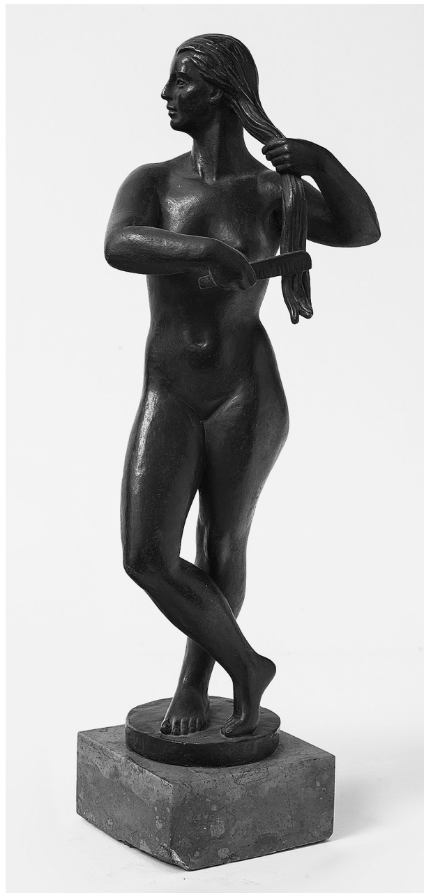
3. Mikos Sándor: Fésülködő nő, 1957 körül Bronz, 37 cm. Magyar Nemzeti Galéria, Szoborosztály, ltsz. 57.26-N

Makrisz Agamemnon ugyancsak pontosan fogalmazott, amikor a megújulási tervről beszélt: „A művészet szabadsága anyagi alap nélkül fikció.