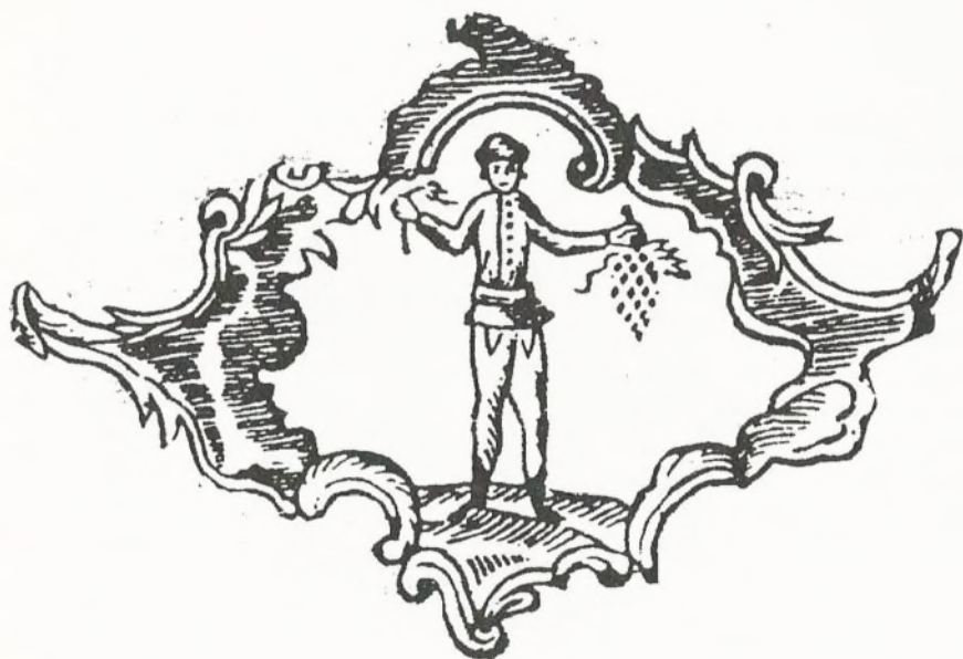
A főbb gazdasági ágakat jelképező ábrázolás Szigethy Mihály nyomdájából, 1816-ból