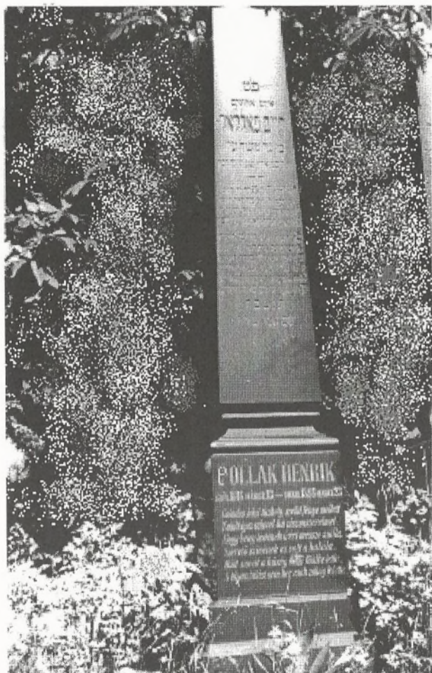
A Pollák család kevésbé vagyonos tagjának, Henriknek a sírmléke az avasi zsidó temetőben (1997)