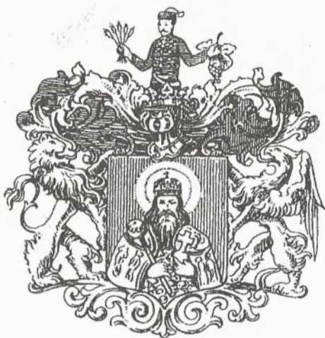
Miskolc thjf város címere 1905-1907