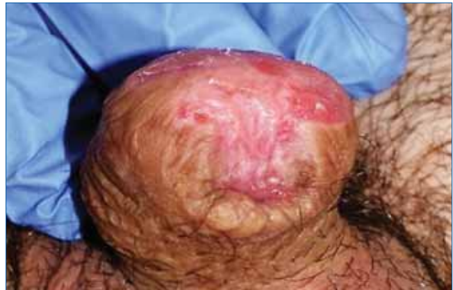
4. ÁBRA: AZ OPERÁLT TERÜLET ELLENŐRZŐ FÉNYKÉPE KÉT ÉVVEL A MŰTÉT UTÁN

niszre nyomókötés került. A patológiai feldolgozás szerint, a reszekált glansot közepesen differenciált elszarusodó laphám töltötte ki, az eltávolítás az ébren történt, minimum 1 cm-es ép sebészi széllel (3. ábra). A corpus cavernosum daganatmentes volt, a corpus spongiosum tumoros beszűrődése az urethra vég mucosáját nem érte el. Limfovaszkuláris invázió a mintában nem igazolódott. Stádiumbesorolás pT2 GII. A posztoperatív szak eseménytelen volt, a drén a második, a katéter a hetedik napon lett eltávolítva. A mucosa szabad lebeny megszokott módon gyógyult, először szigetszerűen borítva a végeket, majd a hám teljesen befutotta a neoglans területét. Az új külső húgycsőnyíláson át a vizelet vastag sugárban ürült. Az ellenőrzés negyedévente megtekintésből (4. ábra), szonográfiából, évente hasi-, kismencedei CT-ből és mellkasröntgenből állt, a rutin laborvizsgálatok mellett. A maradéktalan eltávolítás, a recidívamen-