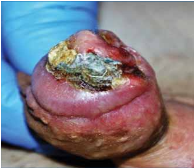
1. ÁBRA: FÉNYKÉPFELVÉTEL A GLANSOT CSAK NEM ELFOGLALÓ, NEKROTIKUS FELSZÍNŰ DAGANATRÓL