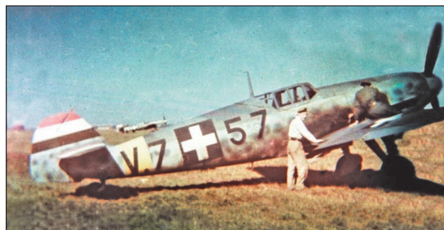
24. ábra. A győri MWG-ben összeszerelt Messerschmitt Bf 109Ga-4-es (V.757, gyári szám 91023) restaurált, színes fotója