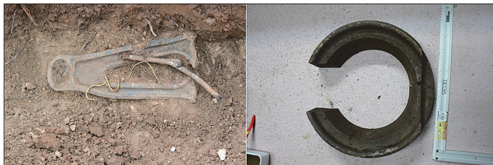
23. ábra. Motortartó (balra) és kiegyenlítő orrsúly (jobbra)