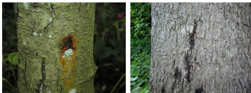
Friss és régebbi kátrányfoltok fiatal és idős fán

Az égeres fitoftórás megbetegedésének első jelei minden esetben a törzsön jelennek meg kisebb nagyobb, barnás-fekete, ún. kátrányfoltok formájában. A nedvfolyás eredhet egyetlen pontból - ez a leggyakoribb - vagy esetleg kisebb kéregrepedésekből. A friss nedvfolyás gyakran narancssárga színű a foltok peremén, ami később megbarnul. Idővel a foltok sötétbarnák illetve fekete színűek lesznek. Megfigyeléseink szerint a friss foltok többnyire ősztől tavaszig jelennek meg. A nyár folyamán csak néhány esetben jegyeztünk fel friss nedvfolyást, foltosodást.