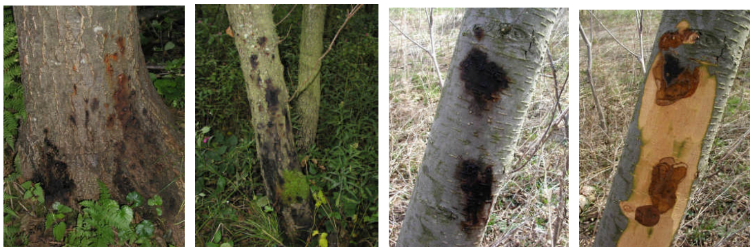
Jellegzetes kárnyafoltok a törzsön