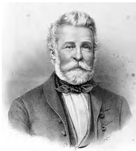
3. ábra. Bugát Pál könyvnyomatos arcképe („Nyomt. Rohn és Grund Pesten 1866” MM Tört. gyűjtemény 85.4.1)

Fig. 2. The native house of Pál Bugát, before reorganization