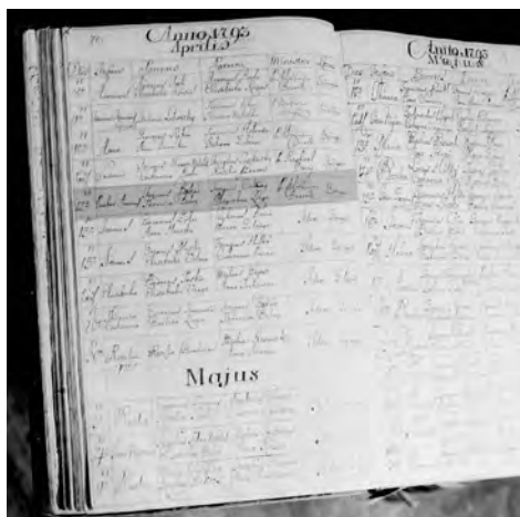
1. ábra. Kereszteltek anyakönyve 1793. A 79. szám alatt 12-i dátummal látható bejegyzés kiemelve