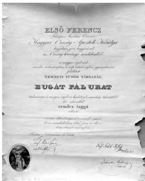
5. ábra. A Nemzeti Tudós Társaság oklevele (MM Tört. gyűjtemény 85.5.1)