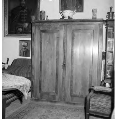
8. ábra. A Bugát-szoba a múzeum állandó kiállításában Fig. 8. The Bugát room in the permanent exhibition of the Museum