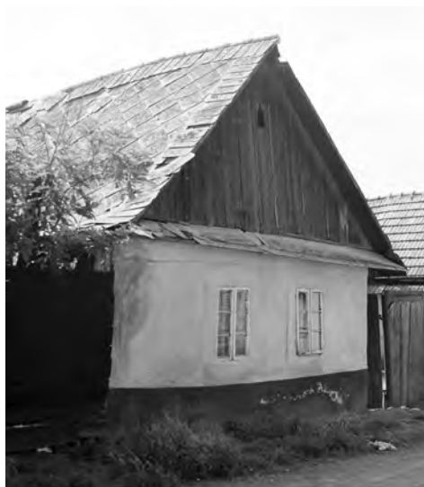
2. ábra. Bugát Pál szülőháza a szanálás előtt