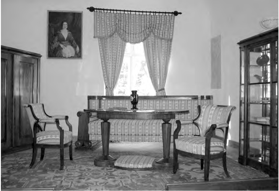
7. ábra. Bugát Pál hagyatéka eredeti helyén, Szécsényben Fig. 7. The inheritance of Pál Bugát in its original location, Szécsény

ték, amely egy 89 darabból álló csiga és kagyló gyűjteményt is magában foglalt (PODANI & VARGA 1984). Ez a tárgyegyüttes Lukhovitz Imréné, Szécsény Bocskai u. 5. szám alatti lakos tulajdona volt. Arról semmilyen feljegyzés nem készült, hogy hogyan került hozzá. A Lukovich (Lukovitz, Lukhovitz, Luckovitz) család a 19. században Nógrád megyében töltött be jelentősebb tisztségeket (Gábor 1828–1836 között megyei főügyész) és rendelkezett földbirtokkal is. 1969-ben végül a múzeum megvásárolta a hagyatékot, mely esemény 218/1969 számmal került az iktatókönyvbe (MOLNÁR 1972–1973).