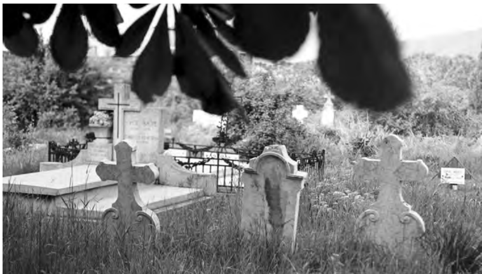
6. ábra. A család sírkövei a gyöngyösi temetőben Fig. 6. Family tombstones in the Gyöngyös Cemetery