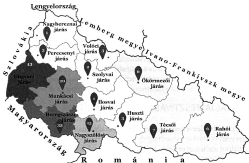
2. ábra. Kárpátalja vizsgált fesztiváljainak területi eloszlása (N = 145)