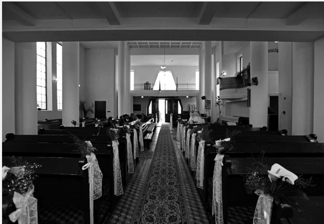
TISZABERCEL, REFORMÁTUS TEMPLOM (ZSANDA JÁNOS, 1951)

Miközben úgy tűnik, hogy a két világháború közötti időszakban gazdagodik a speciális központosítás felé törekvő példák száma, az emlék-