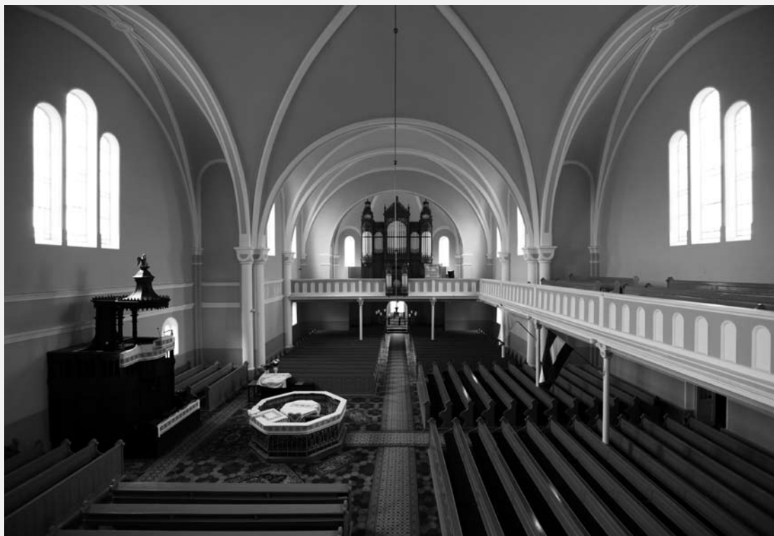
DOMBRÁD, REFORMÁTUS TEMPLOM (BÍRÓ LAJOS, 1912)

ra. 3 Miközben a modern kor emberének a folyamatosan fejlődő teológiai elemzések támpontokat nyújtottak, addig a rendszerváltás utáni évek templomépítészetében nem történt meg az áthangolás: a régmúlt már begyakorlott feltárással kívánt példát mutatni, meg nem haladva az 50 évvel korábbi naprakész elméletet és gyakorlatot. 4 Így vélt-talált-átértelmezett, vagy épp félreértett szimbólumok és elvek mentén sokszor kétes építészeti minőségű templomok épültek, melyekből nem a jó szándék, hanem a megalapozott tudományos háttér – legfőképp építészeti, de néha teológiai értelemben is – hiányzott. 5 Az új kutatásoknak valójában a '40-es évek alapvetően naprakész tudományos és művészi gyakorlathoz kell kapcsolódnia.