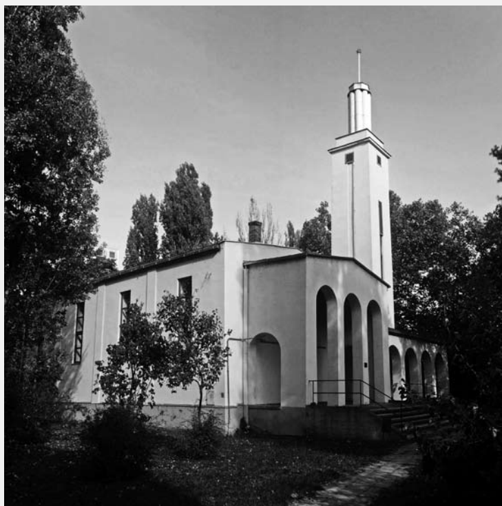
CSONGRÁD, REFORMÁTUS TEMPLOM (ANTAL ENDRE, 1937)

ugyanakkor – annak érdekében, hogy a lelkes közel maradjon a hívekhez – javasolja a szószék főhajójában történő elhelyezését. Ezt értelmezhetjük egyfajta templom-divathoz alkalmazkodásként is (hasonulásként a katolikus templomok formájához), miként másik iránymutatása is efelé vezet: a neogótika alkalmazása mellett foglal állást. A néhány évtizeddel később megfogalmazott wiesbadeni iránymutatások azonban már inkább a szellemi tartalmakkal foglalkoznak: a protestáns templomot a közösség 'házaként' értelmezi, és az ünneplésre összegyűlők számára egységes térforma létrehozását javasolja. A wiesbadeni programban alkalmazott szimbolika szerint a szószék és oltár (reformátusoknál Úrasztal) egyenrangú elemei egységet képeznek, és elhelyezésük a kö-