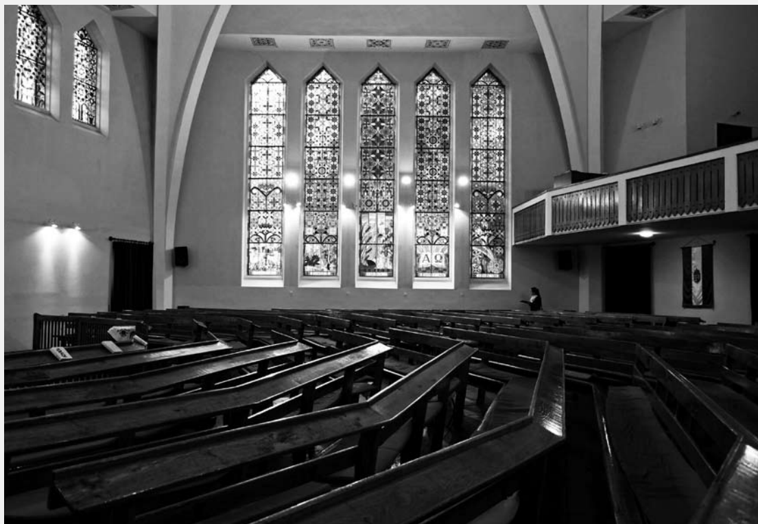
SZEGED, HONVÉD TÉRI REFORMÁTUS TEMPLOM (BORSÓS JÓZSEF, 1942)

ugyanakkor – annak érdekében, hogy a lelkes közel maradjon a hívekhez – javasolja a szószék főhajójában történő elhelyezését. Ezt értelmezhetjük egyfajta templom-divathoz alkalmazkodásként is (hasonulásként a katolikus templomok formájához), miként másik iránymutatása is efelé vezet: a neogótika alkalmazása mellett foglal állást. A néhány évtizeddel később megfogalmazott wiesbadeni iránymutatások azonban már inkább a szellemi tartalmakkal foglalkoznak: a protestáns templomot a közösség 'házaként' értelmezi, és az ünneplésre összegyűlők számára egységes térforma létrehozását javasolja. A wiesbadeni programban alkalmazott szimbolika szerint a szószék és oltár (reformátusoknál Úrasztal) egyenrangú elemei egységet képeznek, és elhelyezésük a kö-