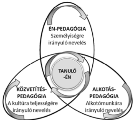
3. ábra. Az ÉKP episztemológiai nézőpontjai