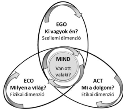
2. ábra. Ontológiai alapkérdések

Ki vagyok én mások és magam számára? Mi a dolgom másokkal és magammal szemben? Identitás-tudatomat, benne környezettudatomat, én/ön(érték)tudatomat, felelősségtudatomat az általam használt beszédmód, a nyelv mint „a lét háza” mások és magam számára is reflektálható objektivációként tükrözi ( Gadamer; 1984 ).