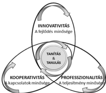
4. ábra. STEP 21 minőség dimenziók

Sajátos episztemológiai differenciálódásról tanúskodik az a tény, hogy (bár a munka- és alkotótevékenység mindig is a képesség- és személyiségfejlesztés alap-