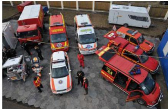
Tíz napig önellátó