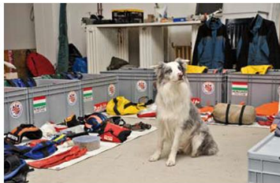
Romok alatt rekedtek keresésére felkészülve