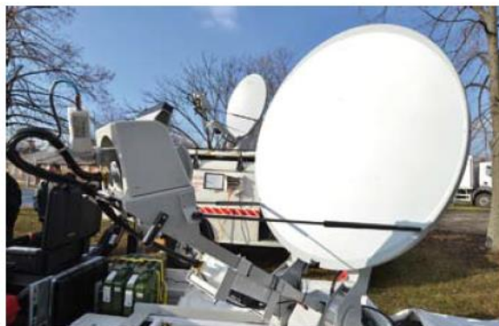
A kommunikáció alapfeltétel