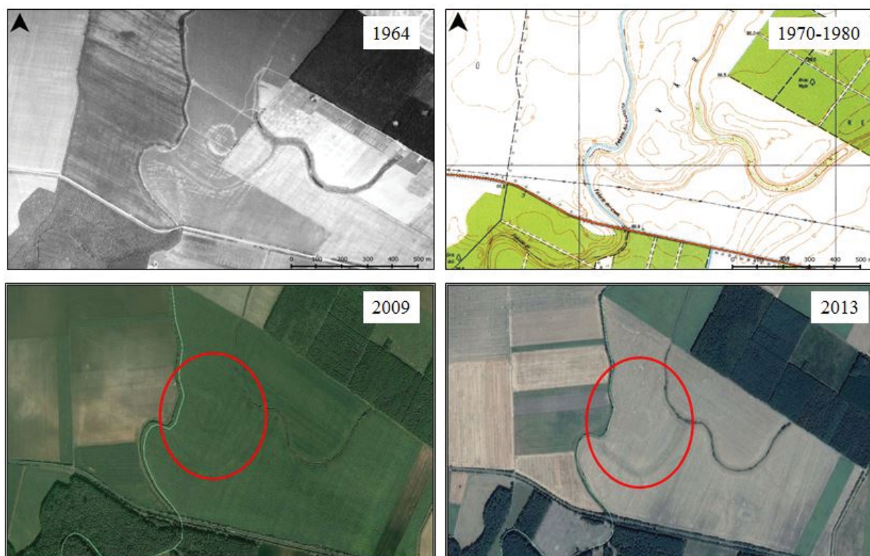
3. ábra A Sarkad–Vár-tábla földvár légi felvételen (1964), az 1:10000 méretarányú EOV topográfiai térképen (1970-1980), a 2009. és a 2013. évi műholdfelvételen

A földvárat egykoron körbekerítő árok, annak feltöltődése és eltérő vízháztartási viszonyai miatt a műholdfelvételeken jól kivehető módon mutatkozik meg (3. ábra). A vizes árkok másik jellegzetessége, hogy a nyomvonalán a jobb vízellátottság miatt eltérő – jellemzően bujább és magasabbra nő – növényzet alakul ki. A 2009. évi műholdfelvételen is kirajzolódik a földvár ovális része, illetve az attól délre lévő sáncárok. A 2013-as műholdfelvétel vetés idején készült, így a talaj eltérő színe még láthatóbbá teszi azt számunkra.