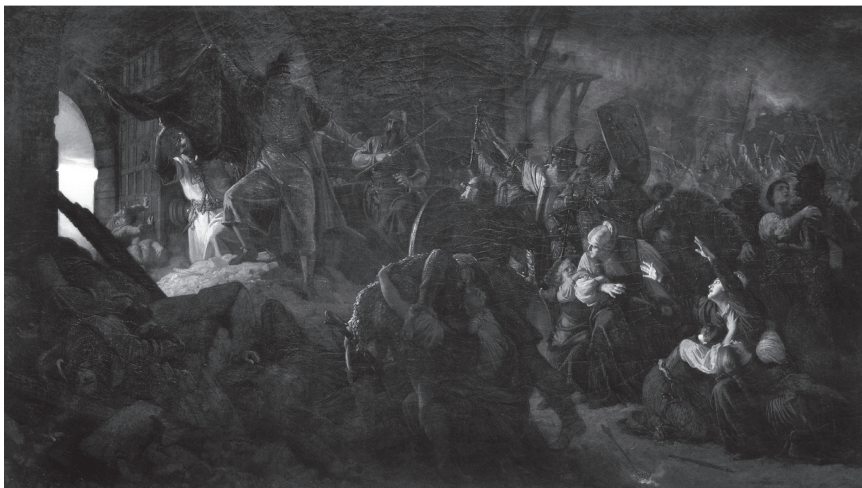
13. Székely Bertalan: Zrínyi kirohanása , 1879–1885. Olajfestmény. Debrecen, Déri Múzeum

Székely 1879-ben – ahogy erről a Vasárnapi Ujság beszámolt – már biztosan dolgozott a festményen. 60 1879 és 1884 között számos vázlatot készített, amelyek közül az egyikkel 1883-ban elnyerte a Múcsarnok történelmi festészeti pályadíját, az Ipolydíjat. 61 1884-ben még dolgozott a monumentális festményen, és azt először 1885-ben a Múcsarnokban – ahogy a korabeli kritika nehezményezte – egy félreeső, szűk helyen állították ki. Az újságíró hangsúlyozta, hogy bár a festményen „a hazaszeretet, a hősiesség tragédiája oly megrázó erejű”, Székely