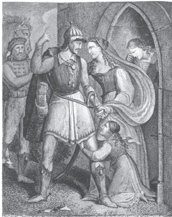
10. Leander Russ – Johann Neidl: Zrínyi Miklós búcsúja családjától. In: Uránia Nemzeti Almanach , Esztergom, 1828, 120–121.