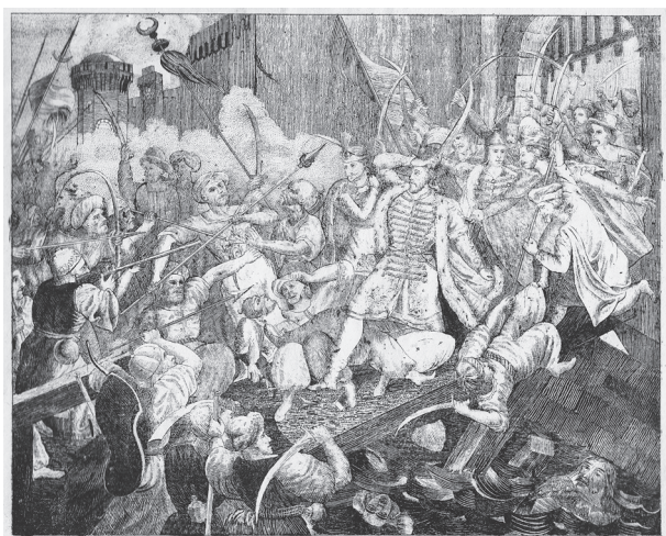
7. Zrínyi kirohanása. Litográfia. In: Új oktató és mulattató Filler-kalendárium 1837. Címlapelőzék

a nép között forgott százados zene-töredékekből című, Kirch János nagykárolyi zenetanár által megjelentetett zeneműve kottájának címlapját is 35 (8. kép). A motívum rákerült Lavotta műve 1900. évi újabb kiadásának szecessziós címlapjára is. 36