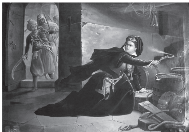
15. Weber Xavér Ferenc: Szigetvár végpercei , 1871. Olajfestmény. Szigetvár, Városháza

A jelenet képzőművészeti ábrázolásával a müncheni képzőművészeti akadémián Wagner Sándornál és Karl Pilotynál tanult, majd a bajor városban letelepedett Weber Xavér Ferenc (1829–1887) Szigetvár végpercei című, 1871-ben készült olajfestményén találkozunk. A kép középső részén a lőporos hordók fölé fáklyát nyújtó nőalakot látunk, az ajtónál pedig a terembe berontó törököket 71 (15. kép). A festményt