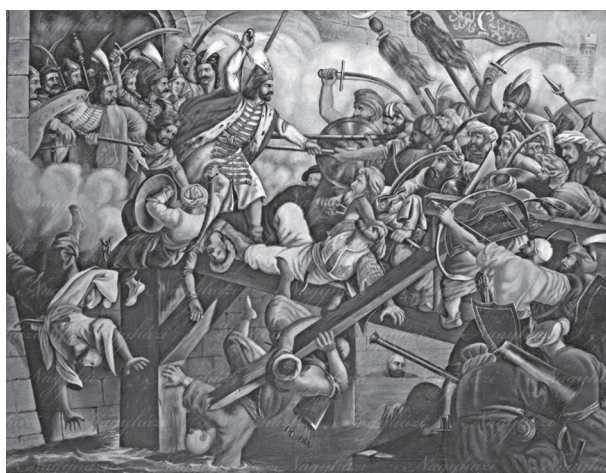
5. Ismeretlen festő: Zrínyi kirohanása, 1825 után. Olajfestmény. Magántulajdon

Akademie der Bildenden Künste Wien, Kupferstichkabinet