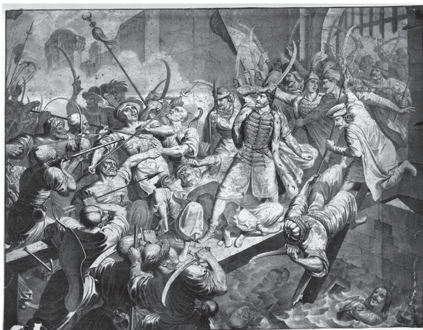
6. Zrínyi kirohanása. Litográfia, 1837 előtt. Österreichische Nationalbibliothek, Bildarchiv und Graphiksammlung