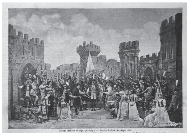
12. Zrínyi esküje és Zrínyi kirohanása című előképek. In: Vasárnapi Ujság 1892. 48. szám. (november 27.) 817.

Székely Bertalannak 1879–1885 között készült, a Debreceni Déri Múzeumban őrzött Zrínyi Miklós kirohanása című monumentális festményén 53 (13. kép), amely a kirohanás előtti pillanatot ábrázolja, a nőalakok kiemelt szerepet kaptak, ahogy az asszonyok voltak a főszereplői Székely 1867-ben készített Egri nők című munkájának is. Ez utóbbi téma ikonográfiai hagyományában azonban – mint láttuk – a 17. század óta jelen volt a nők ábrázolása. Annak okát, hogy Székely a szigetvári ostrom megfestésekor is hangsúlyos szerepet adott az asszonyoknak, a történeti és irodalmi hagyományok mellett a festőnek a női élet érzelmi mozzanatai, a férfi-nő kapcsolat, a családi viszonyok iránti érdeklődésében is kereshetjük. 54