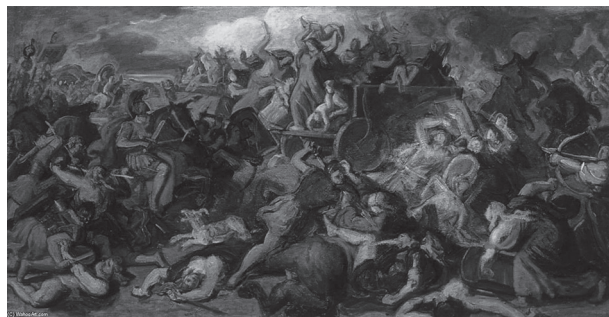
14. Karl Rahl: Tanulmány a Cimbernschlacht című festményhez, 1864 körül. Wien, Belvedere

A robbanásról a későbbi történeti források – pl. Istvánffy Miklós (1538–1615) – is tudósítottak. Forgách Ferenc úgy tudta, hogy Zrínyi tudatosan robbantotta fel a tornyot: a kirohanás alatt „egy sziklakövekből épített toronyba, amely tele volt lőporral és tüzérségi lövedékekkel, mikor már végképp nem reménykedhettek, égő gyújtózsínórt vezettek ügyesen. Így a vár elestével, midőn a megszámlálhatatlan sokaság betódult, és nemcsak a várat meg a várost lepte el az egész táborból odaözönlő sok főemberrel együtt, hanem a körös-körül elterülő síkságot is: akkor robbant fel a lőporraktár, és a mindenfelé hulló lövedékek és sziklák, amerre csak csapódtak, sűrű