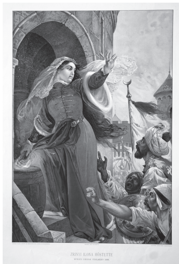
17. Zrínyi Ilona hőstette Munkács várának védelmében 1688-ban, 20. század. Papír, színes nyomat. Magyar Nemzeti Múzeum, Történelmi Képcsarnok

rohanás előtt megölt lányát Helénának (Ilona) hívták. Nem zárhatjuk ki, hogy ez a névazonosság is hozzájárulhatott Zrínyi Ilona és az 1566. évi szigetvári ostrom 20. századi, fent említett összekapcsolásához.