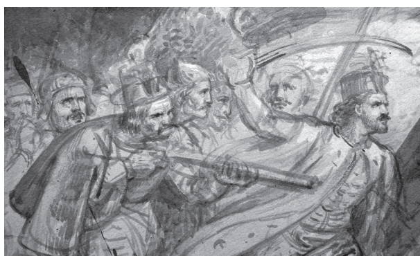
4. Moritz von Schwind: Zrínyi kirohanása, 1820-as évek. Ecsetrajz részlete.

A „tömegkultúra” és a „magas kultúra” közötti sajátos, a megszokottól ellentétes irányú átjárást jelez az a magántulajdonban lévő nagyméretű (140×180 cm) olajfestmény, amely Kriehuber litográfiájának pontos másolata (5. kép). A két műalkotás egymáshoz való viszonyában nemcsak az a szokatlan, hogy nem a festmény szolgált – mint ahogy a korban ez megszokott volt, s ahogy a Krafft-festményről készült Stöber-metszet esetében is láttuk – a széles körben terjesztett, olcsó sok-