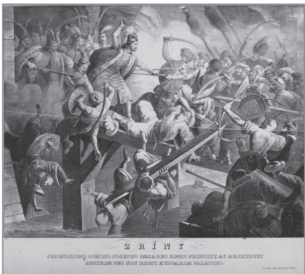
3. Moritz von Schwind – Josef Kriehuber: Zrínyi kirohanása, 1825. Litográfia. Magyar Nemzeti Múzeum, Történelmi Képcsarnok

mellett akár Le Moyne női életrajzgyűjteményéből is ismerhette. 31