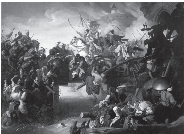
1. Peter Krafft: Zrínyi Miklós kirohanása Szigetvárból, 1825. Olajfestmény. Szépművészeti Múzeum – Magyar Nemzeti Galéria

gok meg-halni! Szivednél az én helyem – ott' járjon engem' keresztül a' Jantsárok' öldöklő fegyvere! Ne képzelj engem' oly' gyengének. Adj kardot kezem-