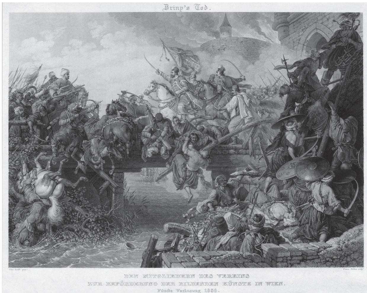
2. Peter Krafft – Franz Stöber: Zriny's Ausfall aus Szigeth, 1836. Rézmetszet. Magyar Nemzeti Múzeum, Történelmi Képcsarnok

A szigetvári vitéz nő képi ábrázolásával először – ismereteim szerint – az osztrák Peter Krafft által 1825-ben a Nemzeti Múzeum megrendelésére ké- szített, Zrínyi Miklós kirohanását ábrázoló monu- mentális festményén találkozunk. A képen sajátos ikonográfiai újításként a várból kirontó katonák között egy bajuszos-szakállas férfi – feltehetően a férje – mögött egy harci sisakot viselő szőke, gön- dör hajú, világos bőrű, elszánt tekintetű nő tűnik fel 30 (1. kép). A szigetvári vitéz nő történetét Peter Krafft – aki történelmi festményei elkészítése előtt gyakran végzett forráskutatást – a 18–19. század fordulóján megjelent, fentebb említett német nyelvű ismeretterjesztő és szépirodalmi kiadványok