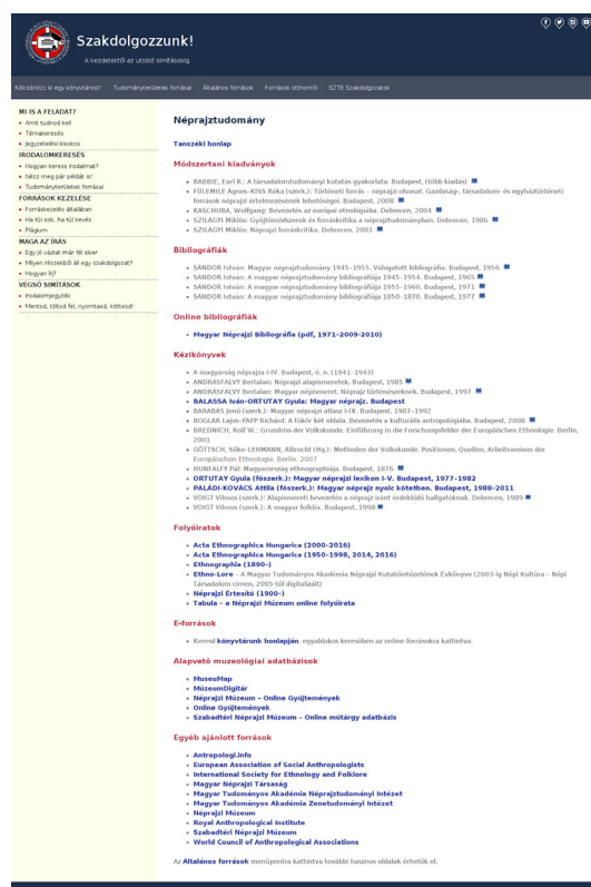
1. kép Néprajztudomány forrásgyűjteménye a Szakdolgozzunk! honlapon

A szakterületi gyűjtemény nem jöhetett volna létre a szakreferensek nélkülözhetetlen munkája nélkül. Több megbeszélést követően közösen, együttműködve a tájékoztató csoportok kollégáival együtt alakítottuk ki az egyes területek szerkezeti felépítését. Alapkoncepció volt, hogy szerepeljenek a listákban e-források és hagyományos dokumentumok is. Először a szakreferenseket kértük meg, hogy az alábbi részeket töltsék ki a saját területükre vonatkozó forrástípusokkal: