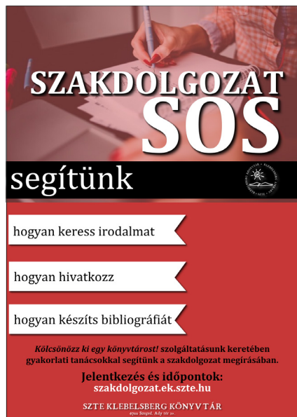
3. kép A szolgáltatás első plakátja

A szolgáltatás működését olvasva felmerülhet a kérdés, hogy miért számít újdonságnak ez a lehetőség? Mi ebben az egyedi? Hiszen a szakirodalmi tájékoztatás már évtizedek óta működő ága a könyvtári munkának. Több száz kolléga segíti irodalomgyűjtéssel, kutatással, adatbázisok bemutatásával a diákok munkáját. Miben más ez, mint a jól bevált felhasználóképzések, referenzpulton lévő kommunikáció?