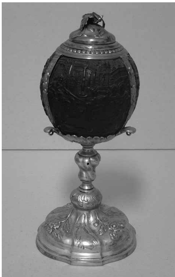
1. Kókuszserleg, a kókusz német, 1548, a foglalvány magyar, 18. század. Iparművészeti Múzeum, ltsz: 53.1194