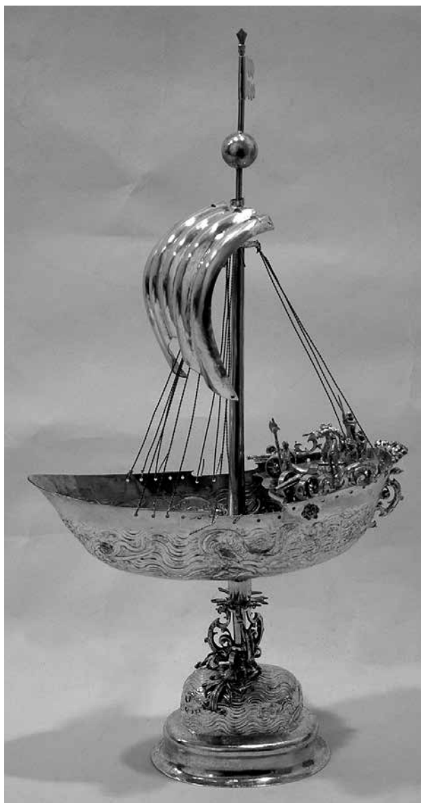
10. Hajó alakú asztaldísz, Nürnberg, 17. század eleje. Iparművészeti Múzeum, ltsz.: 53.1995