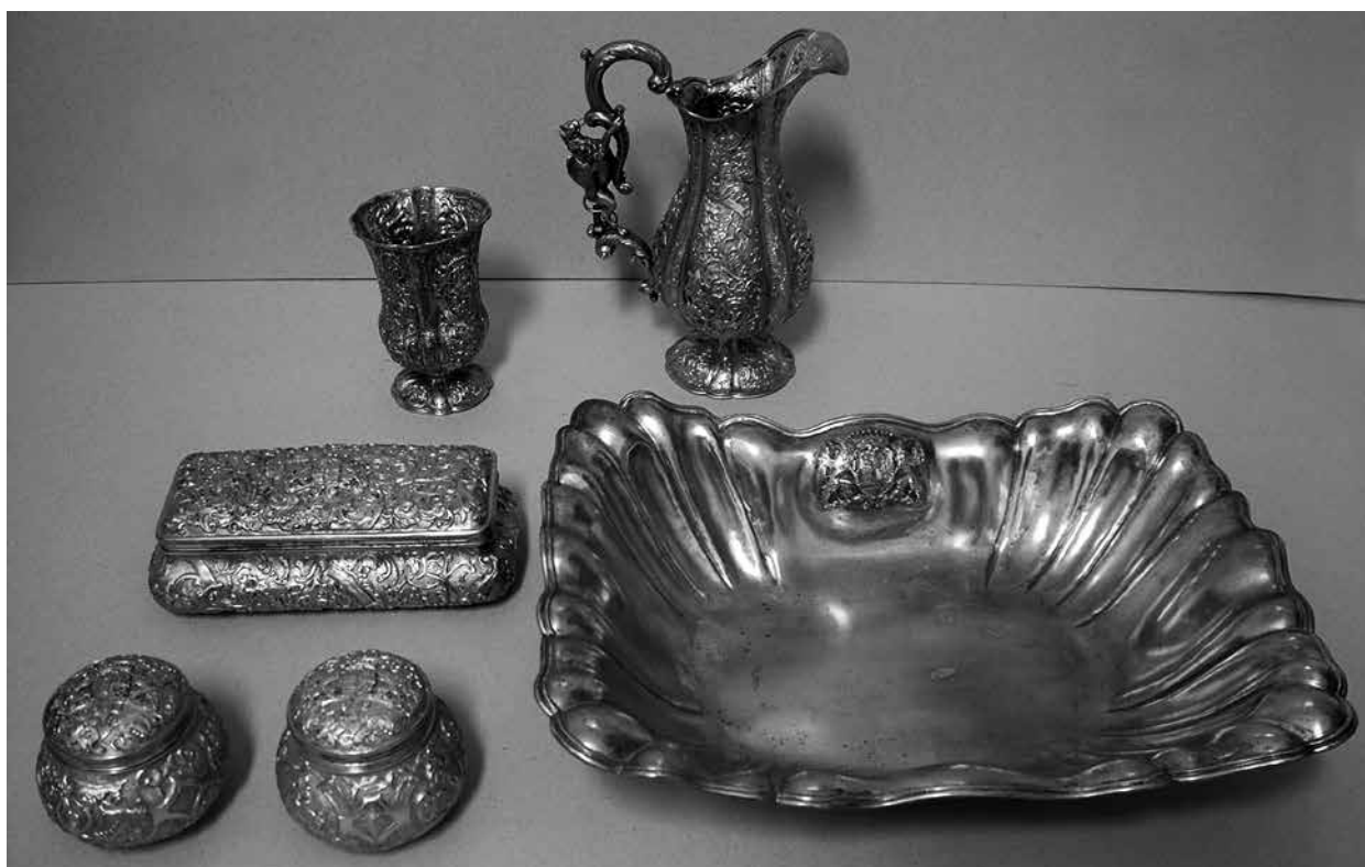
11. Toilette-készlet a gr. Vigyázó család címerével, Bécs, 1847. Iparművészeti Múzeum, ltsz.: 53.2191-2196

megjelenik, és a kis kannácska fülén a pajzstartó címerállat, griff kapaszkodik fel.