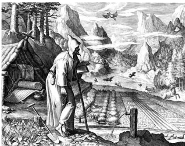
14. Johannes és Raphael Sadeler: Trieri Simeon remete, 1593–94. Rézmetszet, papír

Az egri irgalmas rendház celláinak ablaktábláin összesen kilenc szent életű remete látható. A képek jól illusztrálják a Kempis Tamás (1390–1471) Ágoston-rendi szerzetes Krisztus követése című könyvében leírtakat: