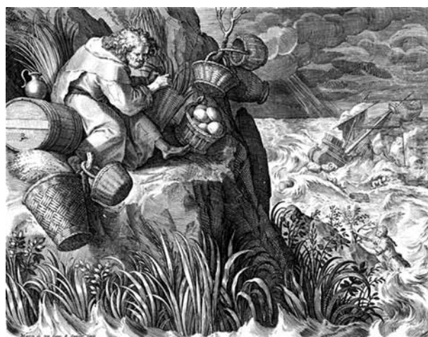
2. Johannes és Raphael Sadeler: Szent Martinianus, 1593–1594. Rézmetszet, papír

formátum miatt – nem szerepel sem a tájháttér, sem a többi remete.