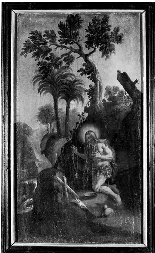
7. Huetter Lukács: Szent Onufrius, 1749–1760 között. Fa, olaj. Az egri irgalmas rendház ablaktáblájának részlete

A hatodik ablaktábla szent életű remetéket ábrázol. Felül Mutius, akit a már említett Solitudo sive vitae patrum eremicolarum című metszetsorozat 9. lapja után festett meg a művész (11–12. kép). 20 A tájhátrteret a metszethez képest módosította: hoz-