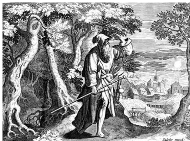
12. Johannes és Raphael Sadeler: Mutius remete, 1585–1586. Rézmetszet, papír

A harmadik ablaktáblán ábrázolt Szent Vilmos és Szent Onufrius remete életében csak az a közös vonás, hogy mindketten szerzetesként éltek egy ideig, majd a remeteséget, az aszkéta életmódot választották. Assisi Szent Ferenc és Egyiptomi Szent