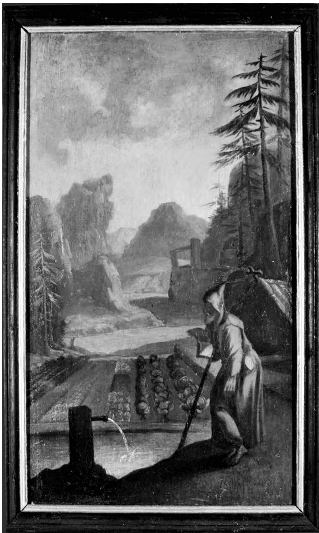
13. Huetter Lukács: Trieri Simeon remete, 1749–1760 között. Fa, olaj. Az egri irgalmas rendház ablaktáblájának részlete