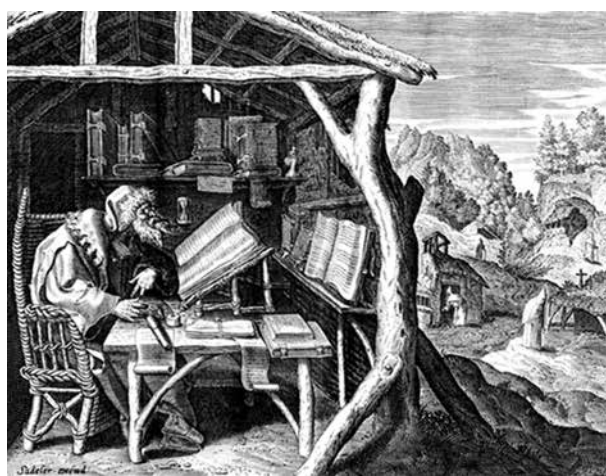
4. Johannes és Raphael Sadeler: Evagrius Ponticus , 1585–1586. Rézmetszet, papír

ta. Nagyon megrémült, eszébe jutottak bűnei, és ekkor pillantott meg egy Szűz Mária-képet. Arra kérte az Istenszülőt, engedje meg neki, hogy megláthassa