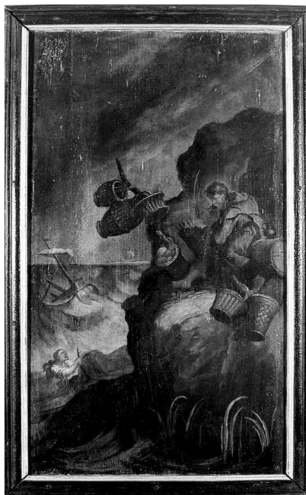
1. Huetter Lukács: Szent Martinianus, 1749–1760 között. Fa, olaj. Az egi irlalmas rendház ablaktáblájának részlete

Az ablaktáblán Evagrius egyszerű kunyhójában, íróasztalánál ül egy fonott karosszékben, és egy nagy, nyitott könyvet tanulmányoz. A kunyhóban könyvek és irattekercesek veszik körül. Az egi festmény a Solitudo sive vitae patrum eremicolarum (1585–1586) című metszetsorozat 19. lapja után készült (4. kép). 9 A rézmetszeten az is látható, hogy Evagrius egy szerzetesekből álló közösséghez tartozott, ahol mindenki egy-egy külön kunyhóban élt. Az egi ablaktáblán – valószínűleg a függőleges