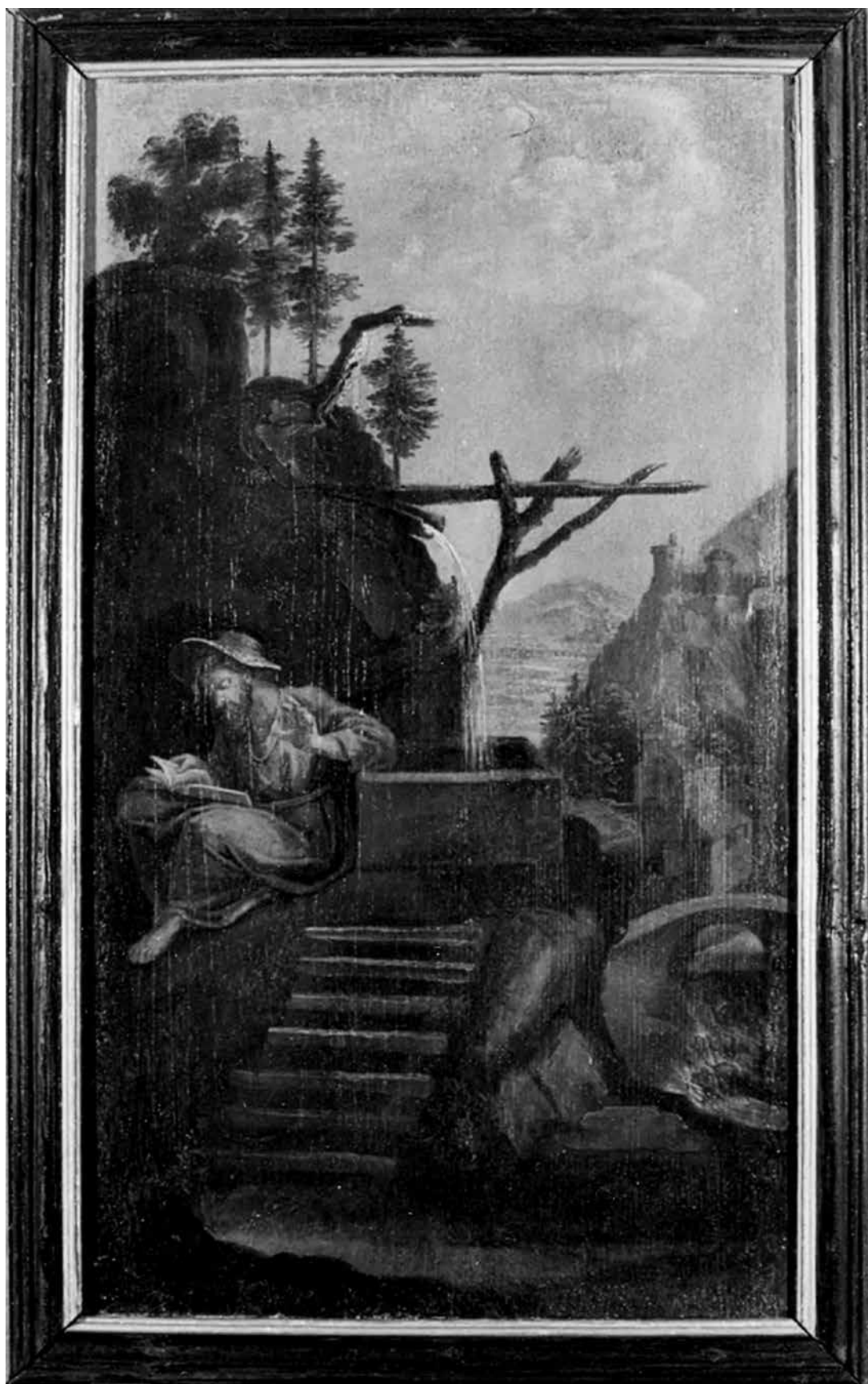
5. Huetter Lukács: Szent Venerius, 1749–1760 között. Fa, olaj. Az egri irgalmas rendház ablaktáblájának részlete