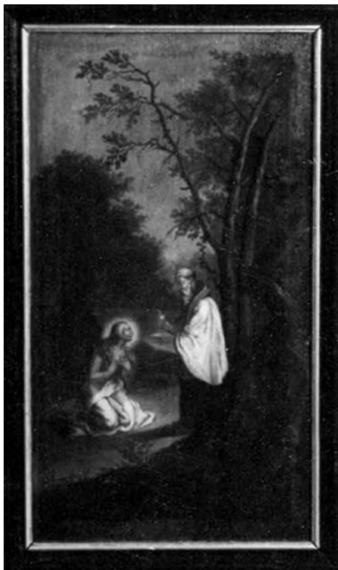
9. Huetter Lukács: Assisi Szent Ferenc stigmatizációja és Egyiptomi Szent Mária, 1749–1760 között. Fa, olaj. Az egri irgalmas rendház egyik ablaktáblája

A mezítlásbas Mutius kezét a szeméhez emelve a horizontot szemléli. Egy beteg, haldokló remete meglátogatására indult, és még több órás út állt előtte, a nap azonban lemenőben volt. Csoda történt: a nap megállt, és addig nem ment le, amíg Mutius meg nem érkezett a beteghez. 21