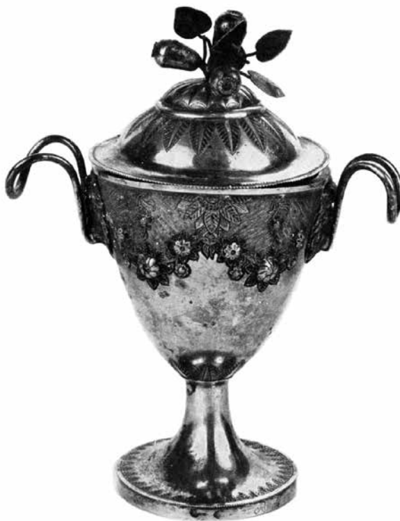
14. Samuel Bablirik: Cukortartó. Rozsnyó, 19. század első fele. Bratislava, Slovenské národné múzeum

Ugyanezt a jegykombinációt találtam egy kávéskanálán budapesti magángyűjteményben, és ez volt egy 2006-ban elárverezett empire fűszertartón is. 117