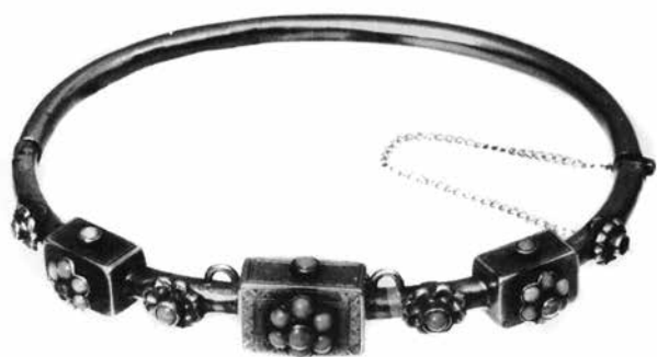
7. JH mester: Karkötő. Pest, 19. század közepe. Magántulajdon