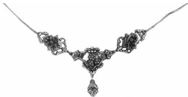
8. JH mester: Nyakék. Pest, 19. század közepe. Magántulajdon