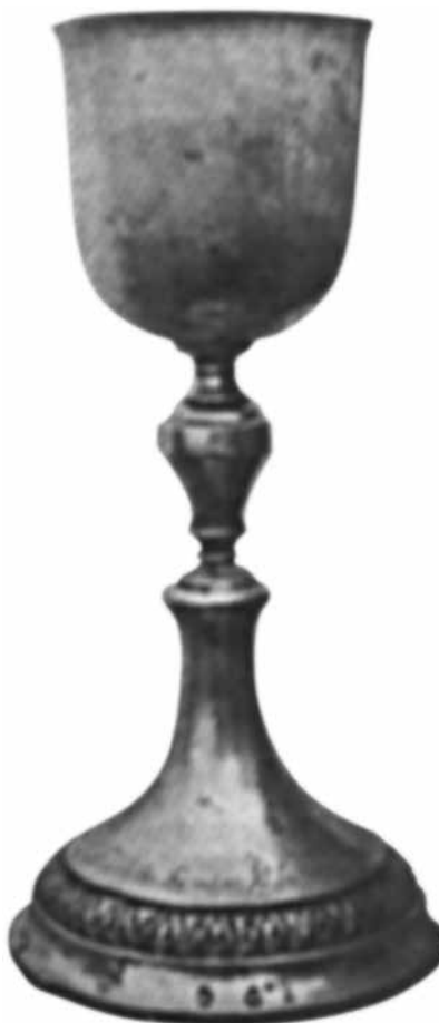
12. Nádudvary István: Kehely. Nagyvárad, 1805. Nagyszántói Református Egyházközség

június 1-jén. 1806. augusztus 7-én készített szabaddulási munkája, egy trébelt lemez nagyváradi próbajeggyel (K:1526) és Nádudvary mesterjeggyel (K:1551) a kassai múzeumba került. 95