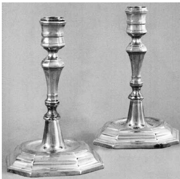
10. David Schuller: Gyertyatartópár. Eperjes, 18. század közepe. Magántulajdon

Budapesti árverésen tűnt fel 2007-ben egy 18. század közepén készült gyertyatartópár Eperjes új pró-