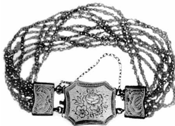
3. Redl József: Karkötő. Pest, 19. század közepe. Magántulajdon