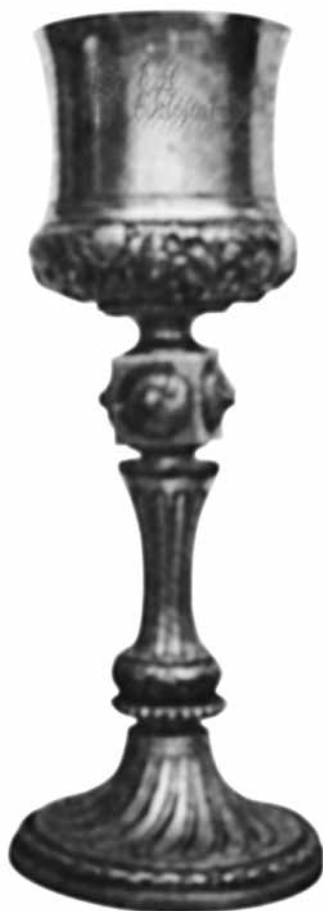
13. Nádudvary István: Kehely. Nagyvárad, 1807. Hegyközsztári Református Egyházközség

mind világi célra. Gyulai kelyhét már említettem, de a Nagyvárad Református Egyházmegye három egyházközsége is rendelkezik Nádudvary által készített kehellyel, mégpedig a Várad-Olaszi (1816), a Nagyszántói (1805) és a Hegyközsztári Református Egyházközség (1807). 100 A kelyheken a nagyvárad próbajegy és K:1551 mesterjegy mellett eddig máshol még nem közölt „F” és „H” évbetu is van. Már Kőszeghy is ismert Nádudvary által készített kávé- és tejeskannát nagyvárad magángyűjteményből. 101 Ma kávéskannája 102 és tejeslábasa 103 található a Magyar Nemzeti Múzeumban. Nagyon szép fedeles cukortartója volt a kiskunmajsai Kovács-gyűjteményben csonka K:1530 próbajeggel, K:1551 mesterjeggel és „H” évbetuvel. 104