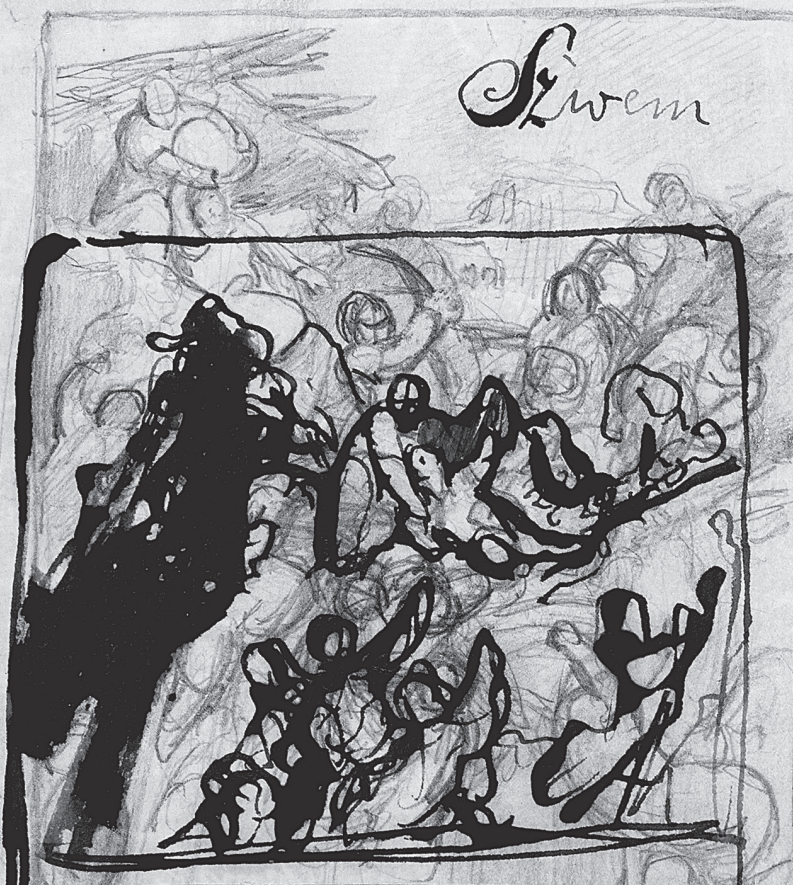
11. Székely Bertalan: Vázlat az Egri nőkhöz, 1859. Magyar Nemzeti Galéria, Grafikai Osztály, ltsz. 1915-1760, 171. lap