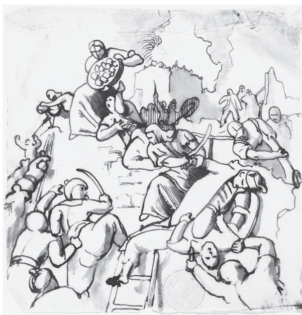
10. Székely Bertalan: Vázlat az Egri nőkhöz, 1860. Magyar Nemzeti Galéria, Grafikai Osztály, ltsz. 1915-1760, 173. lap

férje kezét fogó amazont látunk 71 (10. kép). Két 1860 végén készült szépiarajz jeleneteit is a két történet inspirálta: az egyik kép felső részén a lány kezében a kosár követ látjuk, amint a törökre dobja, alatta egy hátulról ábrázolt fekete ruhás, kendős nő estében nyúl a kosárért 72 (12. kép). Egy másik vázlatrajzon a fiatal nő szintén eldobja a követ, a fekete ruhás idős nő pedig lehanyatlik vagy nyúl érte, de itt előlről ábrázolva 73 (13. kép). Mindkét kompozíció középpontjában a halott férjétől a kardot elvevő nő látható, egyiken átöleli lehanyatló férjét, a másikon a kezét fogja. Ezeken a vázlatokon tehát már az olajfestmény fiatal nő – fekete ruhás idős nő párosa jelenik meg, de az idős nő még nem a fiatal mellett áll, hanem elesik vagy guggol. A vázlatokon szereplő, követ dobó leányt és a haldokló vagy halott anyát „a végleges változaton ott látjuk...együtt, küszködve a kövekkel teli kosárral. A nagy mű főalakjai nem az anya és leánya csoportja, hanem az elbukó férje kezéből kardját kiragadó amazon lett.” 74