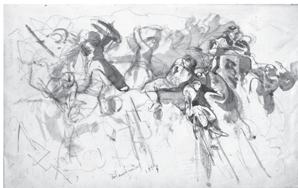
8. Székely Bertalan: Vázlat az Egri nőkhöz, 1857. Magyar Nemzeti Galéria, Grafikai Osztály, ltsz. 1915-1760, 13v (14)

Ennél is egyértelműbben kimutatható a történeti források hatása egy 1860 januárjában keletkezett vázlaton, melyen fent egy kosárból köveket ledobó nőt, egy előtte összeeső asszonyt, illetve – a kép közepén – az egyik kezében kardot, a másikban halott