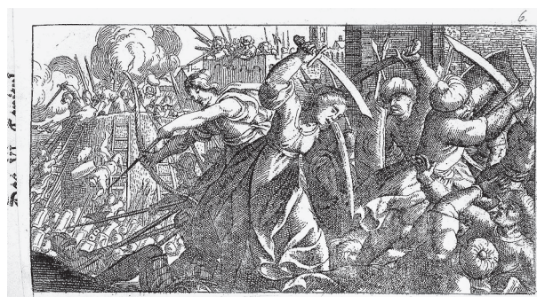
2. Könyvillusztráció. Hungarisch-Türkische Chronick ... Nürnberg, 1685. 128–129.