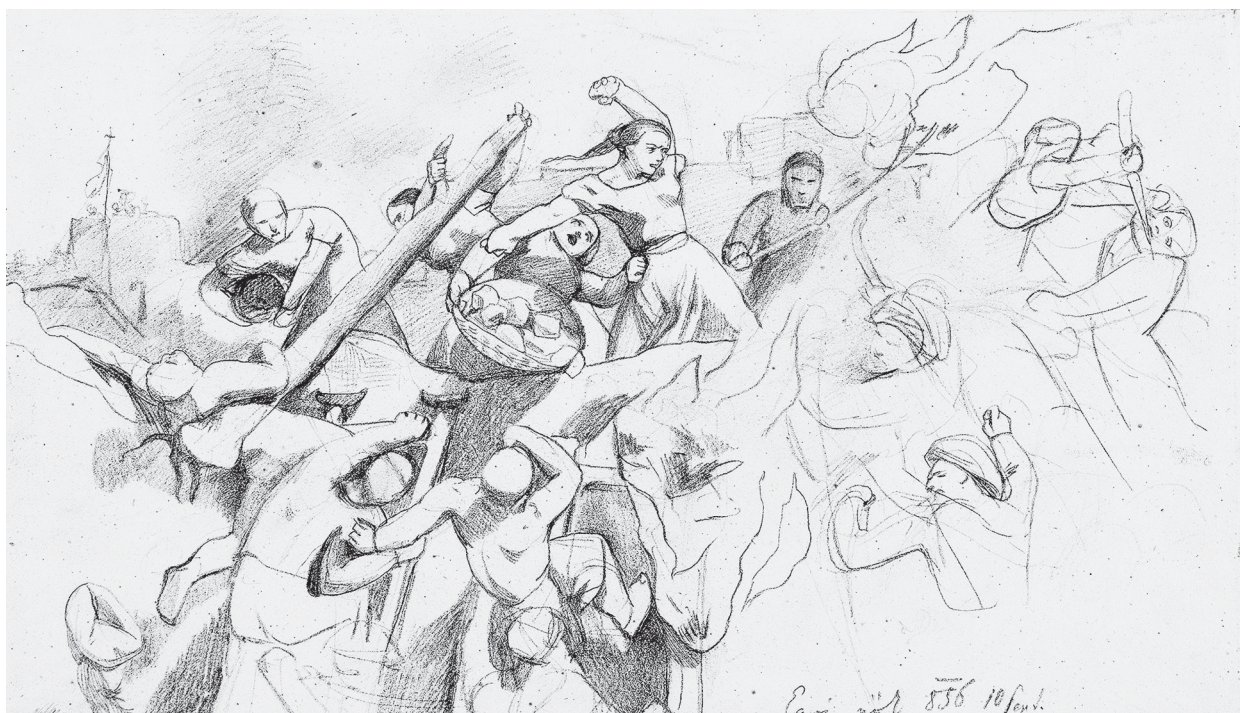
7. Székely Bertalan: Vázlat az Egri nőkhöz, 1856. Magyar Nemzeti Galéria, Grafikai Osztály, ltsz. 1917-351