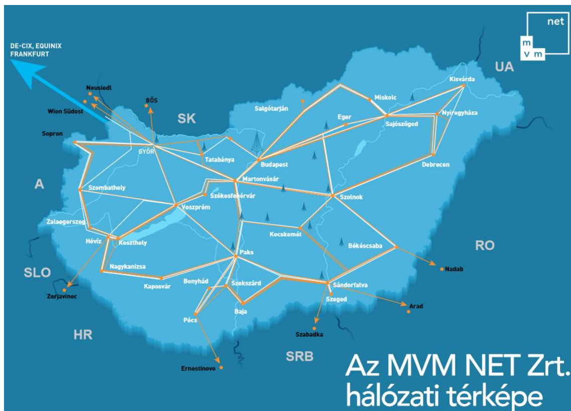
3. ábra A Nemzeti Távközlési Gerinchálózat