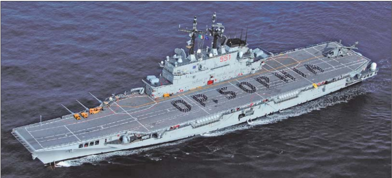
1. ábra. Az EU NAVFOR MED misszió zászlóshajója az ITS GARIBALDI helikopter-hordozó