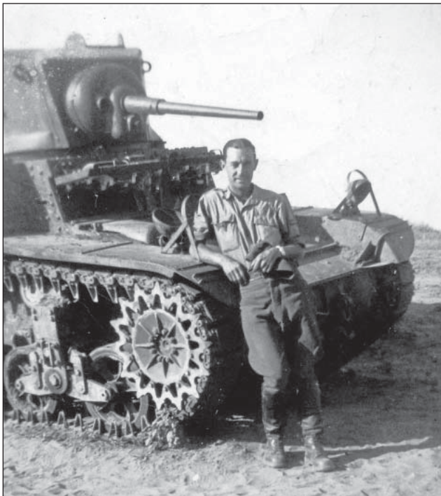
13. ábra. Egy zsákmányolt M3 Stuart „lend-lease” harckocsi