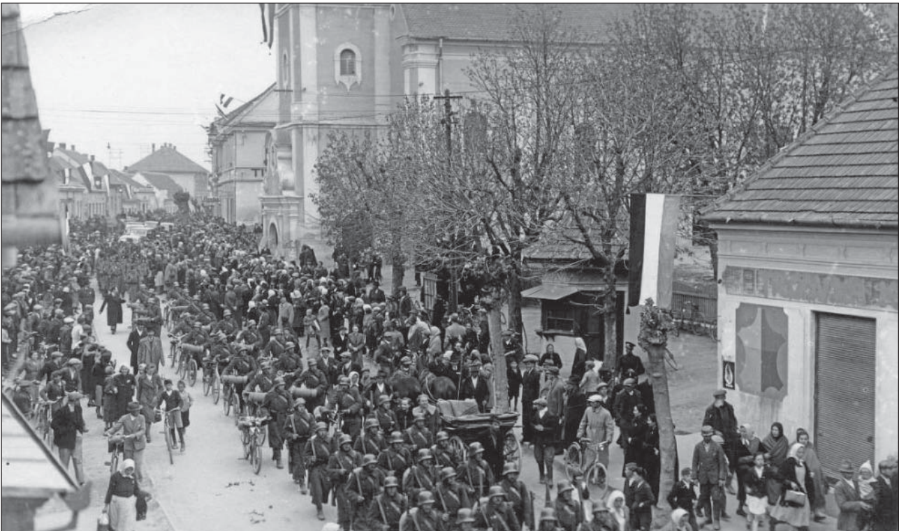
103. ábra. Délvidéki bevonulás Muravidéken – Alsólendván