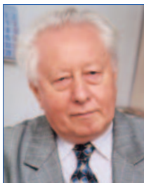
Dr. Láng István akadémikus az Országos Környezet- védelmi Tanács elnöke

Az Európai Bizottság 2001-ben tanulmányt készített arról, hogy milyen előnyökkel számolhat Magyarország, ha megfelel a szigorú környezetvédelmi követelményeket támaztó közösségi jogszabályoknak. A prognózis szerint a teljes megfelelés időpontjától számítva 2020-ig hazánk évenkénti haszna minimálisan a GDP 2,2 százalékára rúg majd. Ez jóval több, mint az összes környezetvédelmi ráfordításnak a GDP százalékában becsült mai mértéke, amely 1 százalékot tesz ki. Optimális esetben ez az arány akár a többszörösét is elérheti. A teljesítéséből eredő pozitívumok különböző területeken jelentkehetnek. A természeti erőforrások kisebb terheléséből