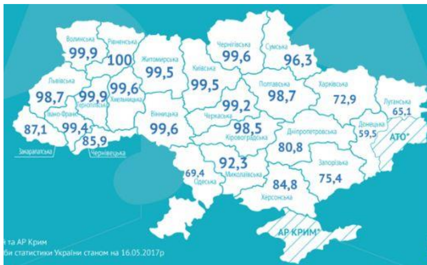
2. térkép Az ukrán tannyelvű iskolák aránya Ukrajna megyéiben (2017) 45

utóbbiak aránya nem jelentős, azért némiképp mégis torzítja a képet a részletesebb adatok hiánya.